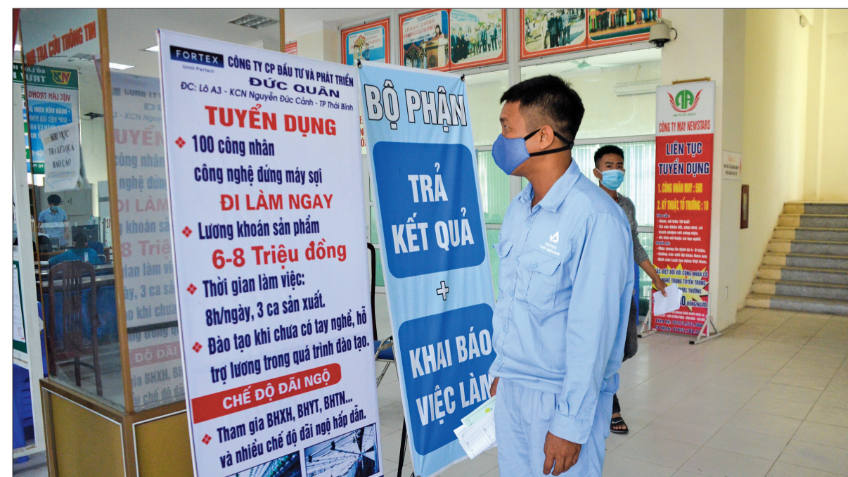
Người lao động tìm việc làm tại Trung tâm Dịch vụ việc làm Thái Bình.