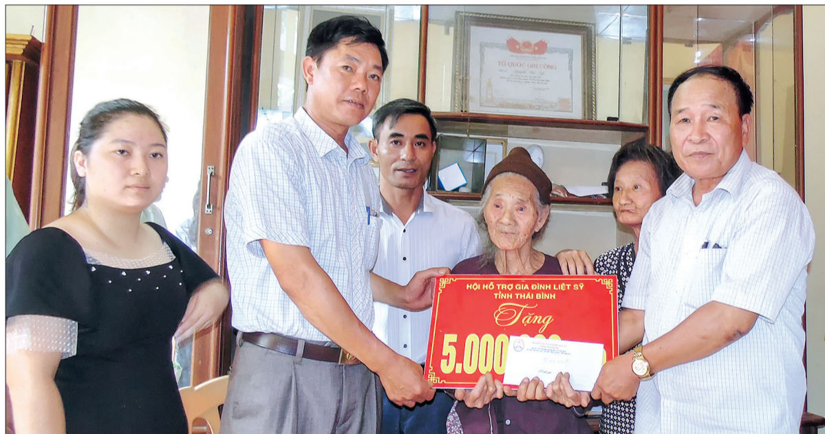
Hội Hỗ trợ gia đình liệt sĩ tỉnh trao sổ tiết kiệm cho thân nhân liệt sĩ.

Nhiệm kỳ 2016 - 2021, với phương châm "Mọi hoạt động hướng về thân nhân liệt sĩ", Hội Hỗ trợ gia đình liệt sĩ tỉnh đã hỗ trợ các gia đình liệt sĩ tiếp cận, thực hiện và thụ hưởng chế độ, chính sách của Đảng, Nhà nước; giúp các gia đình liệt sĩ thu thập thông tin tìm kiếm hài cốt liệt sĩ; trở thành ngôi nhà chung của thân nhân liệt sĩ, là cầu nối để các gia đình liệt sĩ gửi gắm niềm tin.