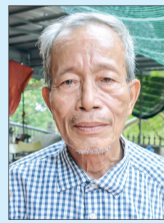
Ảnh tư liệu

Được sự giúp đỡ của Hội Hỗ trợ gia đình liệt sĩ tỉnh, Chi hội Hỗ trợ gia đình liệt sĩ huyện Đông Hưng được thành lập tháng 10/2018, đến nay có 42 hội viên. Với tôn chỉ, mục đích hỗ trợ các gia đình liệt sĩ tiếp cận, thực hiện và thụ hưởng chế độ, chính sách của Đảng, Nhà nước; giúp các gia đình liệt sĩ thu thập thông tin tìm kiếm hài cốt liệt sĩ, từ khi thành lập đến nay, cùng với việc quan tâm, chăm lo cho các gia đình liệt sĩ, Chi hội đã phối hợp tư vấn, trợ giúp pháp lý cho các gia đình liệt sĩ; cung cấp, xác minh thông tin về phần mộ giúp một số gia đình liệt sĩ tìm được phần mộ của người thân đưa về quy tập tại nghĩa trang địa phương. Trong thời gian tới, Chi hội Hỗ trợ gia đình liệt sĩ huyện Đông Hưng tập trung phát triển hội viên, xây dựng chi hội vững mạnh, tranh thủ nguồn lực và huy động xã hội hóa, tiếp tục quan tâm, chăm lo nhiều hơn nữa đối với thân nhân các liệt sĩ trên địa bàn huyện.