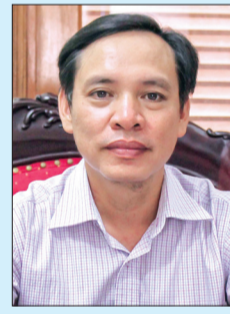
Ảnh tư liệu

Nhiệm kỳ 2016 - 2021 là nhiệm kỳ đầu tiên của Hội Hỗ trợ gia đình liệt sĩ tỉnh. Dù mới đi vào hoạt động song Hội đã tích cực phối hợp với chi hội hỗ trợ gia đình liệt sĩ các huyện, thành phố trong việc quan tâm, chăm lo cho các gia đình liệt sĩ và xác minh thông tin, tìm kiếm các phần mộ liệt sĩ. Với huyện Vũ Thư, Hội Hỗ trợ gia đình liệt sĩ tỉnh đã phối hợp với Chi hội Hỗ trợ gia đình liệt sĩ huyện kêu gọi, vận động từ các tổ chức, đơn vị, doanh nghiệp hỗ trợ kinh phí xây dựng được 3 nhà tình nghĩa, trao 4 sổ tiết kiệm và tặng nhiều phần quà cho thân nhân liệt sĩ. Mong muốn trong nhiệm kỳ 2021 - 2026, Hội Hỗ trợ gia đình liệt sĩ tỉnh tiếp tục phát huy vai trò, xây dựng Hội ngày càng vững mạnh, là ngôi nhà chung, cầu nối để giúp đỡ thân nhân liệt sĩ, đặc biệt là trong việc tìm kiếm, xác minh thông tin để các phần mộ liệt sĩ sớm được quy tập về địa phương.