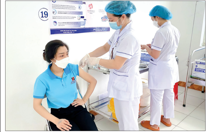
Tiêm vắc-xin phòng Covid-19 tại Bệnh viện Đa khoa Vũ Thư.