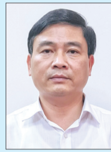
Ảnh tư liệu

Ra đời và hoạt động trong điều kiện, hoàn cảnh có nhiều khó khăn, nhất là do mới thành lập song qua 5 năm hoạt động, Hội Hỗ trợ gia đình liệt sĩ tỉnh đã luôn thực hiện nghiêm túc chỉ, mục đích "tôn vinh và tri ân các anh hùng liệt sĩ, gia đình liệt sĩ và mẹ Việt Nam anh hùng, hỗ trợ các gia đình liệt sĩ tiếp cận, thực hiện và thụ hưởng chế độ, chính sách của Đảng, Nhà nước, góp phần giúp các gia đình liệt sĩ thu thập thông tin tìm kiếm hài cốt liệt sĩ còn thất lạc, chưa xác định được danh tính...". Thời gian hoạt động chưa nhiều, do đó còn những vướng mắc, bất cập và tồn tại nhất định nhưng các hội viên, đặc biệt là Ban Thường vụ Hội đã cùng nhau vượt qua khó khăn, làm việc với trách nhiệm cao và đạt nhiều kết quả đáng khích lệ. Trên tinh thần đổi mới, đoàn kết, thống nhất nội bộ,