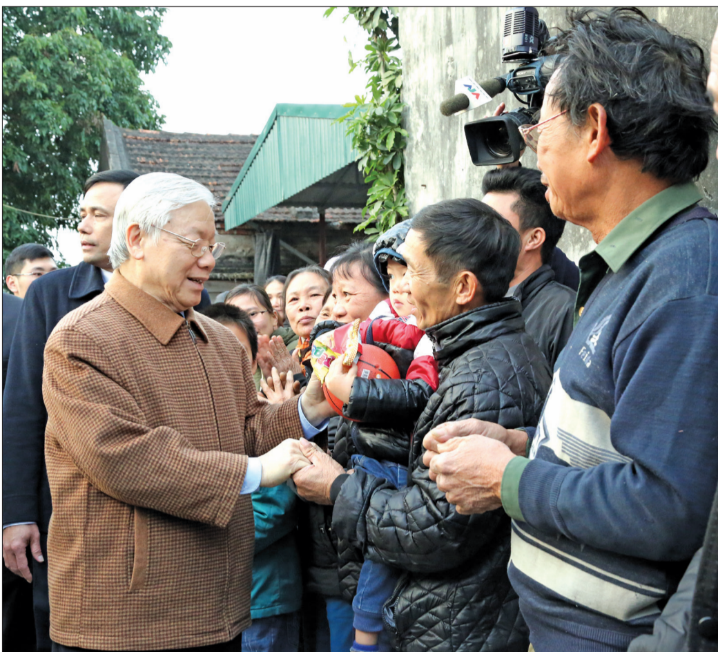
Tổng Bí thư Nguyễn Phú Trọng với người dân xã Tây An (Tiền Hải), ngày 1/2/2018.

Vấn đề đoàn kết trong Đảng, theo Tổng Bí thư không phải theo kiểu "cánh hẩu, để người để ta" mà phải đoàn kết trên cơ sở nguyên tắc, Điều lệ Đảng. Phải đề cao đấu tranh tự phê bình và phê bình để tổ chức đảng ngày càng vững mạnh, từng đảng viên lấy đó mà "tự soi, tự sửa" cùng nhau tiến bộ, trưởng thành.