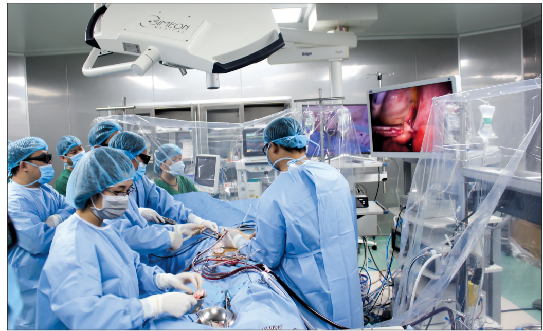
Các bác sĩ trong ca phẫu thuật tim nội soi 3D tại Bệnh viện Đa khoa tỉnh.

bình quân chung của cả nước. Đến hết năm 2020, 17/21 bệnh viện công lập đã chuyển sang hoạt động theo loại hình đơn vị có nguồn thu sự nghiệp, tự bảo đảm hoàn toàn chi thường xuyên, từng bước giảm biên chế sự nghiệp hưởng lương từ ngân sách nhà nước,