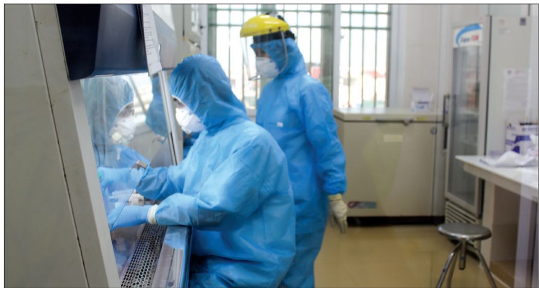
Cán bộ Trung tâm Kiểm soát bệnh tật tỉnh xử lý mẫu bệnh phẩm của người có nguy cơ nhiễm Covid-19.

Trước một đại dịch lớn, lực lượng y tế dự phòng, vận chuyển, điều trị bệnh nhân nhiễm Covid-19 không cho phép mình nghỉ ngơi cũng như lơ là trong thực hiện nhiệm vụ. Tạm gác lại niềm vui riêng, gửi lại con nhỏ, công việc gia đình cho những người thân, họ bước vào trận chiến với quyết tâm sớm đẩy lùi dịch Covid-19, bảo vệ sức khỏe nhân dân đầu con đường phía trước còn nhiều khó khăn, vất vả và cả hiểm nguy.