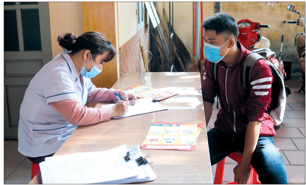
Người dân đến Trạm Y tế phường Trần Lâm (thành phố Thái Bình) khai báo y tế.