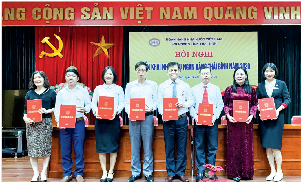
Các phòng và tổ chức đoàn thể ký giao ước thi đua năm 2020.

thực hiện nhiệm vụ chính trị của cơ quan.