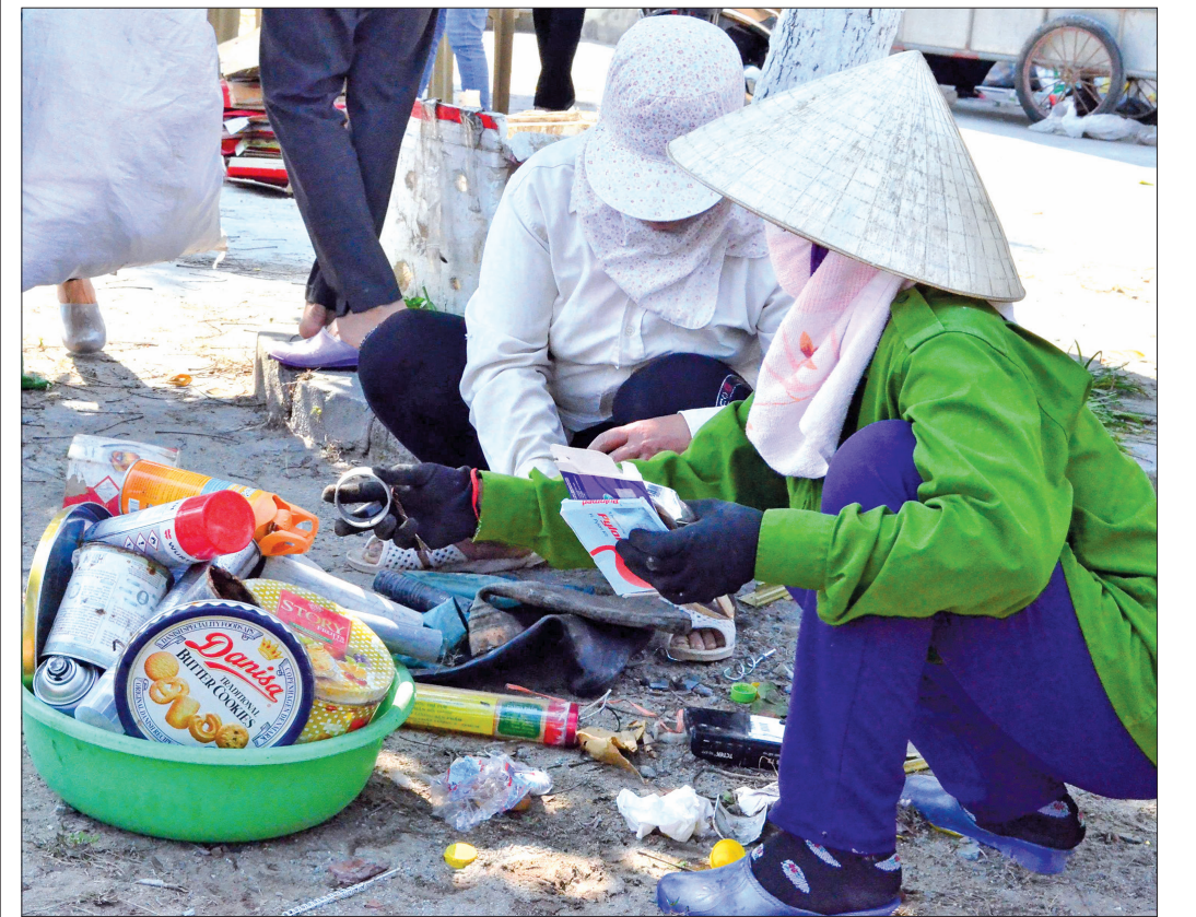
Phụ nữ xã Thụy Bình (Thái Thụy) gom phế liệu bán gây quỹ giúp phụ nữ, trẻ em nghèo.