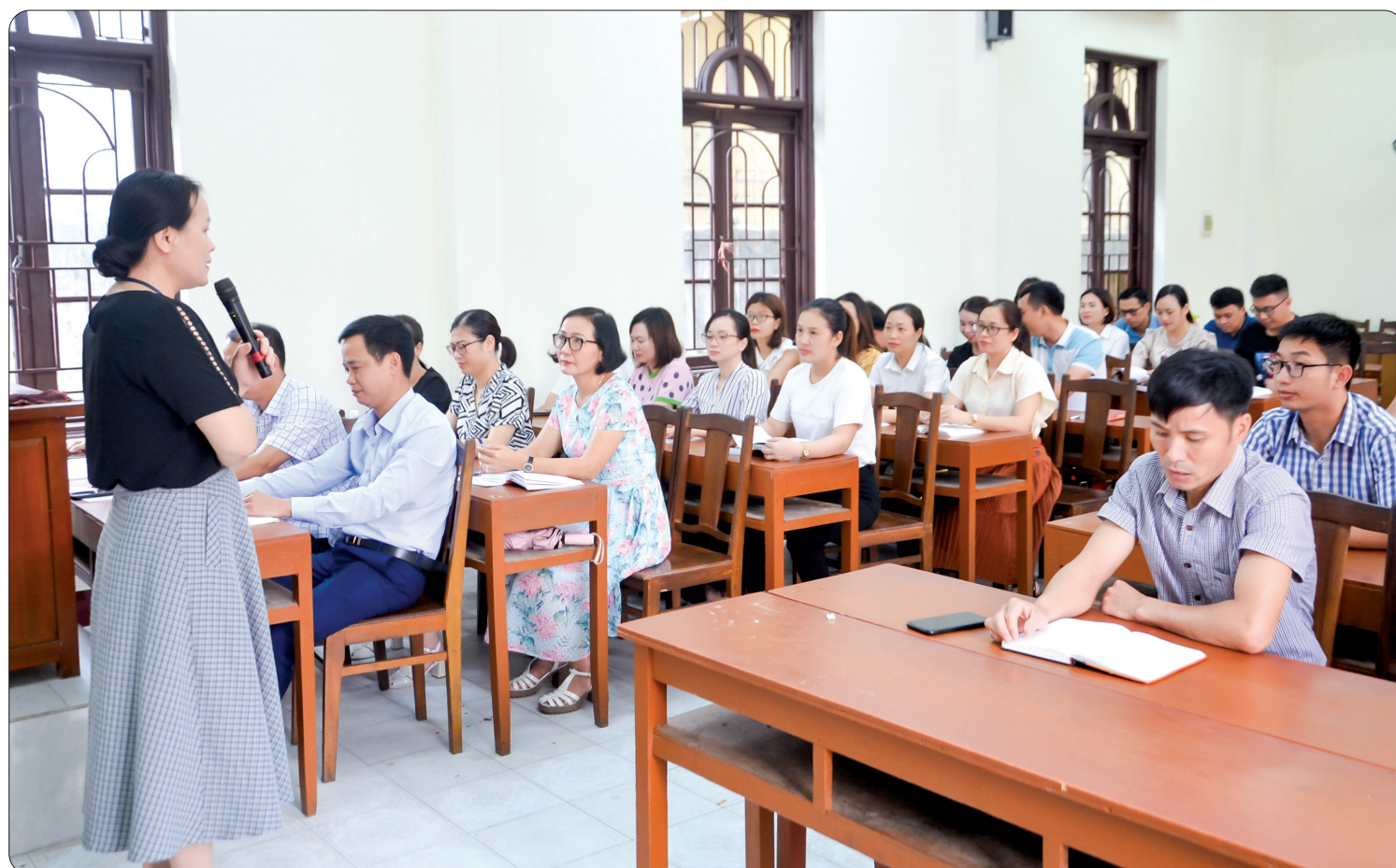
Ngoài thường xuyên đổi mới chương trình, nội dung đào tạo, bồi dưỡng, Trường Chính trị tỉnh còn khuyến khích giảng viên, học viên tích cực tham gia nghiên cứu khoa học và các cuộc thi.