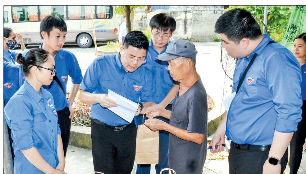
Khám chữa bệnh, cấp thuốc miễn phí cho trên 100 thương binh, bệnh binh, gia đình chính sách tại xã Hồng An.

Với chủ đề “Thắp lửa truyền thống, sáng mãi niềm tin”, chiến dịch “Kỳ nghỉ hồng” của Huyện đoàn Hưng Hà năm 2024 gồm các hoạt động: Trao tặng 7 bộ máy tính cho 7 xã tham gia mô hình “Chính quyền thân thiện, vì nhân dân phục vụ” trên địa bàn huyện với số tiền trên 50 triệu đồng; trao tặng 200 ba lô và 200 bộ dụng cụ học tập cho các em thiếu niên, nhi đồng có hoàn cảnh khó khăn vượt lên trong học tập; trao tặng 2 tủ sách với 1.000 quyển sách cùng với 1.000 voucher tiếng Anh online trọn đời (dành