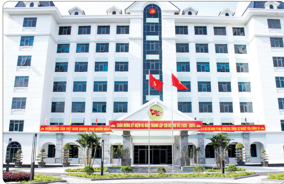
Trụ sở Huyện ủy Vũ Thư, công trình chào mừng 95 năm thành lập Chi bộ Thư Vũ (1929 - 2024), 55 năm thành lập huyện Vũ Thư (1969 - 2024).

đến cuối năm 1970, Đảng bộ huyện đã có hơn 5.400 đảng viên, đến nay toàn Đảng bộ có gần 10.000 đảng viên, sinh hoạt ở 48 tổ chức cơ sở đảng.