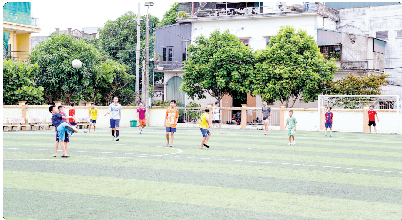
Sân vận động thôn Tam Lạc, xã Vũ Lạc (thành phố Thái Bình) được đầu tư từ nguồn xã hội hóa.

SVD thôn Tam Lạc là một trong những SVD quy mô cấp thôn trên địa bàn tỉnh được trang bị cơ sở vật chất hoàn toàn huy động nguồn xã hội hóa đã mang lại những lợi ích thiết thực, không chỉ góp phần gắn kết tình đoàn kết của người dân mà còn tạo sân chơi lành mạnh rèn luyện sức khỏe, thúc đẩy phong trào thể dục thể thao tại địa phương phát triển.