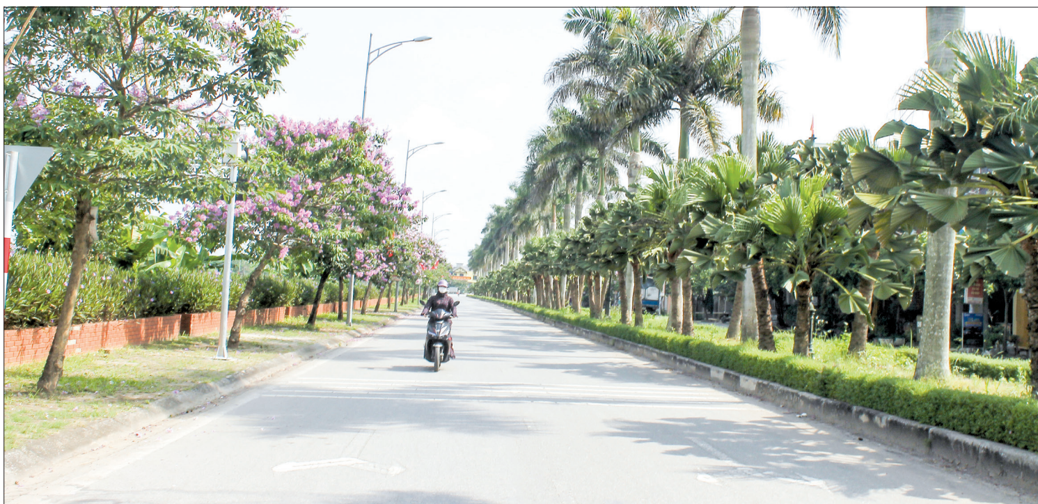
Diện mạo nông thôn xã Tân Hòa (Vũ Thư).

với lý tưởng của Đảng, quyết tâm nỗ lực học tập, lao động, gương mẫu trong các phong trào thi đua yêu nước, đóng góp công sức, trí tuệ góp phần xây dựng quê hương ngày càng giàu đẹp, văn minh, xứng đáng là người đảng viên của Đảng bộ huyện có bề dày 95 năm xây dựng và trưởng thành.