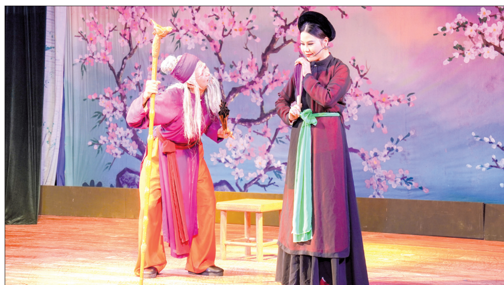
Vở chèo cổ thu hút nhiều diễn viên trẻ tài năng của Nhà hát Chèo Thái Bình tham gia.