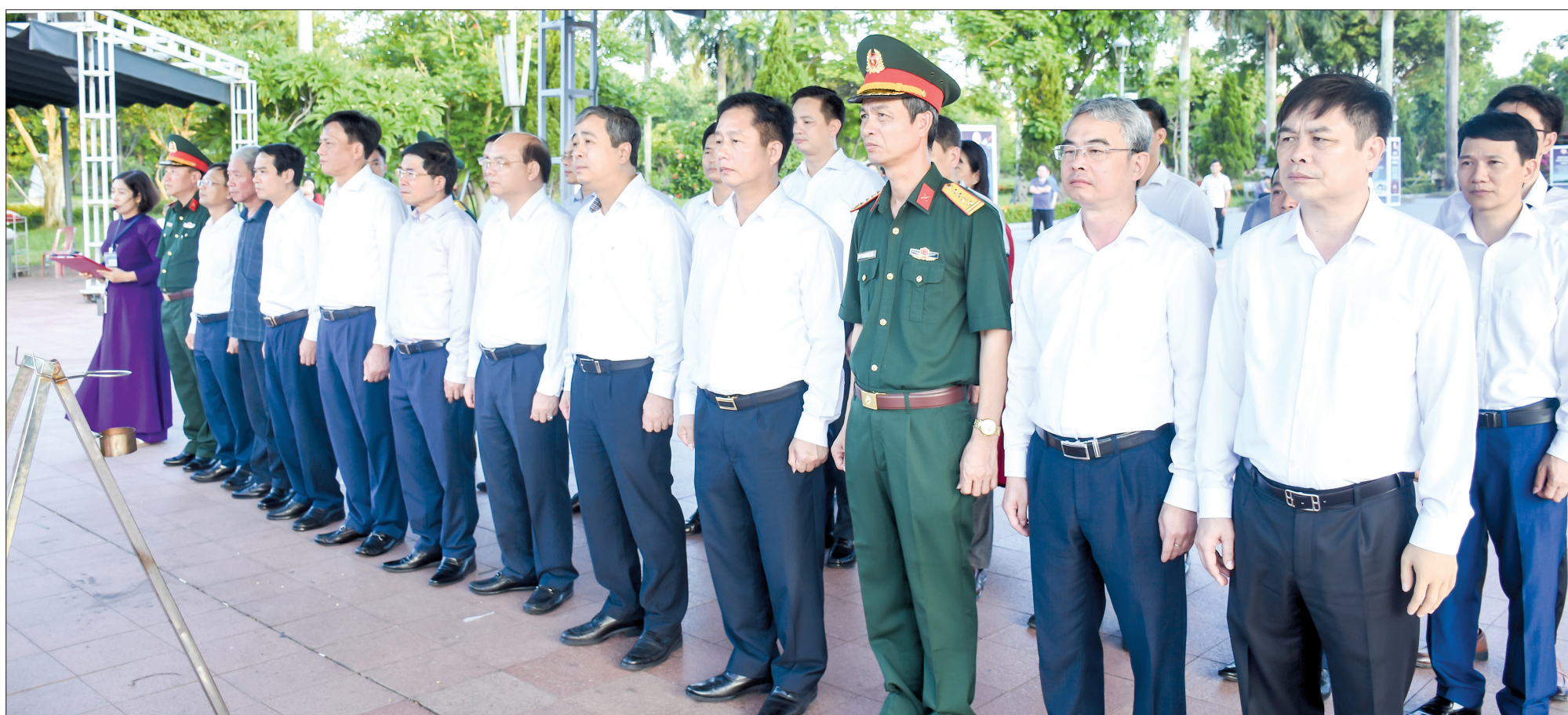
Đoàn đại biểu Tỉnh ủy, HĐND, UBND, Ủy ban MTTQ tỉnh dâng hương tưởng niệm các anh hùng liệt sĩ tại Di tích quốc gia đặc biệt Thành cổ Quảng Trị.

Hướng tới kỷ niệm 77 năm ngày Thương binh - Liệt sĩ (27/7/1947 - 27/7/2024), chiều ngày 13/7, đoàn đại biểu Tỉnh ủy, HĐND, UBND, Ủy ban MTTQ tỉnh tổ chức lễ dâng hương tưởng