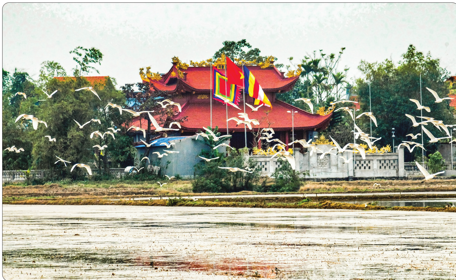
Đền Ngạn, còn gọi là Thượng Ngạn, xã Văn Lang, huyện Hưng Hà - nơi thờ Đức Đại đạo Thiên Tôn, thời vua Hùng thứ 17.

Theo tài liệu khảo cứu, thời vua Lý Nhân Tông (1066 - 1128), công chúa Phương Hoa đã về trang Diên Phúc đến Tháp Khu (làng Ngạn, còn gọi là Thượng Ngạn, xã Văn Lang, huyện Hưng Hà) rước chân hương Phật Thiên Tôn về thờ, muôn đời hương khói. Từ đấy về sau, trải qua các triều đại Đinh, tiền Lê, Lý, Trần, hậu Lê... các nghi lễ “quốc tế” cầu nước thịnh, dân an đều rất linh ứng. Các triều đại tiếp theo gia phong Đại Vương, chuẩn y cho nhân dân Tháp Khu trang Thượng Ngạn thờ phụng muôn đời.