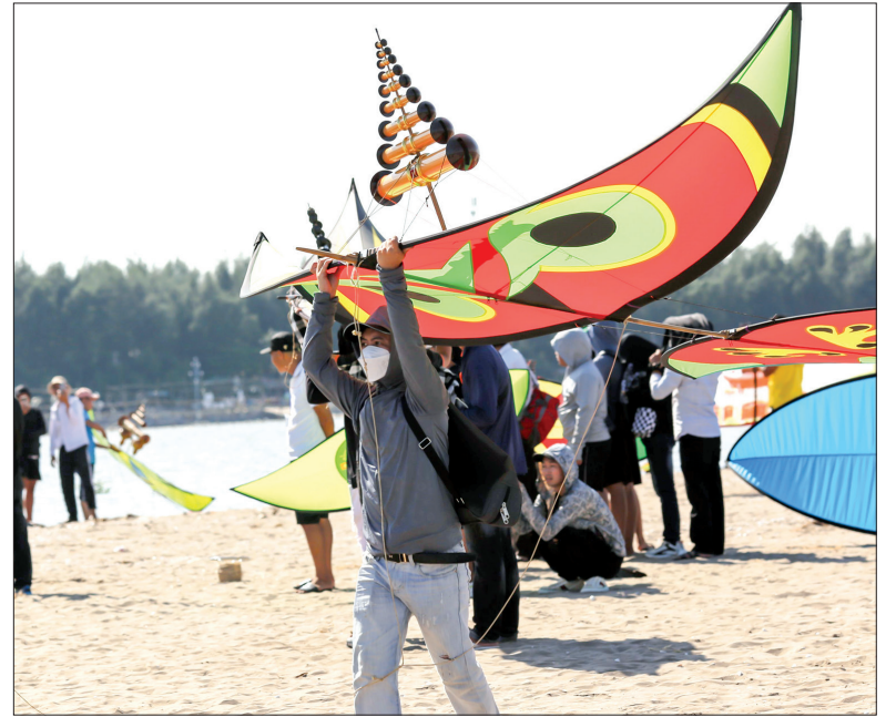
Mỗi con điều sáo mang biệt bao kỳ công của người chơi.