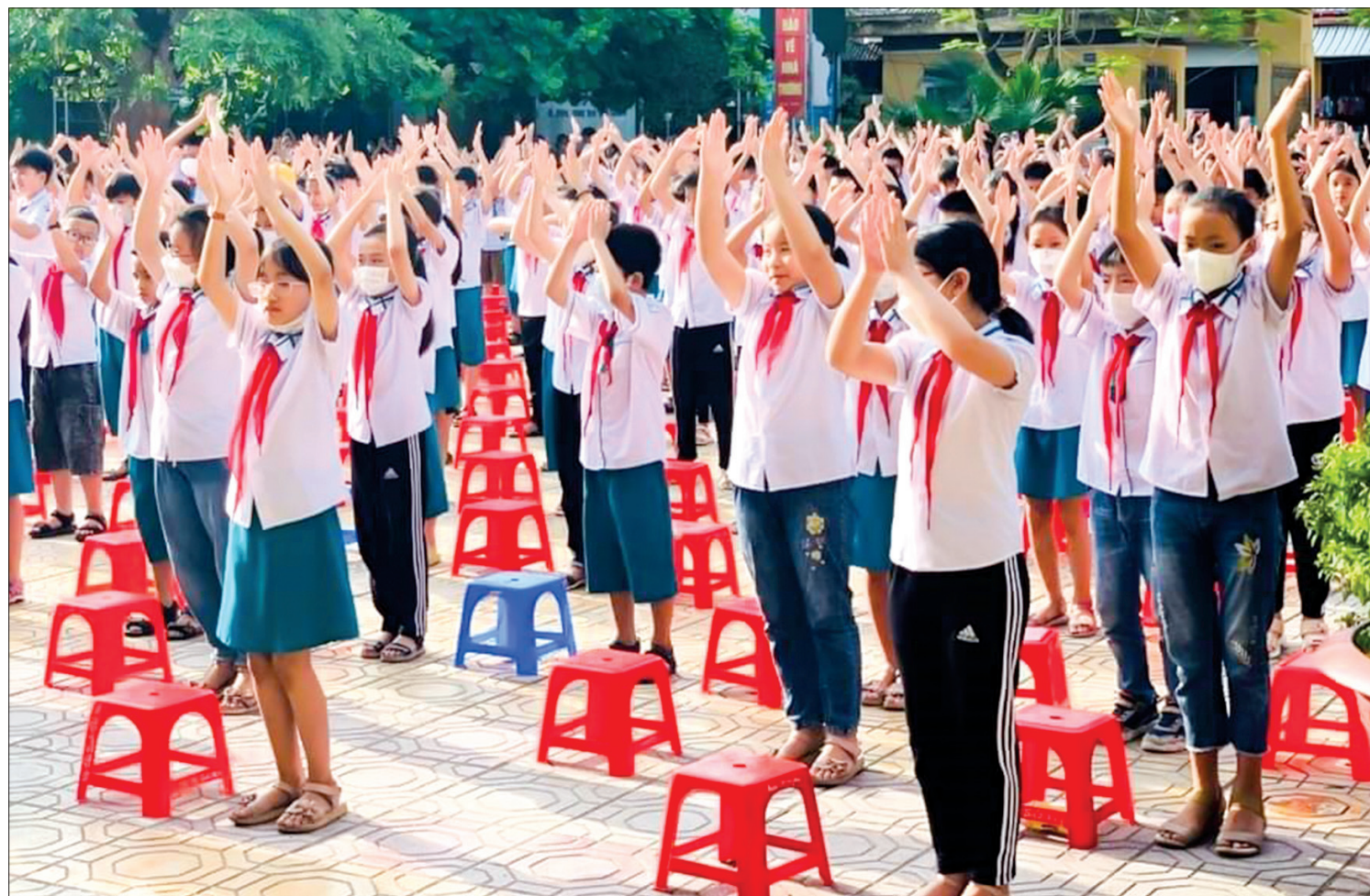
Hoạt động ngoại khóa của học sinh Trường Tiểu học Diêm Điền (Thái Thụy).

Cùng với việc tham gia các đợt tập huấn, bồi dưỡng do các cấp tổ chức, để nâng cao chất lượng giáo dục, hơn ai hết, mỗi cán bộ, giáo viên cần nỗ lực rèn luyện, phấn đấu tự học, tự bồi dưỡng để nâng cao trình độ chuyên môn, nghiệp vụ, tận tụy với nghề, trau dồi phẩm chất, đạo đức, lối sống mẫu mực, xứng đáng với niềm tin yêu của phụ huynh, học sinh và đáp ứng hiệu quả yêu cầu đổi mới giáo dục hiện nay.