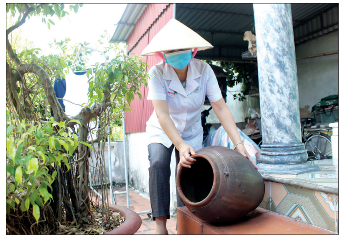
Nhân viên y tế lật úp các dụng cụ chứa nước đọng lâu ngày phòng, chống sốt xuất huyết.