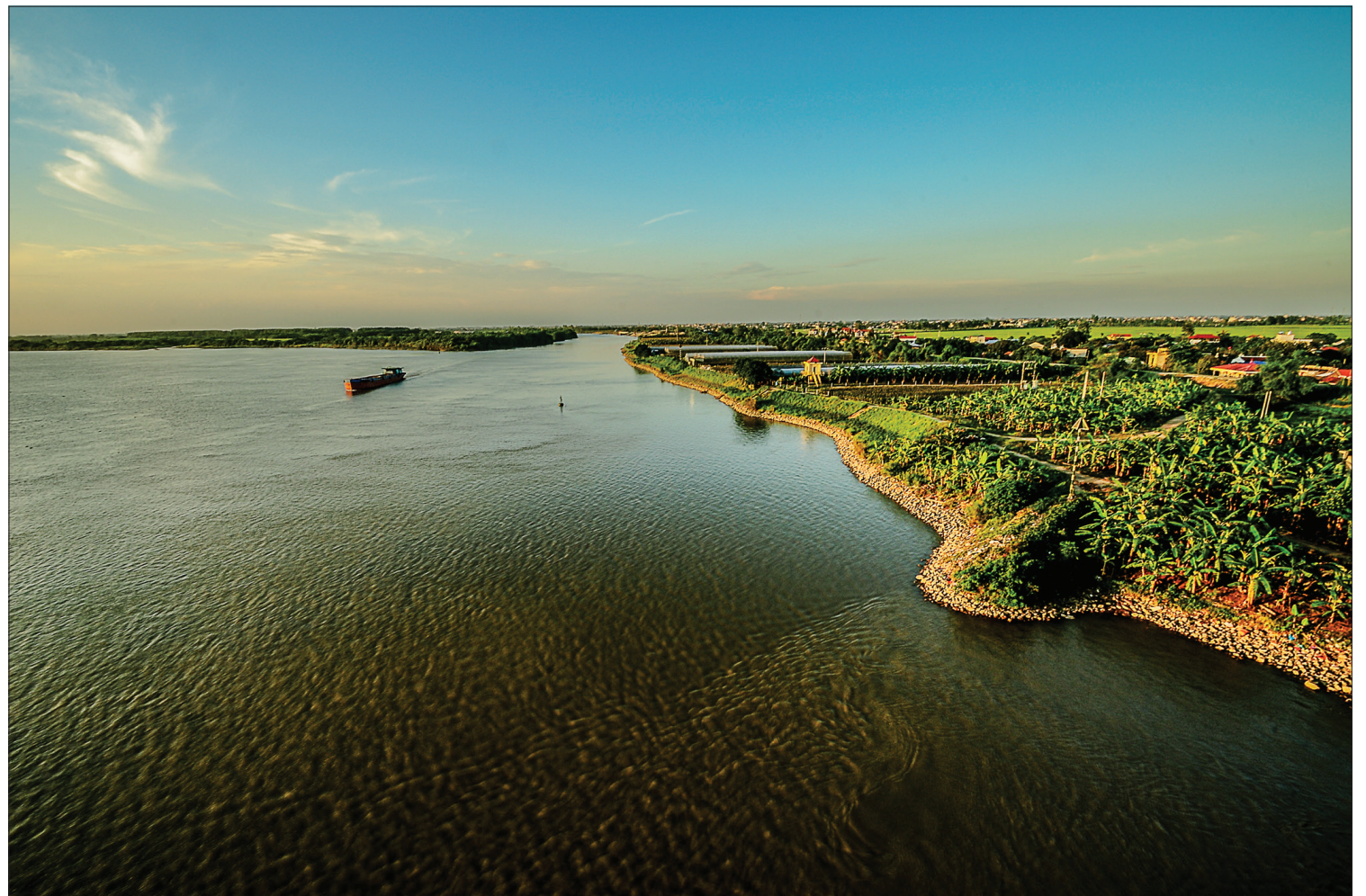
Chi lưu sông Hồng và sông Luộc, một trong những “giang môn” trọng yếu thời Lý - Trần và các triều đại về sau trong sự nghiệp bảo vệ giang sơn Đại Việt.