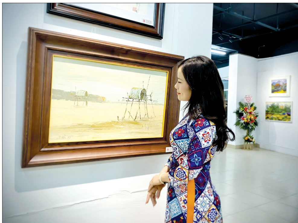
Triển lãm thu hút đông đảo công chúng yêu nghệ thuật.

Với 58 tác phẩm trực họa của 21 họa sĩ trẻ Thái Bình, triển lãm mang đến cho người xem cảm xúc đặc biệt, những rung động mãnh liệt tạo nên sự hòa quyện của người họa sĩ với thiên nhiên tươi đẹp.