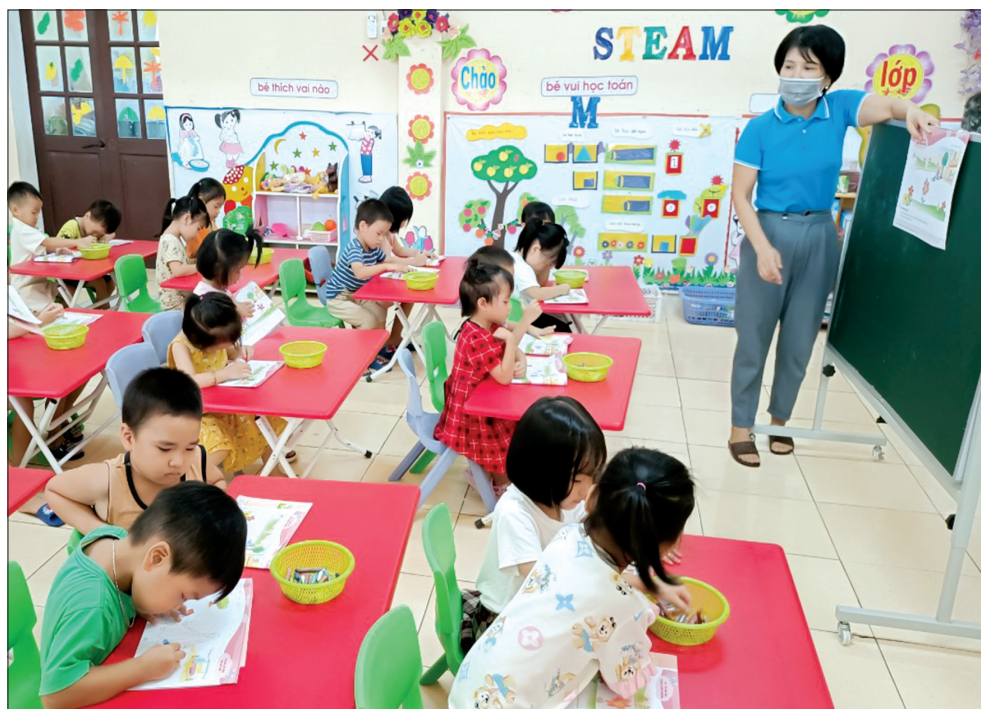
Huyện Vũ Thư tuyển dụng 276 viên chức giáo dục năm 2022, trong đó có 142 giáo viên mầm non.