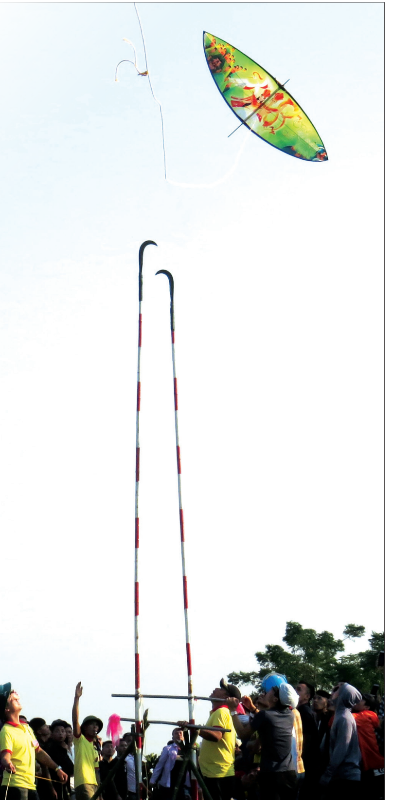
Hội thi điều sáo vượt cầu liêm thu hút sự tham gia của nghệ nhân điều từ mọi miền đất nước. Vượt qua được cầu liêm là thách thức không nhỏ đối với mỗi con điều.

cao cùng tiếng pháo đất nổ vào thời điểm giao mùa này có thể xua tan mọi khí độc, dịch bệnh, giúp con người khỏe mạnh, trở nên vui tươi hơn. Sự chuẩn bị công phu con điều sáo, sự tập luyện nhuần nhuyễn giữa những người chơi điều để vượt qua được cầu liêm đã tạo nên sự tài hoa của người chơi, tạo không khí phấn khởi, hồ hởi của tất cả những người tham gia lễ hội.