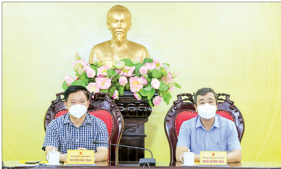
Các đồng chí lãnh đạo tỉnh dự hội nghị tại điểm cầu Thái Bình.