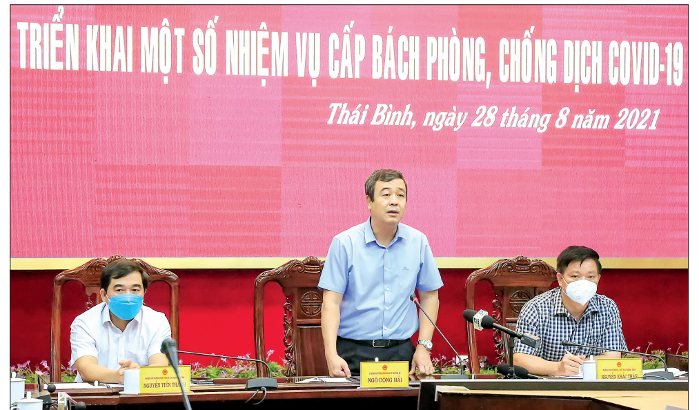
Đồng chí Ngô Đông Hải, Ủy viên Ban Chấp hành Trung ương Đảng, Bí thư Tỉnh ủy phát biểu tại cuộc họp.