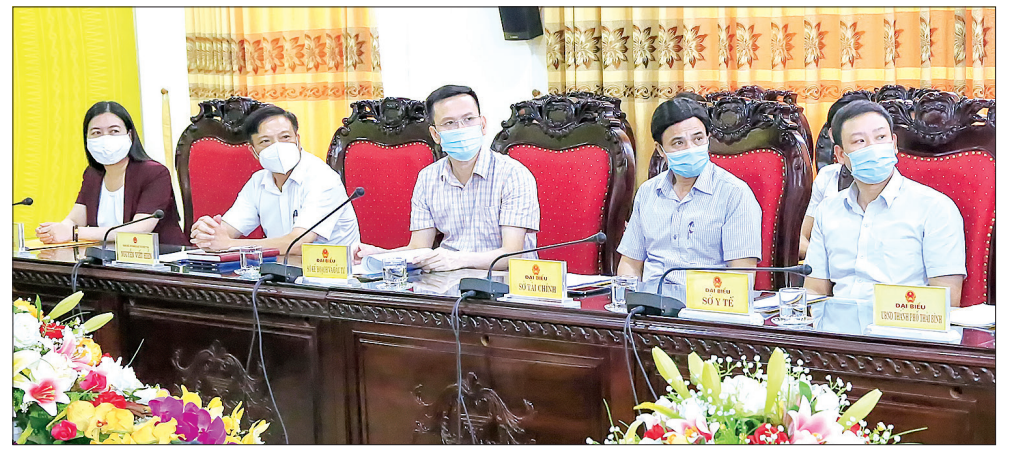
Đại biểu dự hội nghị tại điểm cầu Thái Bình.

Thủ tướng kêu gọi đội ngũ giáo viên, cán bộ quản lý và các em học sinh nêu cao tinh thần phòng, chống dịch với