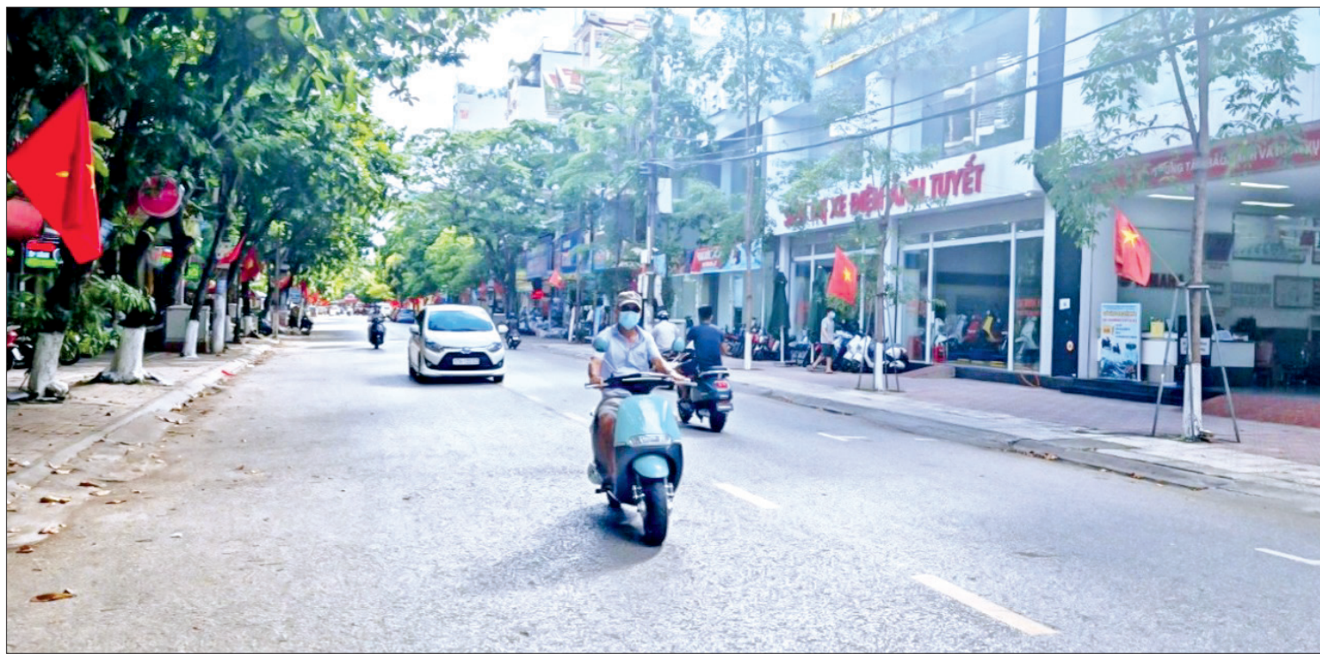
Phố Nguyễn Thị Minh Khai, phường Bồ Xuyên, thành phố Thái Bình.

Phát huy truyền thống cách mạng, những năm qua, Đảng bộ, chính quyền và nhân dân phường Bồ Xuyên (thành phố Thái Bình) đã đoàn kết, nỗ lực phấn đấu vượt qua khó khăn xây dựng phường ngày càng giàu đẹp, văn minh, hiện đại.