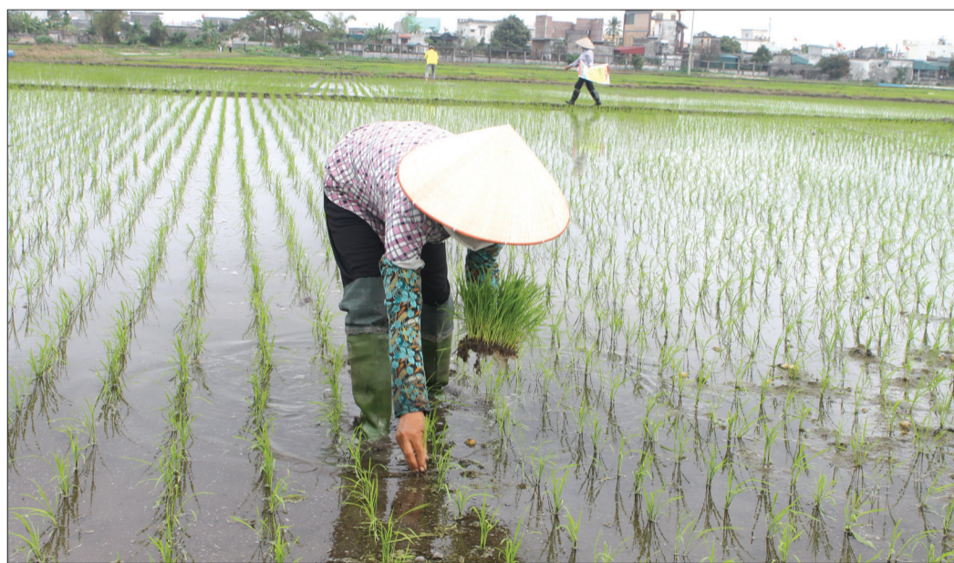
Nông dân chỉ tiến hành tĩa dặm, bón phân cho lúa khi thời tiết ấm lên, nhiệt độ ngoài trời khoảng 20°C.

Nông dân huyện Vũ Thư vừa hoàn thành gieo cấy gần 7.500ha lúa xuân. Tuy nhiên, trên đồng ruộng hiện đã phát sinh một số loại sâu bệnh gây hại, kết hợp với nền nhiệt giảm sâu ảnh hưởng đến sinh trưởng, phát triển của cây lúa. Để bảo vệ an toàn lúa xuân mới gieo cấy, huyện Vũ Thư chỉ đạo nông dân khẩn trương triển khai các biện pháp giữ ấm và phòng, trừ sâu bệnh cho cây lúa.