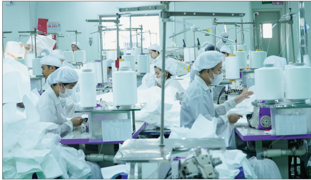
Sản xuất đồ bảo hộ y tế tại Công ty TNHH Tập đoàn Envinronstar tại khu công nghiệp Cầu Ngbin (Quỳnh Phụ).

Quy hoạch tỉnh Thái Bình thời kỳ 2021 - 2030, tầm nhìn đến năm 2050 đã được Thủ tướng Chính phủ phê duyệt. Nhìn vào phương hướng và phương án phát triển ngành công nghiệp, nhiều chuyên gia nhận định Thái Bình sẽ sớm trở thành một trong những trung tâm phát triển công nghiệp của vùng đồng bằng sông Hồng.