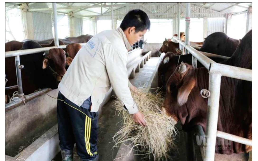
Các hộ nông dân nuôi nhốt gia súc bảo đảm an toàn trước thời tiết rét đậm, rét hại.