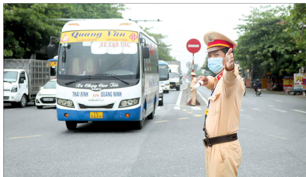
Lực lượng cảnh sát giao thông điều tiết giao thông tại khu vực ngã tư Gia Lễ, quốc lộ 10.