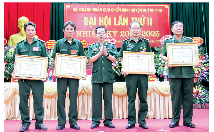
Đại diện Hiệp hội Doanh nhân cựu chiến binh Việt Nam trao bằng khen cho các cá nhân tiêu biểu.