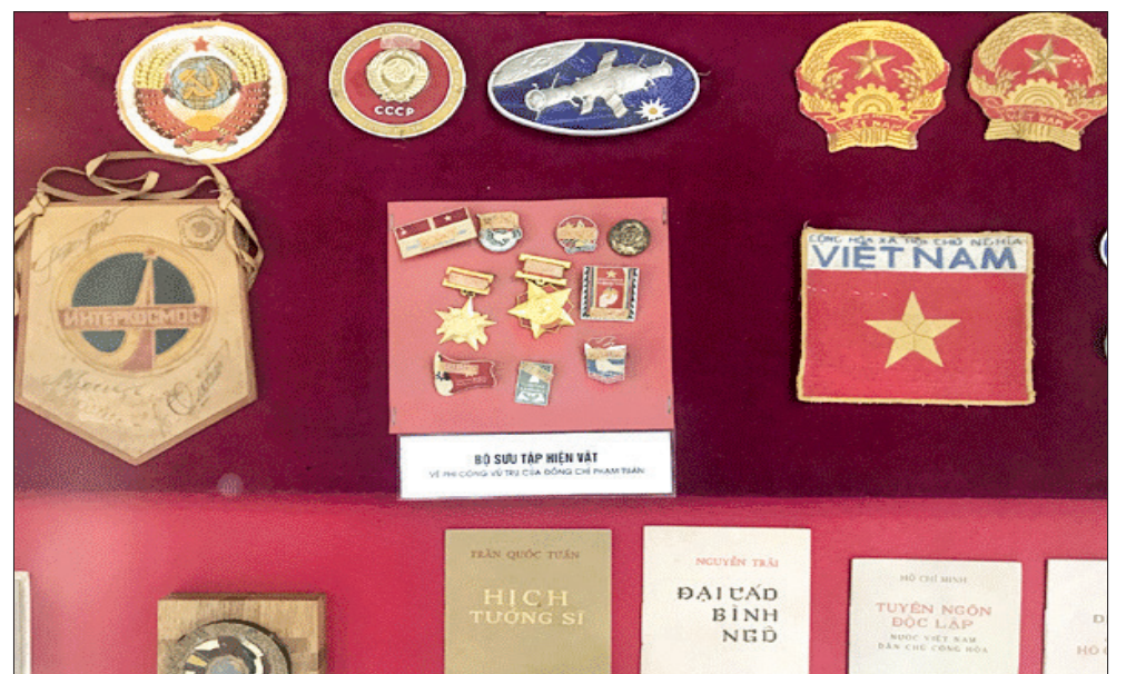
Một số hiện vật được phi công Phạm Tuân mang vào vũ trụ.