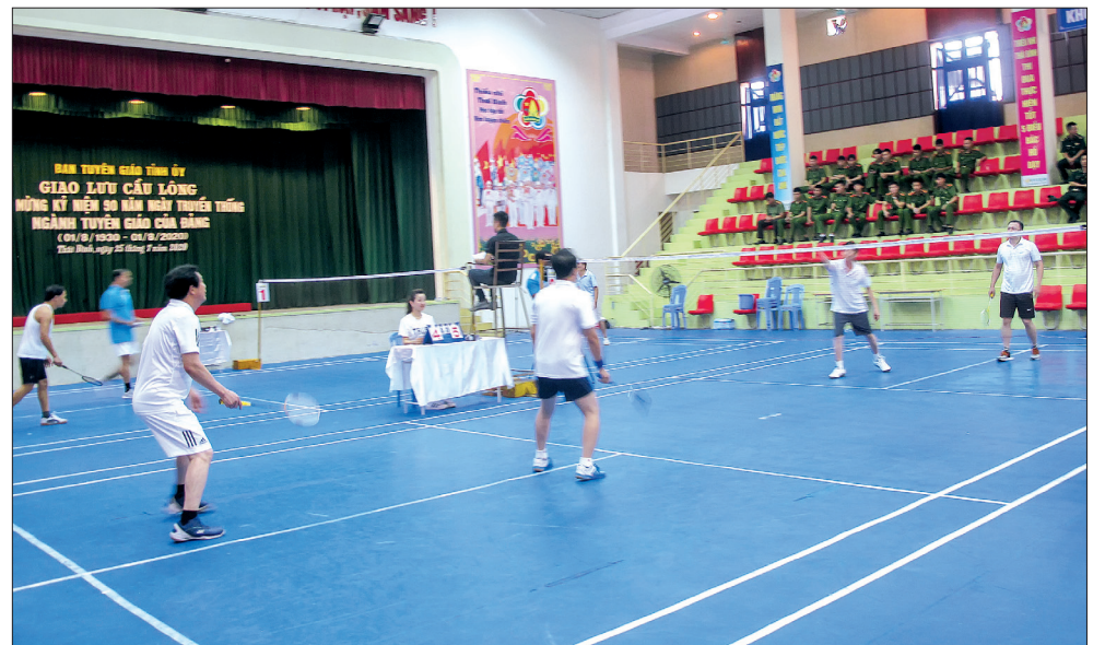
Các vận động viên đã cống hiến cho khán giả những trận đấu hay, nhiều đường cầu đẹp.