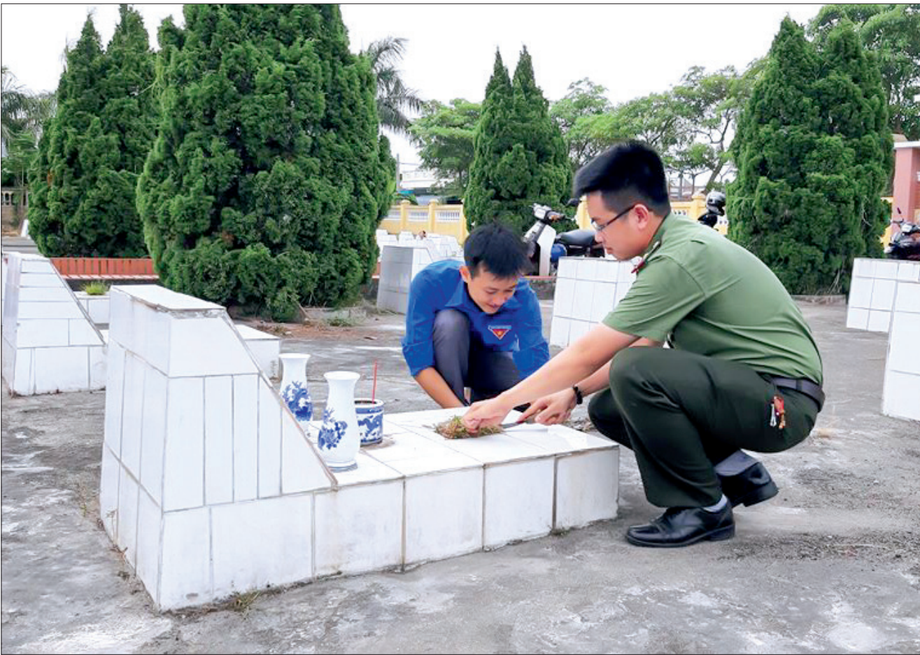
Thế hệ trẻ huyện Quỳnh Phụ chăm sóc phần mộ các anh hùng liệt sĩ.