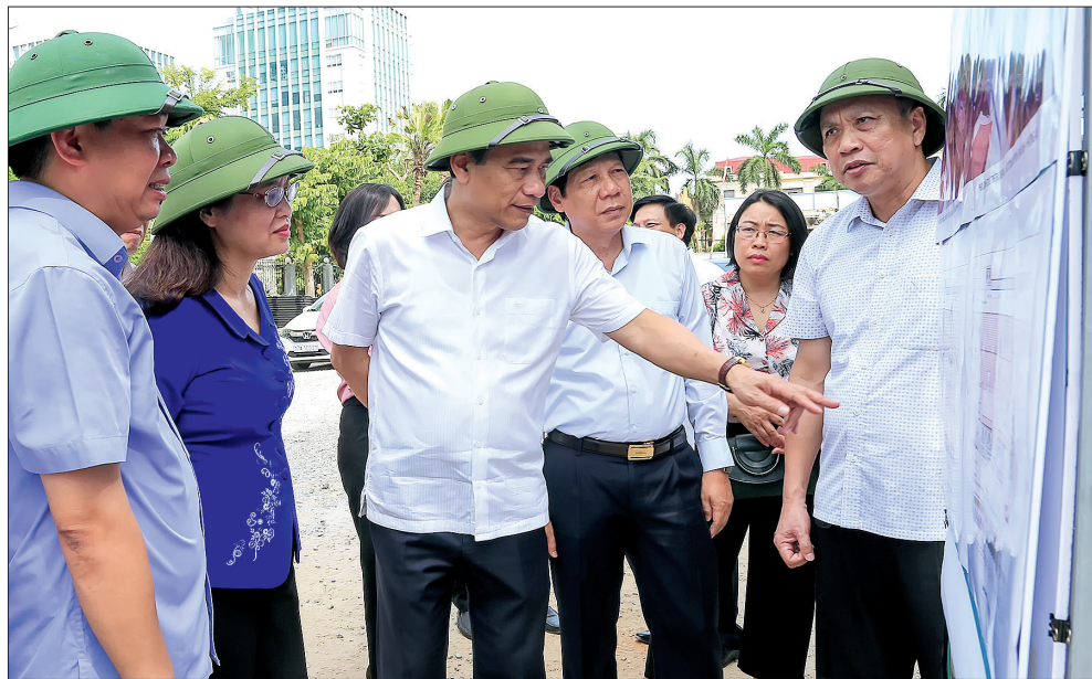
Đồng chí Đặng Trọng Thăng, Phó Bí thư Tỉnh ủy, Chủ tịch UBND tỉnh kiểm tra tiến độ công trình Thư viện Khoa học tổng hợp tỉnh.