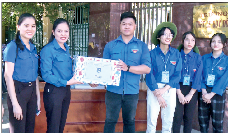
Tỉnh đoàn Thái Bình trao quà cho đoàn viên, thanh niên tham gia tiếp sức mùa thi tại điểm Trường THPT Lê Quý Đôn, thành phố Thái Bình.

Chương trình tiếp sức mùa thi đợt 1 năm nay diễn ra trong 2 ngày 25 - 26/7 với sự tham gia của trên 300 đoàn viên, thanh niên tại 28 điểm thi trong toàn tỉnh. Các đoàn viên, thanh niên sẽ thực hiện tư vấn, hỗ trợ, giúp đỡ phụ huynh và các em học sinh tham gia kỳ thi vào lớp 10 THPT tại các điểm thi và tham gia bảo đảm trật tự an toàn giao thông xung quanh khu vực tổ chức thi.