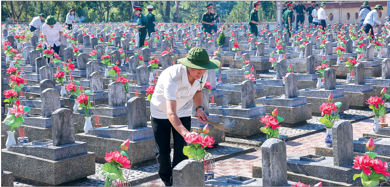
Thắp hương tại phần mộ các anh hùng liệt sĩ quê hương Thái Bình tại Nghĩa trang Liệt sĩ quốc gia Trường Sơn.