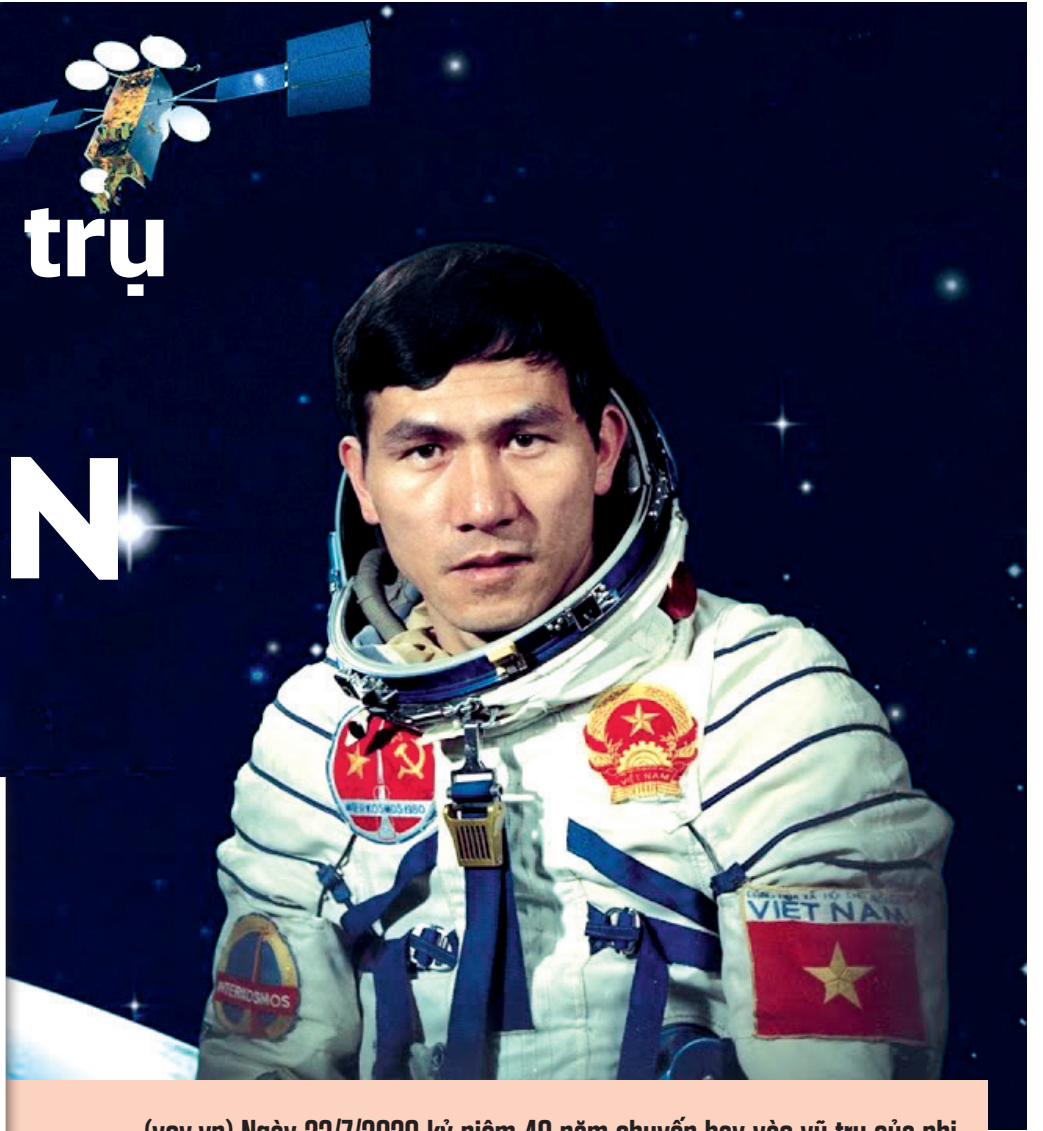
Ngày 23/7/2020 kỷ niệm 40 năm chuyến bay vào vũ trụ của phi công Phạm Tuân và nhà du hành vũ trụ Liên Xô Viktor Vassilyevich Gorbatko.