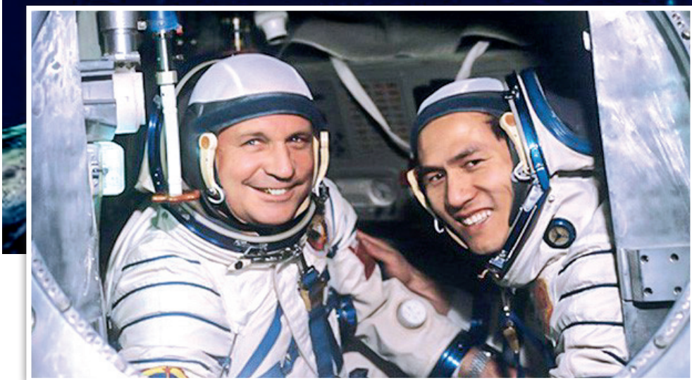
Hai phi hành gia Gorbatko và Phạm Tuân ngày 23/7/1980, tại sân bay vũ trụ Baikonur ở Kazakhstan trước khi bay vào vũ trụ bằng phi thuyền Soyuz 37.