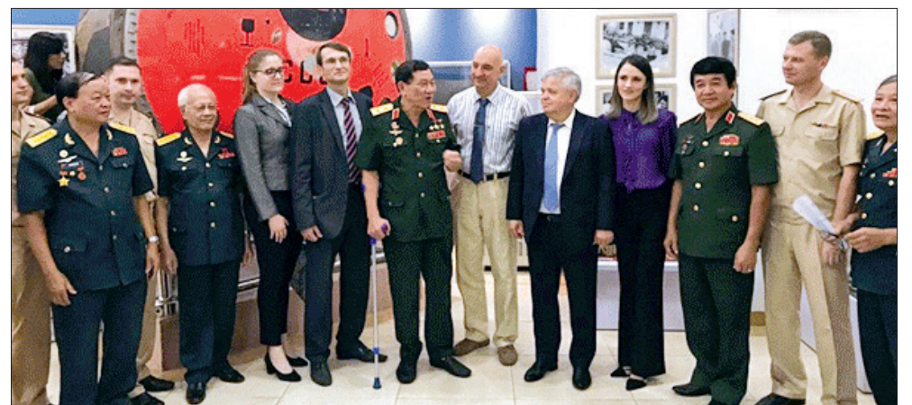
Anh hùng phi công Phạm Tuân (người mặc quân phục đứng giữa) cùng các bạn Nga và Việt Nam tại cuộc gặp gỡ nhân kỷ niệm 40 năm chuyến bay vào vũ trụ.