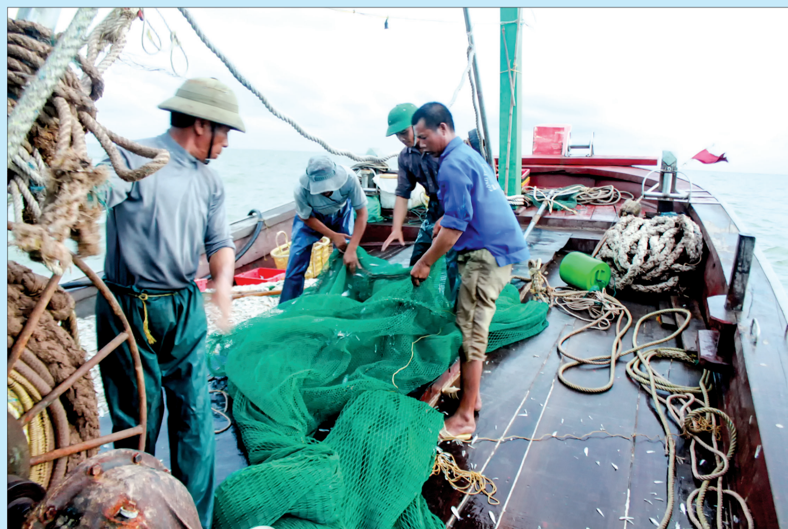
Ngư dân Thái Bình vươn khơi bám biển.