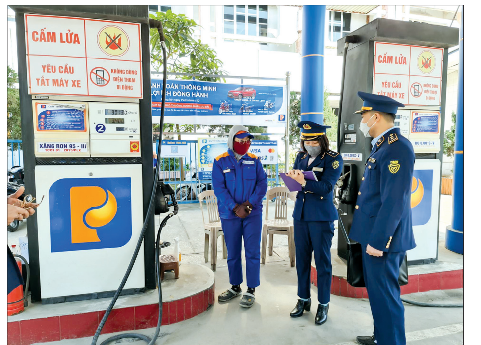
Từ đầu năm đến nay, lực lượng quản lý thị trường tỉnh tăng cường giám sát, kiểm tra hoạt động kinh doanh xăng dầu trên địa bàn tỉnh.