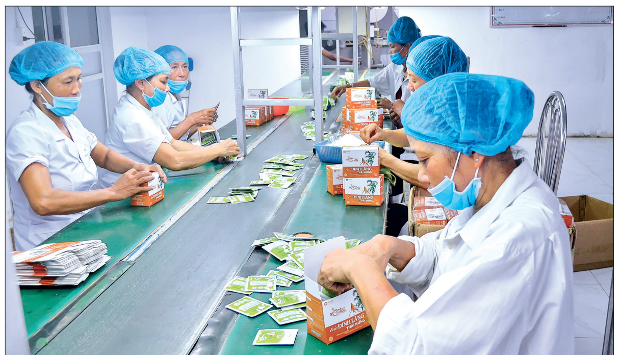
Dây chuyền đóng gói sản phẩm của Công ty.

canh, trà giáo cổ lam, trà dây, trà gừng, trà sâm ngọc linh... và trong mỗi sản phẩm trà của Thái Hưng đều mang hương vị đặc trưng của dược liệu, không sử dụng chất tạo màu, hương vị nên rất an toàn cho người sử dụng... Năm 2018, Thái Hưng sản xuất trên 4 triệu sản phẩm trà thảo dược các loại. Dự kiến trong năm 2019 đạt 6 triệu sản phẩm; tạo việc làm ổn định cho gần 100 lao động, chủ yếu là người dân đã quá tuổi vào các công ty, nhà máy với thu nhập ổn định từ 4 - 6 triệu đồng/người/tháng. Hiện Công ty đã có đại lý phân phối tại hầu hết 63 tỉnh, thành phố trong cả nước và đã xuất khẩu sang thị trường một số nước Đông Nam Á, châu Âu, Cộng hòa Séc, Nhật Bản. Được người tiêu dùng, khách hàng trong và ngoài nước biết đến là một sản phẩm chất lượng tốt dành cho sức khỏe và giá cả cạnh tranh trên thị trường, Thái Hưng tiếp tục mở rộng sản xuất với chiến lược phát triển