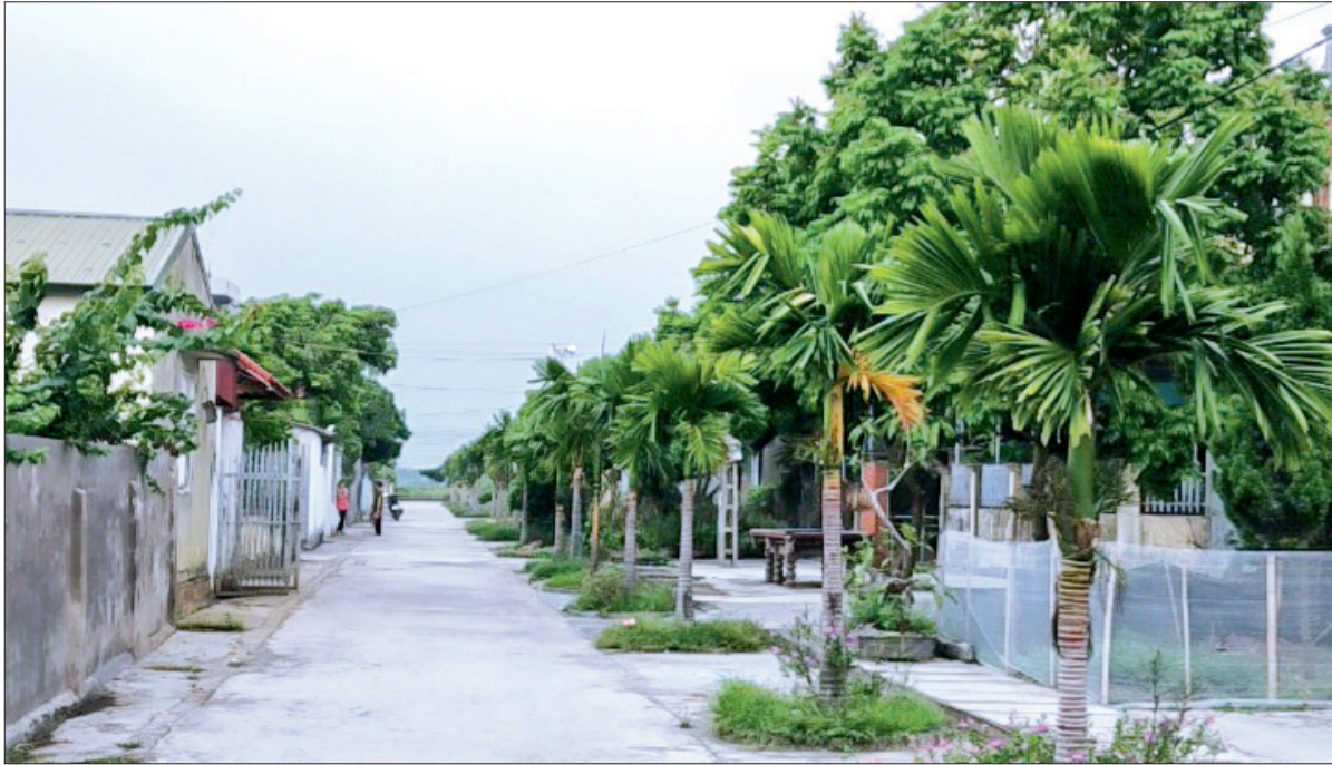
Diện mạo nông thôn mới ở Hưng Hà.

Anh dũng trong hai cuộc kháng chiến trường kỳ của dân tộc, các địa phương của huyện Hưng Hà hôm nay còn kiên cường vượt khó, xây dựng quê hương, góp phần không chỉ đưa Hưng Hà trở thành huyện đầu tiên của tỉnh đạt chuẩn nông thôn mới (NTM) năm 2015 mà còn đang tiếp tục phấn đấu nâng cao các tiêu chí, xây dựng NTM nâng cao, NTM kiểu mẫu.