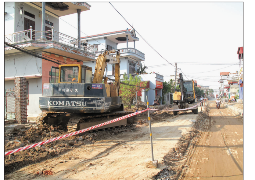
Công tác quản lý nhà nước về đất đai được tăng cường đã tạo thuận lợi cho huyện Thái Thụy triển khai các dự án giao thông.

Để kịp thời ngăn chặn và chấm dứt tình trạng vi phạm về lĩnh vực đất đai trên địa bàn, thời gian gần đây, Thái Thụy đã tăng cường lãnh đạo, chỉ đạo các cấp, ngành chấn chỉnh công tác quản lý nhà nước về lĩnh vực này. 6 tháng đầu năm 2019, UBND huyện đã tăng cường lãnh đạo, chỉ đạo các cấp, ngành chấn chỉnh công tác quản lý nhà nước về lĩnh vực này. 6 tháng đầu năm 2019, UBND huyện và các xã đã tổ chức 54 cuộc tuyên truyền, ban hành 35 báo cáo, 163 văn bản, chỉ đạo, điều chỉnh, hướng dẫn giải quyết công việc thuộc lĩnh vực quản lý đất đai trên địa bàn huyện. Đồng thời, tiến hành thanh tra, kiểm tra chấn chỉnh việc chấp hành pháp luật về đất đai theo quy định. Qua đó, phát hiện, xử lý 12 vụ vi phạm trong lĩnh vực đất đai và đã xử lý dứt điểm 5 vụ, đang xử lý 7 vụ. Ngoài ra, huyện tiếp tục thực hiện tốt công tác tiếp xúc dân, giải quyết đơn thư khiếu nại, tố cáo của công dân về đất đai. Trong đó, tiếp