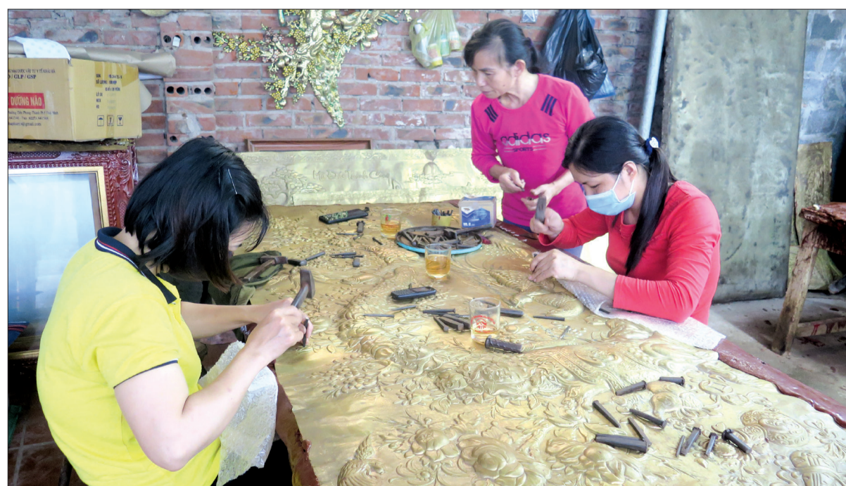
Với đôi bàn tay khéo léo, người thợ làng nghề chạm bạc tạo ra những sản phẩm tinh xảo, độc đáo.

Hình ảnh những người làm nghề chạm bạc thể hiện bản tính của người dân Việt Nam quanh năm cần cù, chịu khó. Nhờ đôi bàn tay khéo léo và sự cần mẫn, họ không bao giờ hết việc làm, làng nghề chưa bao giờ ngừng tiếng búa, cứ đời này nối tiếp đời kia làm nghề. Từ xa xưa người làm chạm bạc đã sản xuất ra những mặt hàng cao cấp, tạo tiếng vang lớn ở thị trường nước ngoài về làm hàng thủ công mỹ nghệ. Qua bao thăng trầm của lịch sử, làng nghề đã chuyển từ hàng xuất khẩu sang phục vụ thị trường trong nước với