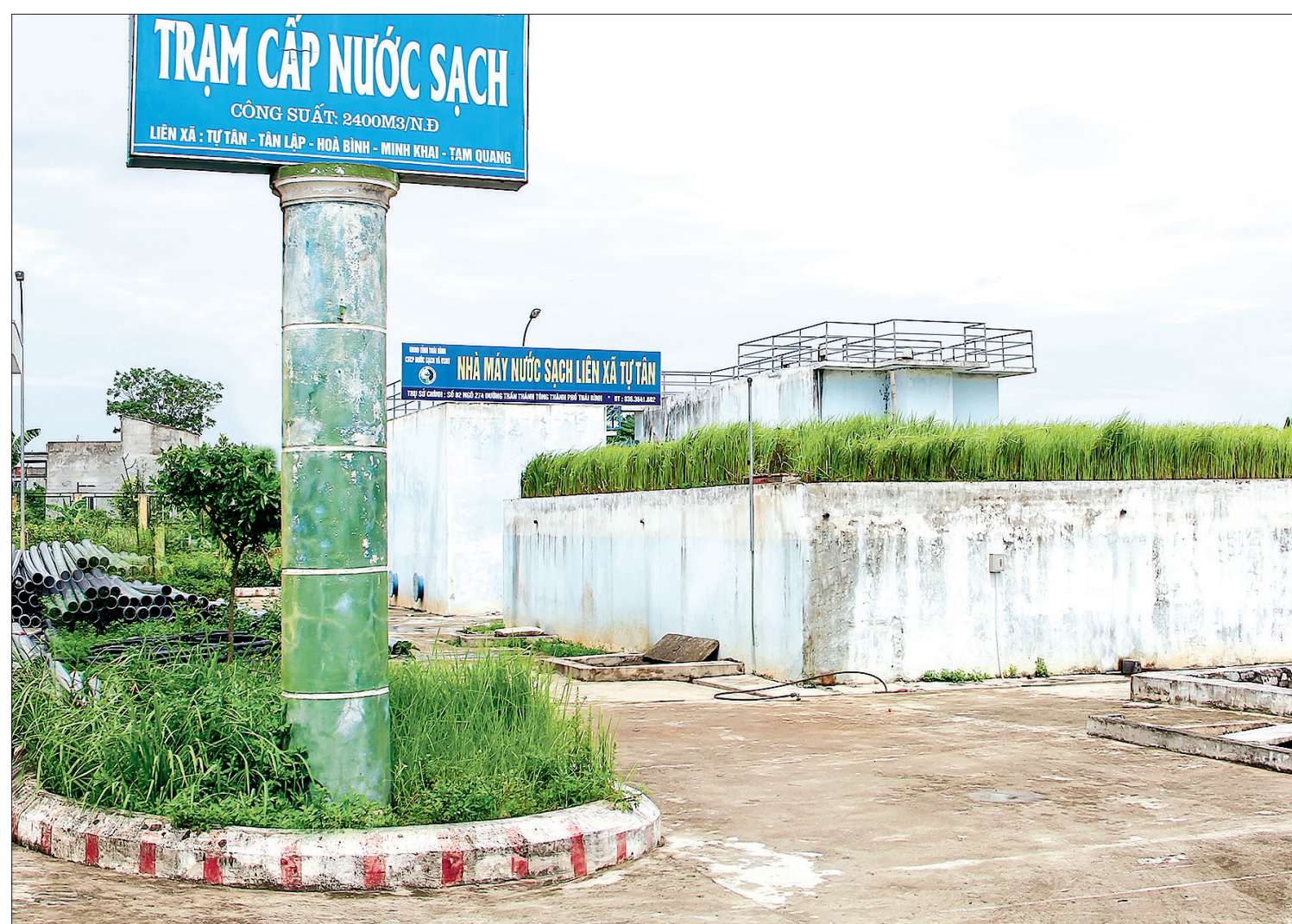
Trạm cấp nước sạch liên xã Tự Tân, Tân Lập, Hòa Bình, Minh Khai, Tam Quang có công suất 2.400m 3 /ngày đêm.

Từ khi nhà máy nước của Công ty Cổ phần Bitexco Nam Long khánh thành và đưa vào sử dụng, dân làng tôi phấn khởi lắm. Đây là nhà máy cấp nước sạch có công suất 2.400m 3 /ngày đêm, hoạt động tốt, cung cấp đủ nước sạch cho nhân dân 5 xã: Tự Tân, Tân Lập, Hòa Bình, Minh Khai, Tam Quang của huyện Vũ Thu. Ai cũng phấn khởi và biết ơn Đảng, Nhà nước đã thực sự quan tâm đến đời sống nhân dân. Mọi người bảo nhau: Có chương trình xây dựng nông thôn mới nên chúng ta mới có nước máy để dùng đấy. Mọi người nhắc nhau phải tuân thủ đầy đủ các quy ước do đơn vị cấp nước đề ra, cùng nhau bảo vệ công trình để nông thôn mới thực sự được như thành thị. Từ ấy đến nay đã nhiều năm, nhà máy nước phục vụ dân rất tận tình, chu đáo.