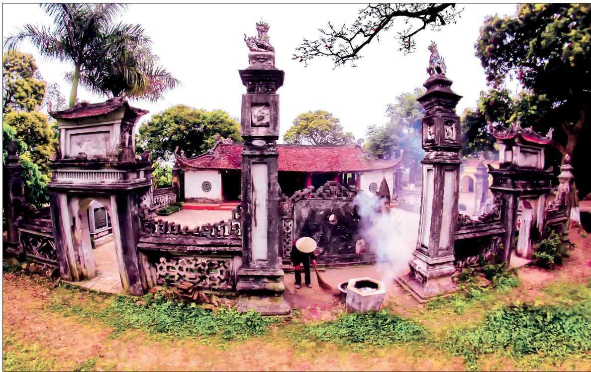
Miếu Hai Thôn, di tích lịch sử văn hóa cấp quốc gia thờ Lý Nam Đế và Đỗ Hoàng hậu đang xuống cấp nghiêm trọng.

Lịch sử nước ta ghi nhận Lý Bí (503 - 548) quê ở hương Thái Bình, phủ Long Hưng là người đầu tiên xưng Đế (Lý Nam Đế) lập nên triều tiên Lý, lập nên nhà nước Vạn Xuân và đặt niên hiệu Thiên Đức. Lý Bí còn có tên gọi khác là Lý Bôn. Giới sử gia khẳng định trong thời Bắc thuộc và chống Bắc thuộc kéo dài hơn một nghìn năm, cuộc khởi nghĩa Lý Bí nói riêng, triều tiên Lý nói chung đã tạo khí thế chống giặc ngoại xâm bởi cuộc khởi nghĩa Lý Bí đã giành thắng lợi vang dội, giữ vững chủ quyền độc lập, tự chủ lâu dài nhất.