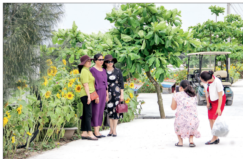
Du khách ghi lại những kỷ niệm bên vườn hoa.