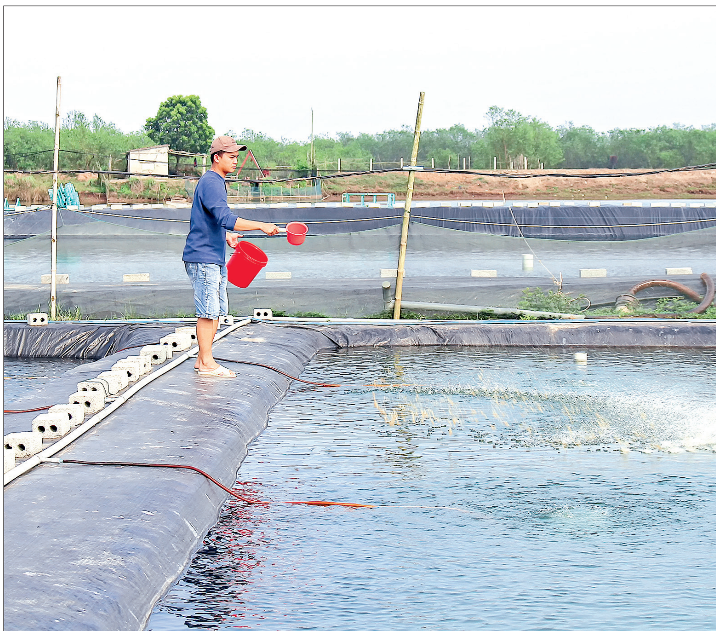
Cơ sở ương dưỡng tôm giống trên địa bàn xã Thái Thượng (Thái Thụy).

Livestream trào lưu bán hàng THỜI CÔNG NGHỆ SỐ