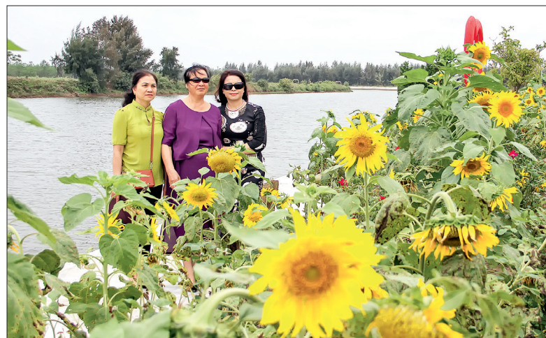
Vườn hoa hướng dương tại cồn Đen rộng hơn 12.000m 2 được trồng cách đây hơn 3 tháng và đang bước vào thời điểm nở đẹp nhất.