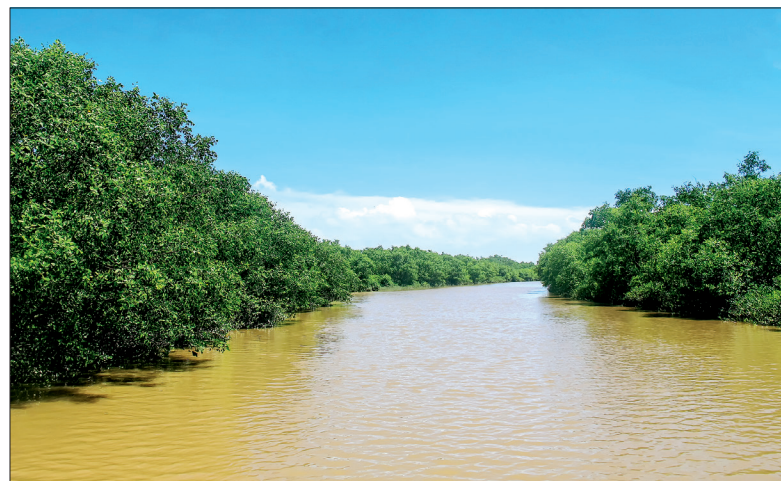
Hệ thống rừng ngập mặn với hệ động thực vật phong phú, đa dạng ở cồn Đen.