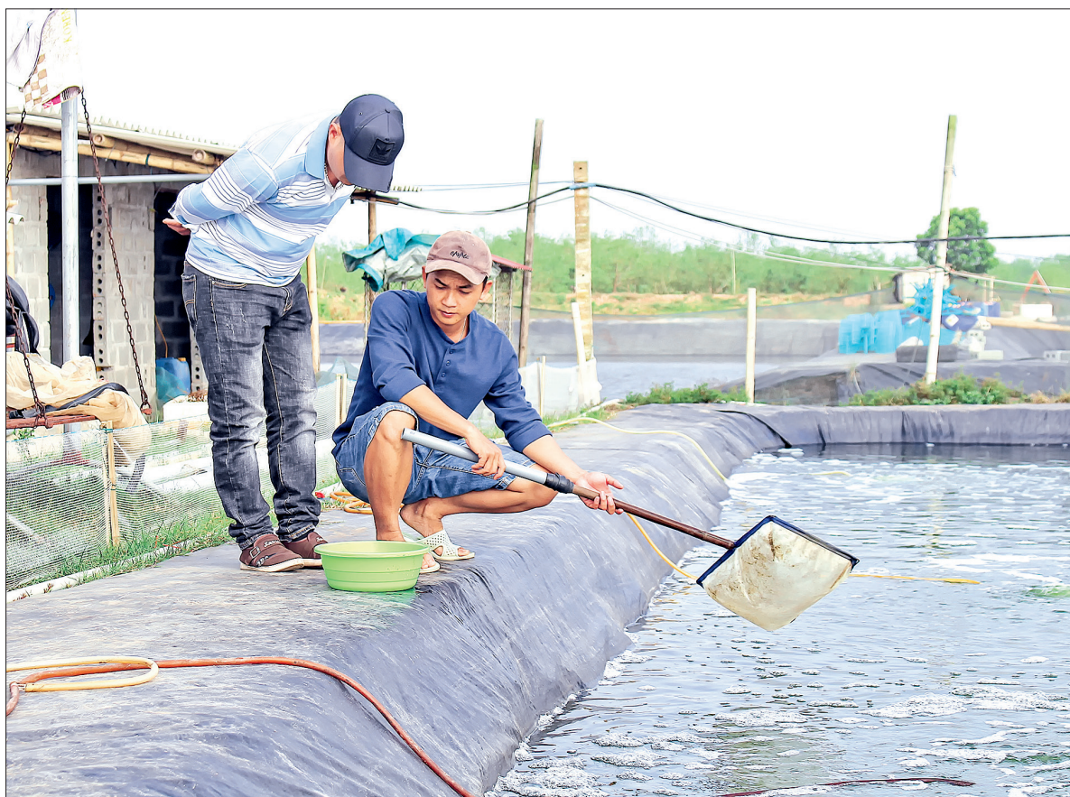
Người nuôi mong muốn mua được tôm giống bảo đảm chất lượng.