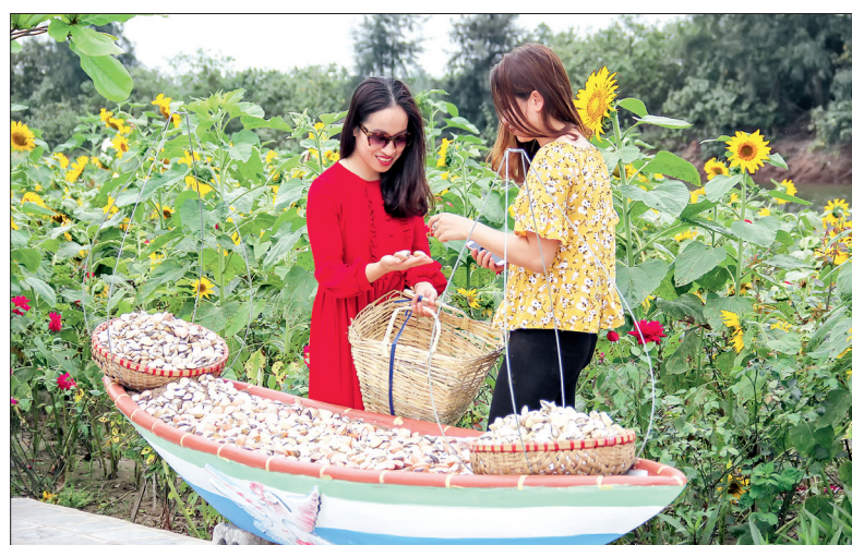
Vườn hoa hướng dương kết hợp cùng những thiết kế cảnh quan đẹp xung quanh đem đến cho du khách những phút thư giãn, bình yên và thoải mái nhất.

viên khu du lịch sinh thái cồn Đen cho biết: Mục đích của việc trồng hoa hướng dương tại khu du lịch nhằm tạo một điểm nhấn, một luồng sinh khí mới để thu hút du khách. Đây là một loài hoa biểu tượng cho tình yêu thủy chung, tình bạn chân thành và sức sống mãnh liệt với màu vàng rực rỡ đầy ấm áp như ánh nắng mặt trời. Đến với cồn Đen du khách sẽ vừa được tắm biển, khám phá hệ sinh thái rừng ngập mặn..., lại vừa được thưởng lãm không gian tự nhiên tươi mới khi ngắm nhìn những bông hoa hướng dương. Ngoài vườn hoa hướng dương, khu du lịch còn trồng rất nhiều loài hoa khác như hoa hồng, hoa lan... kết hợp cùng những thiết kế cảnh quan đẹp sẽ đem đến cho du khách những ngày cuối tuần nghỉ ngơi thư giãn, bình yên và thoải mái nhất.