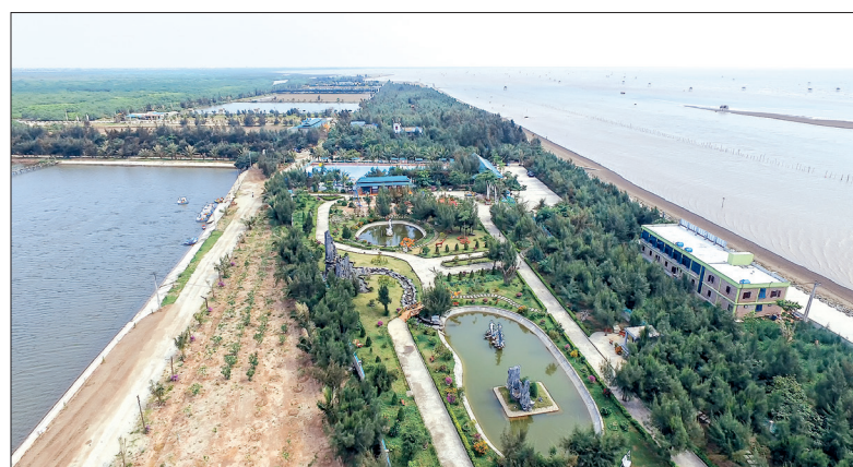
Đến với cồn Đen du khách có thể đắm mình trong thiên nhiên kỳ thú, hoang sơ, mới lạ.