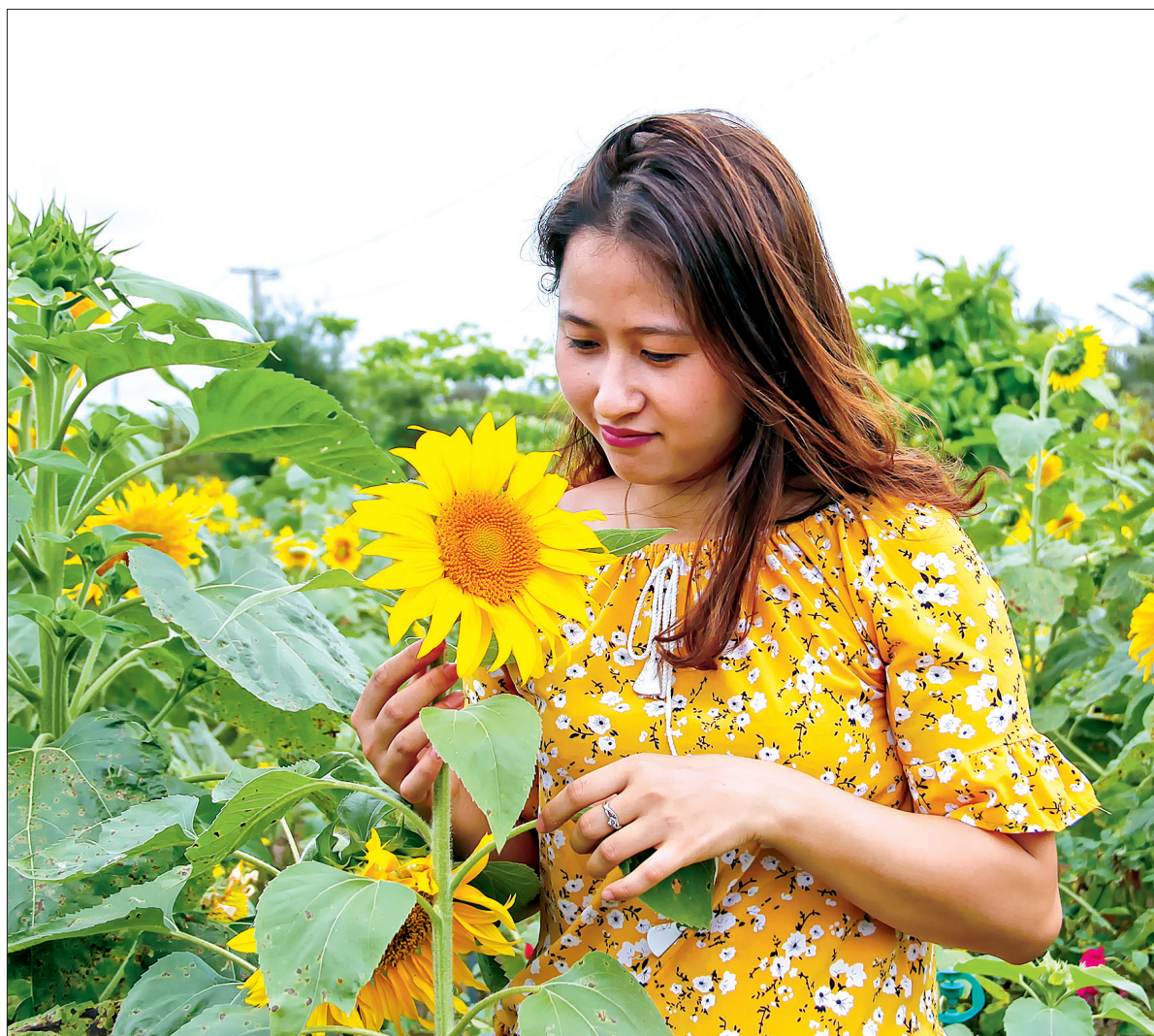
Khu du lịch sinh thái cồn Đen tạo điểm nhấn mới để thu hút du khách.