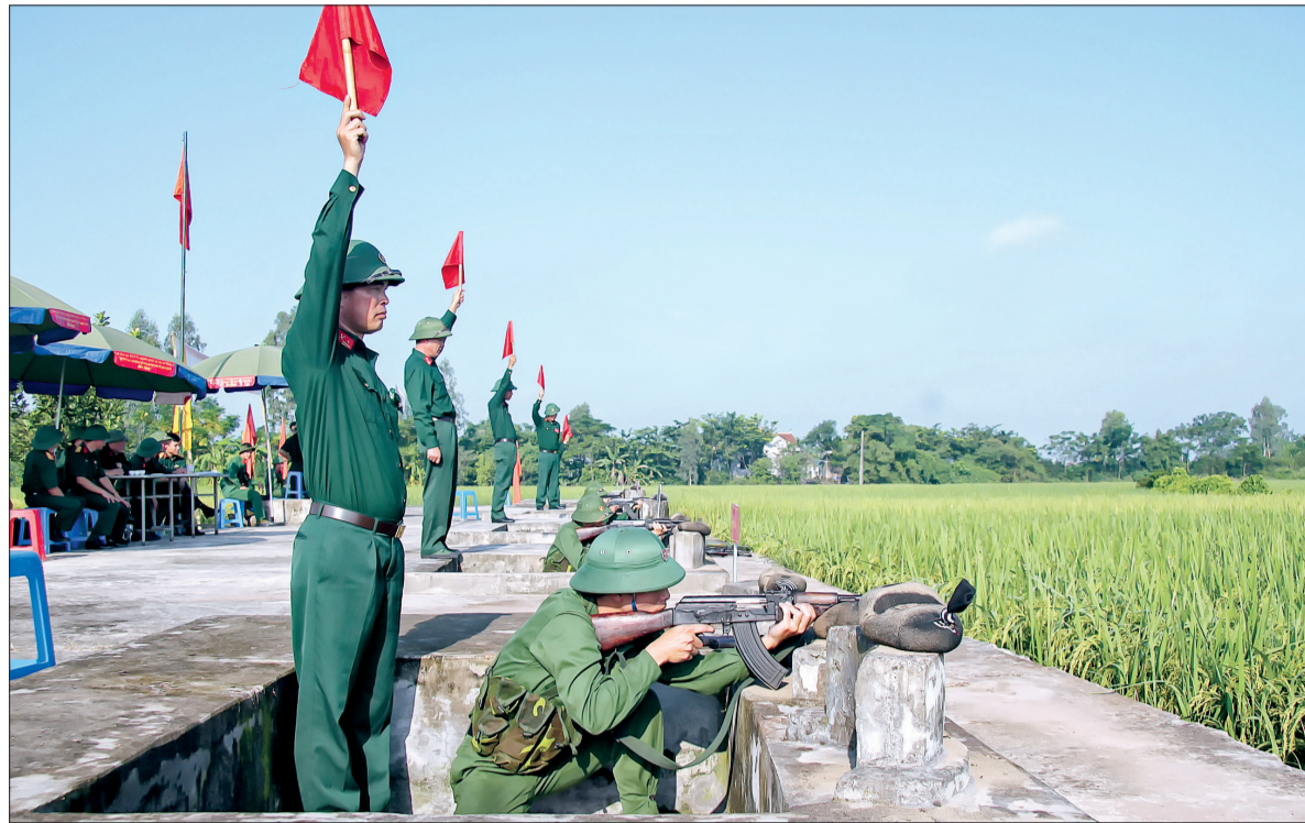
Học viên lớp sĩ quan dự bị của tỉnh tham gia huấn luyện bắn đạn thật.

địa bàn để nâng cao chất lượng chuyên nghiệp quân sự cho đơn vị, nhất là các đơn vị binh chủng và chuyên môn kỹ thuật; việc thực hiện chế độ chính sách, ngày công tập trung huấn luyện, kiểm tra cũng như chi trả trợ cấp cho gia đình SQDB còn thấp so với mặt bằng lao động phổ thông... Đây là những yếu tố chính tạo rào cản trong việc huy động SQDB.