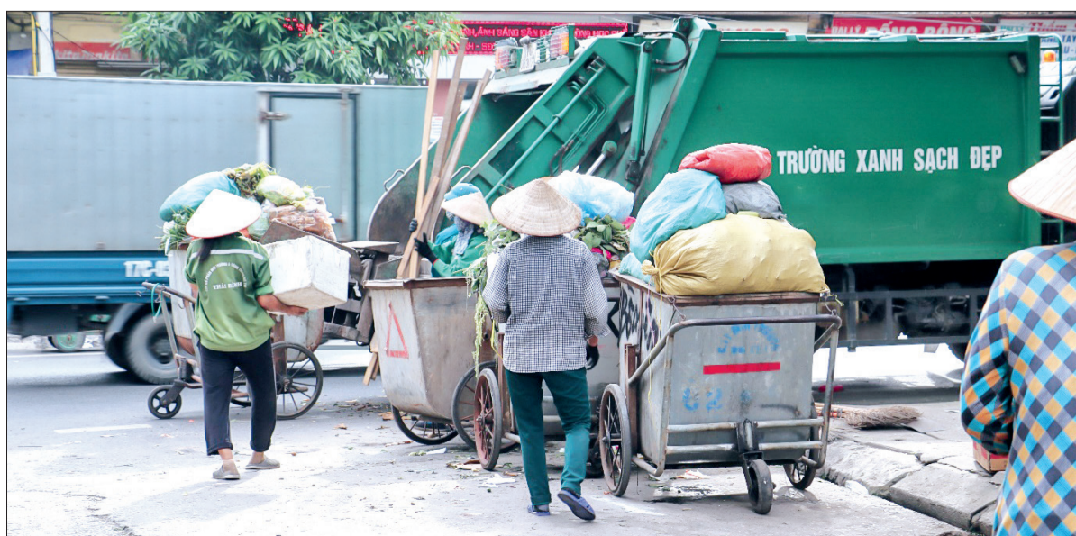
Các nhà máy xử lý rác thải rất khó khăn trong việc phân loại, xử lý rác thải nhựa.