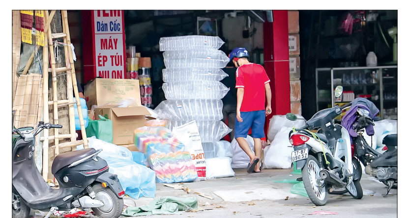
Để đẩy lùi việc sử dụng túi nilon tràn lan như hiện nay, cần đẩy mạnh tuyên truyền, vận động để nâng cao ý thức người tiêu dùng chuyển sang sử dụng các loại túi tự hủy, thân thiện với môi trường.