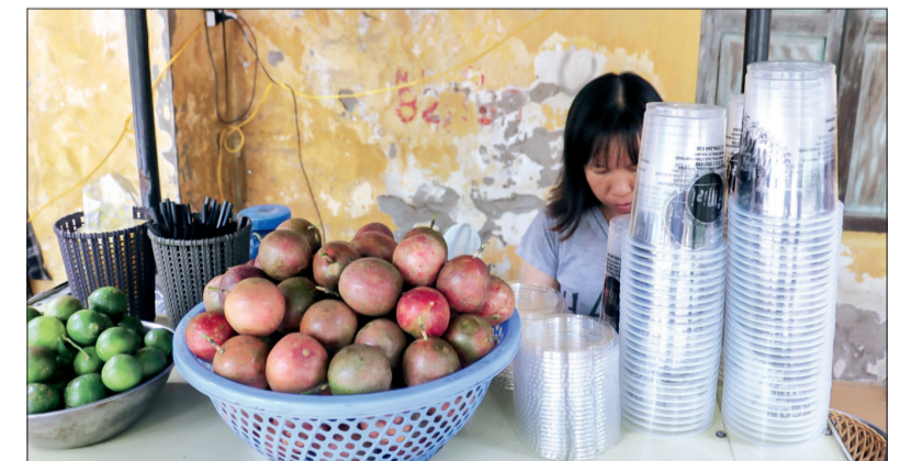
Cốc nhựa dùng 1 lần được các quán nước giải khát sử dụng thường xuyên.