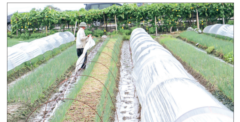
Đối với người nông dân, nhất là người trồng rau màu, mua nilon để quay bảo vệ cây màu còn khá cao.