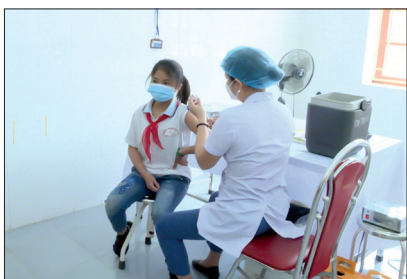
Nhân viên y tế tiêm vắc-xin phòng Covid-19 cho trẻ em từ 5 đến dưới 12 tuổi.

Tính đến 17 giờ ngày 20/4, Thái Bình đã thực hiện tiêm hơn 3,45 triệu mũi vắc-xin phòng Covid-19, trong đó số mũi tiêm cho người từ 18 tuổi trở lên là hơn 3,15 triệu mũi, số mũi tiêm cho người từ 12 đến dưới 18 tuổi là 301.380 mũi, số mũi tiêm cho trẻ từ 5 đến dưới 12 tuổi là 2.035 mũi. Tỷ lệ người từ 18 tuổi trở lên được tiêm mũi bổ sung hoặc nhắc lại đạt 68,16%.