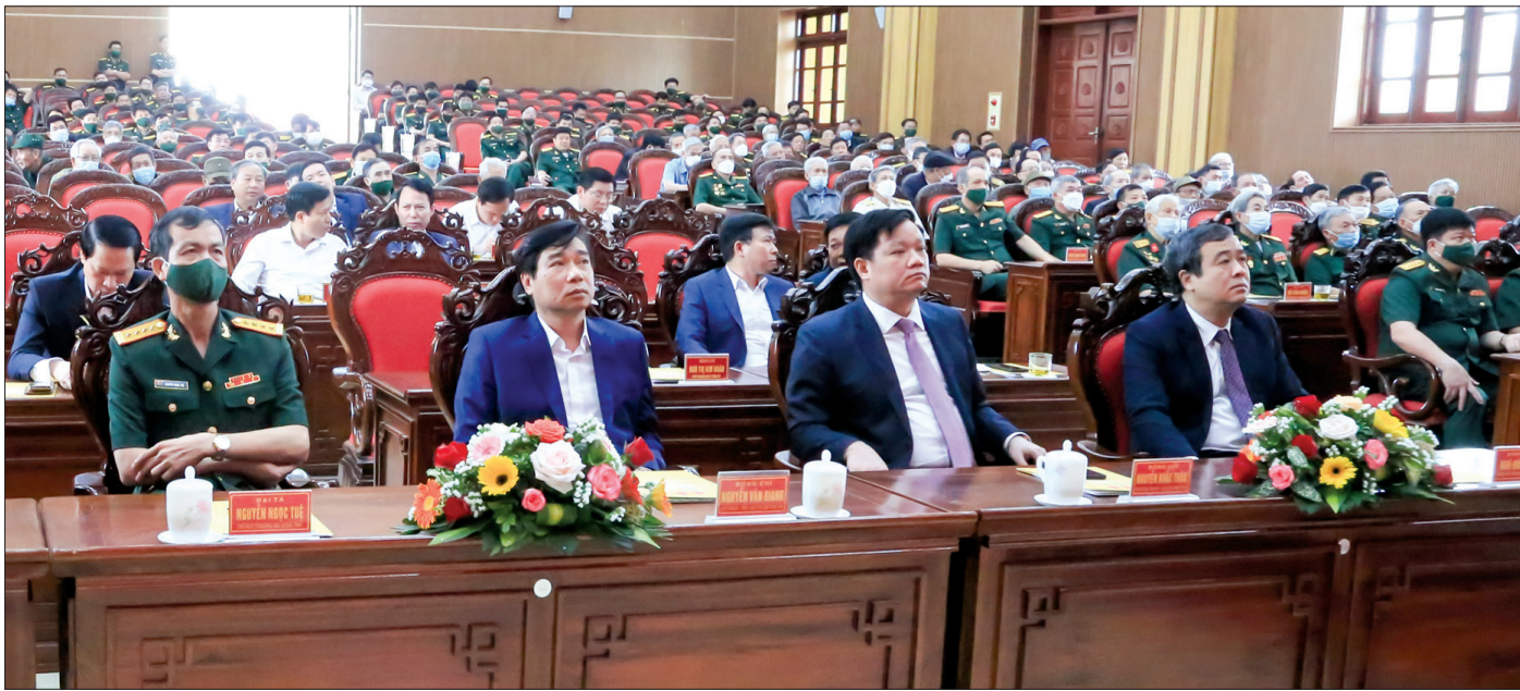
Các đồng chí lãnh đạo tỉnh và đại biểu dự buổi gặp mặt.