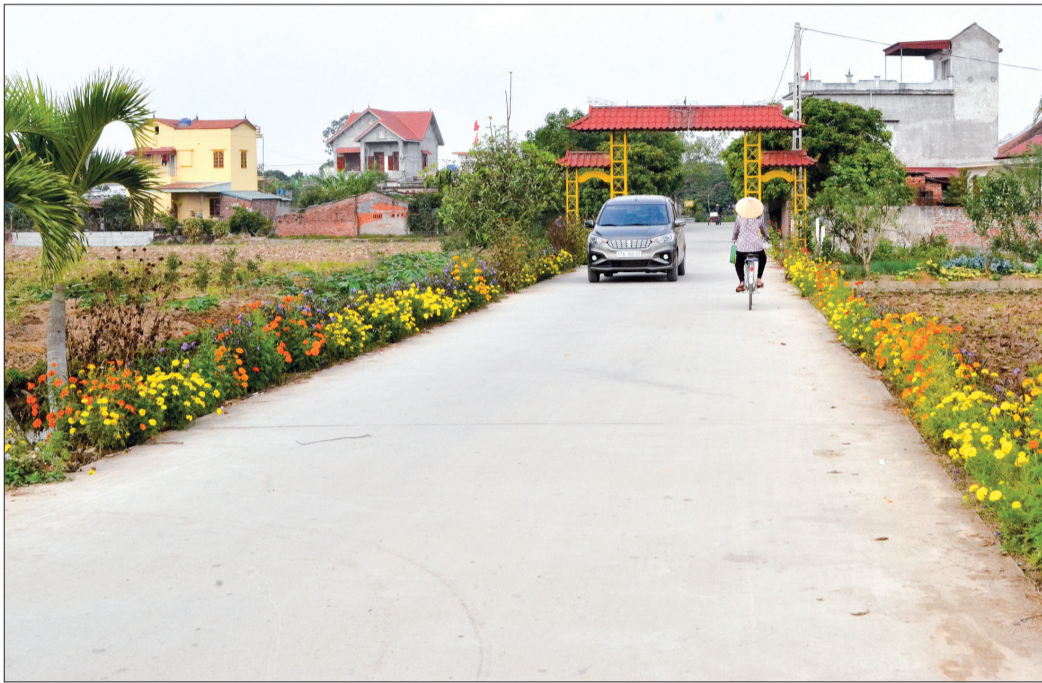
Nguồn lực xã hội hóa góp phần tích cực xây dựng cơ sở hạ tầng nông thôn mới.

Sau 10 năm xây dựng nông thôn mới (NTM), toàn tỉnh có 100% số xã, 7/7 huyện được công nhận đạt chuẩn quốc gia, thành phố Thái Bình hoàn thành nhiệm vụ xây dựng NTM; 1 xã được công nhận đạt chuẩn NTM nâng cao, 5 xã đang hoàn thiện hồ sơ công nhận xã NTM nâng cao. Một trong những "chìa khóa" mang lại thành công đó là do toàn tỉnh đã thực hiện hiệu quả chủ trương xã hội hóa nguồn lực đầu tư.