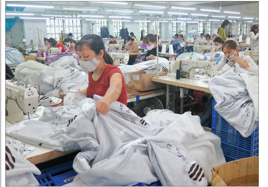
Công nhân Xí nghiệp May Đông Thắng giãn cách khi làm việc để phòng, chống dịch Covid-19.