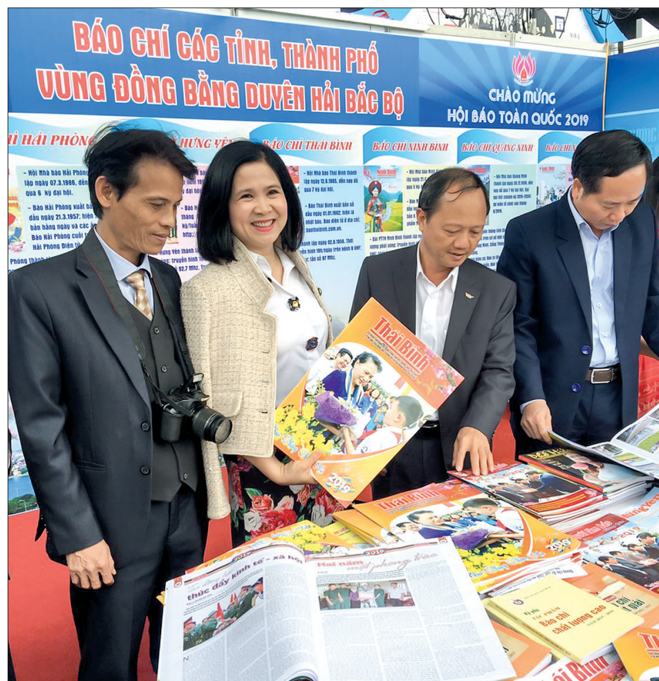
Báo Thái Bình trưng bày tại Hội báo toàn quốc 2019.