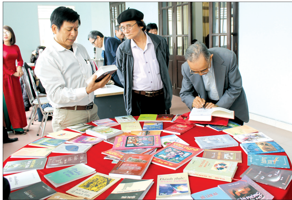
Sách thu hút bạn đọc ở nhiều lứa tuổi.

Cùng với các buổi giao lưu, tọa đàm, thông tin tuyên truyền và phát động phong trào đọc sách cũng là một trong những hoạt động hưởng ứng ngày Sách Việt Nam. Sau 5 năm thực hiện Quyết định số 284/QĐ-TTg ngày 24/2/2014 của Thủ tướng Chính phủ về ngày Sách Việt Nam, Sở Thông tin và Truyền thông, Sở Văn hóa, Thể thao và Du lịch, các thư viện, tủ sách dòng họ... đã tổ chức nhiều hình thức tuyên truyền về việc sách báo cũng như tầm quan trọng của việc đọc sách. Ngoài việc treo băng rôn, khẩu hiệu tại các cơ quan, đơn vị, Thư viện Khoa học tổng hợp tỉnh, trung tâm văn hóa,