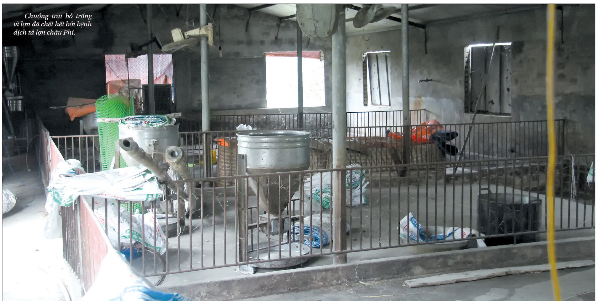
Chuồng trại bỏ trống vì lợn đã chết hết bởi bệnh dịch tả lợn châu Phi.

Trong giai đoạn hiện nay, việc khống chế, kiểm soát tốt bệnh dịch tả lợn châu Phi sẽ giúp người chăn nuôi giữ lại được con giống để tái sản xuất sau khi hết dịch. Tuy nhiên, huyện Đông Hưng cũng cần làm tốt công tác khoanh vùng, chủ động nguồn lợn giống ngay sau khi hết dịch, không để bị động, khan hiếm lợn giống, ảnh hưởng đến việc tái đàn của các hộ chăn nuôi trên địa bàn.