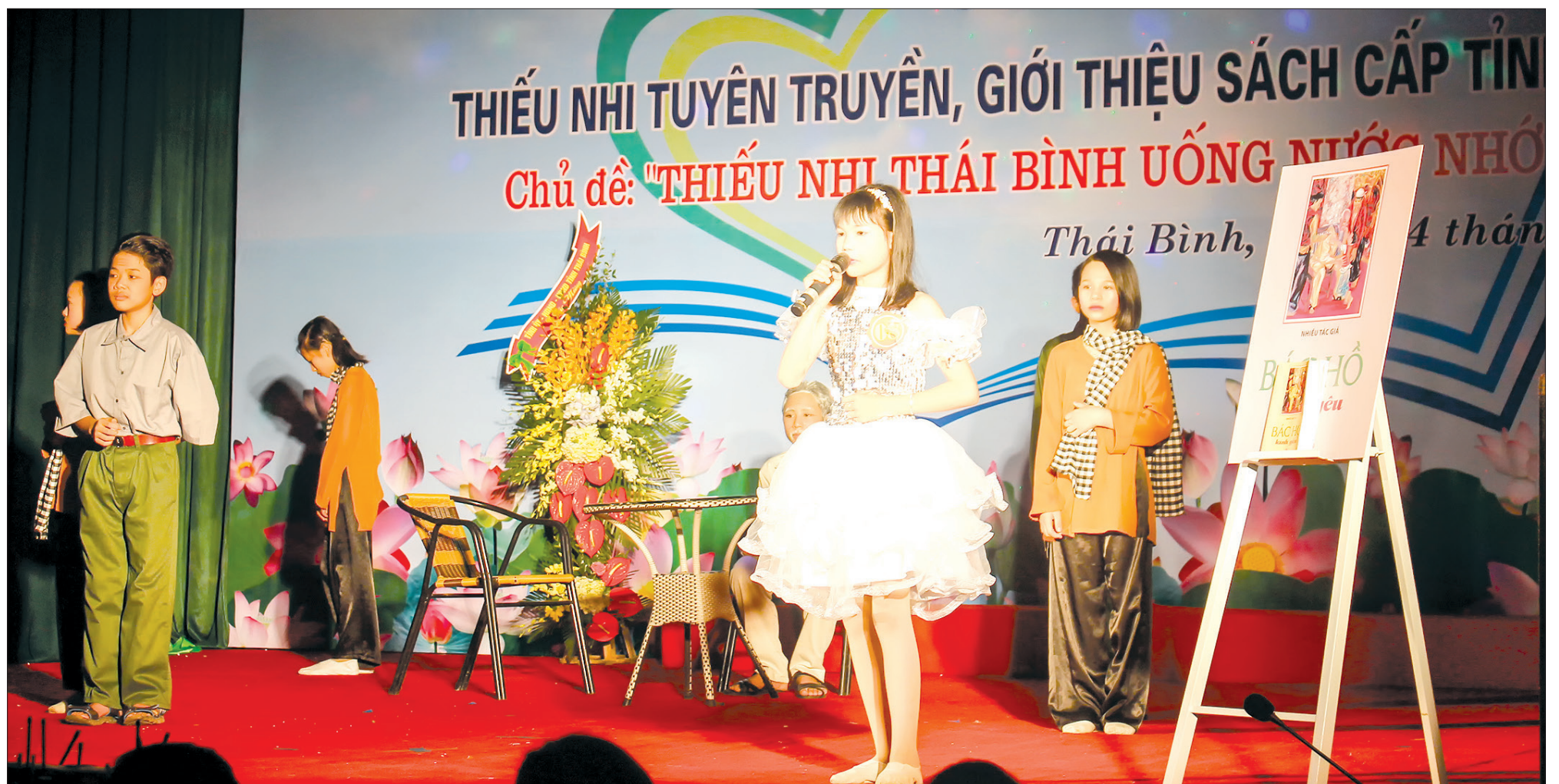
Một tiết mục trong hội thi thiếu nhi tuyên truyền, giới thiệu sách.

Diễn ra thường niên song các hoạt động hưởng ứng ngày Sách Việt Nam lại có ý nghĩa rất lớn trong việc khơi nguồn đam mê đọc sách tới cộng đồng. Nhờ đó, số lượng bạn đọc tìm tới sách ngày càng đông và số thư viện tư nhân, tủ sách dòng họ, thôn làng mở ra ngày càng nhiều, đáp ứng kịp thời nhu cầu đọc sách của người dân.