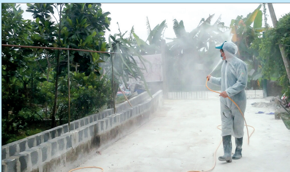
Người chăn nuôi ở Hợp Tiến (Đông Hưng) phun hóa chất trong khu trang trại để bảo vệ đàn lợn.