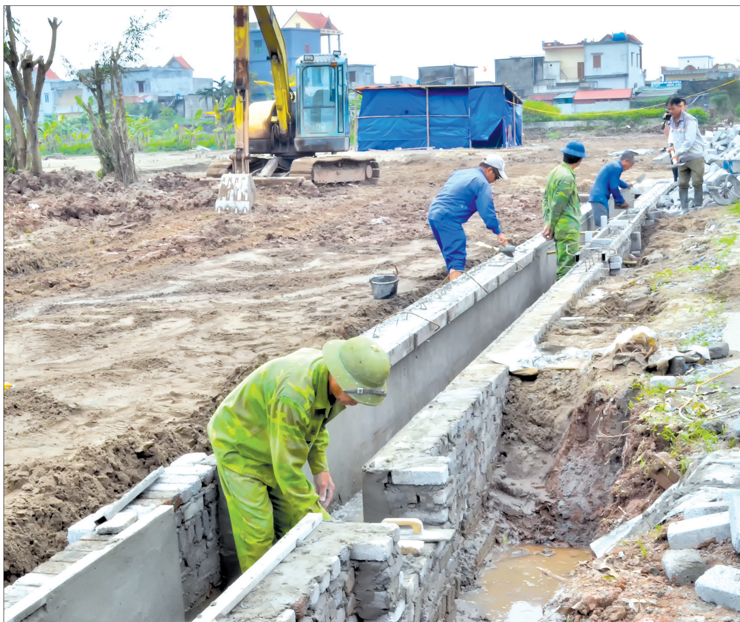
Hạ tầng khu tái định cư xã Nam Cường (Tiên Hải) cơ bản hoàn thành.