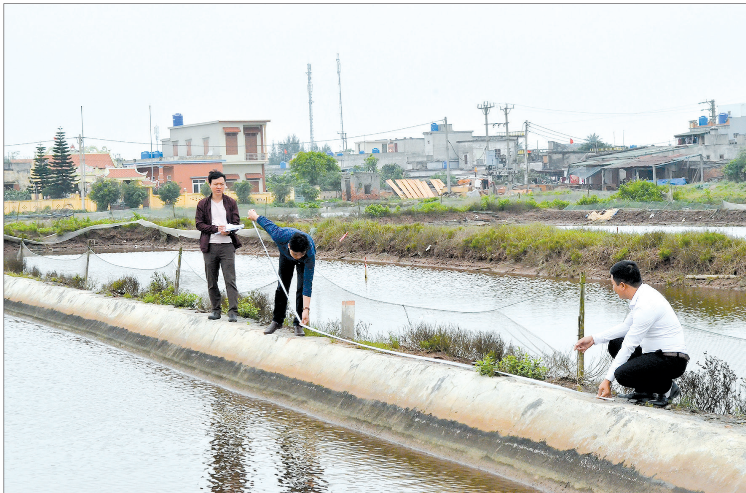
Đo đạc, kiểm đếm tại khu nuôi trồng hải sản xã Nam Cường (Tiền Hải).