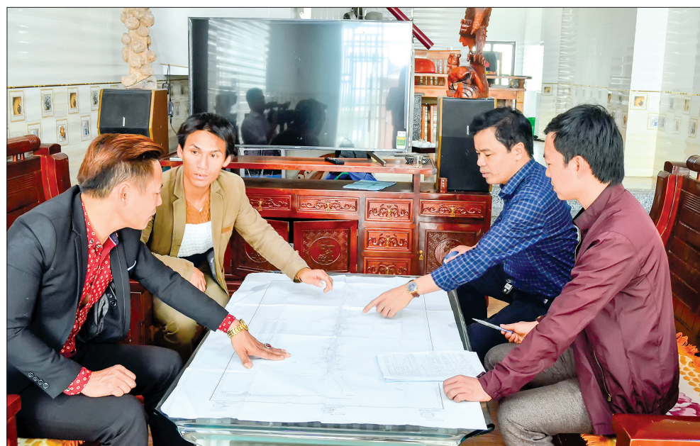
Cán bộ Trung tâm Phát triển quỹ đất, Sở Tài nguyên và Môi trường tuyên truyền, phổ biến cơ chế, chính sách đền bù, hỗ trợ giải phóng mặt bằng phục vụ thi công tuyến đường bộ ven biển cho người dân.

Theo kế hoạch, huyện Tiền Hải sẽ phải hoàn thành công tác GPMB tại 13 xã với diện tích 65,34ha của 1.074 hộ gia đình, cá nhân. Để bảo đảm bàn giao mặt bằng đúng tiến độ, thời gian qua, UBND huyện đã tập trung chỉ đạo các phòng, ban, địa phương nơi có tuyến đường đi qua chủ động phối hợp với Trung tâm Phát triển quỹ đất thuộc Sở Tài nguyên và Môi trường đẩy nhanh tiến độ GPMB, bảo đảm đúng trình tự, thủ tục, chế độ, chính sách theo quy định của pháp luật. Ngay sau khi nhận hồ sơ bàn giao mặt bằng hướng tuyến, UBND huyện đã chỉ đạo các