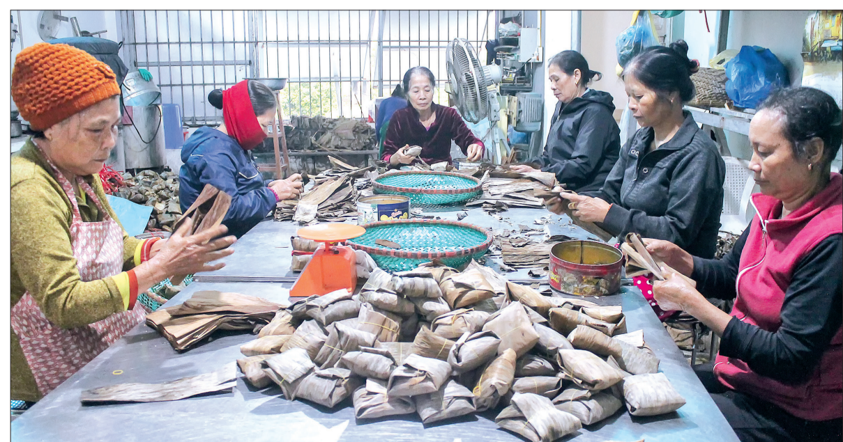
Người dân thôn Đại Đồng duy trì, phát triển nghề làm bánh gai truyền thống của quê hương Tân Hòa.