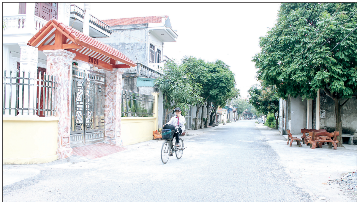
Diện mạo làng quê Đại Đồng.

Thôn Đại Đồng, xã Tân Hòa, huyện Vũ Thư vinh dự được đón Bác Hồ nghỉ lại đêm ngày 31/12/1966 khi Người về thăm Thái Bình lần thứ năm. Những kỷ niệm, tình cảm về Bác kính yêu là động lực, hành trang để mỗi người dân trong thôn đoàn kết vươn lên trong cuộc sống. Nhiều năm qua, thôn Đại Đồng là điển hình tiêu biểu trong phong trào thi đua xây dựng thôn văn hóa.