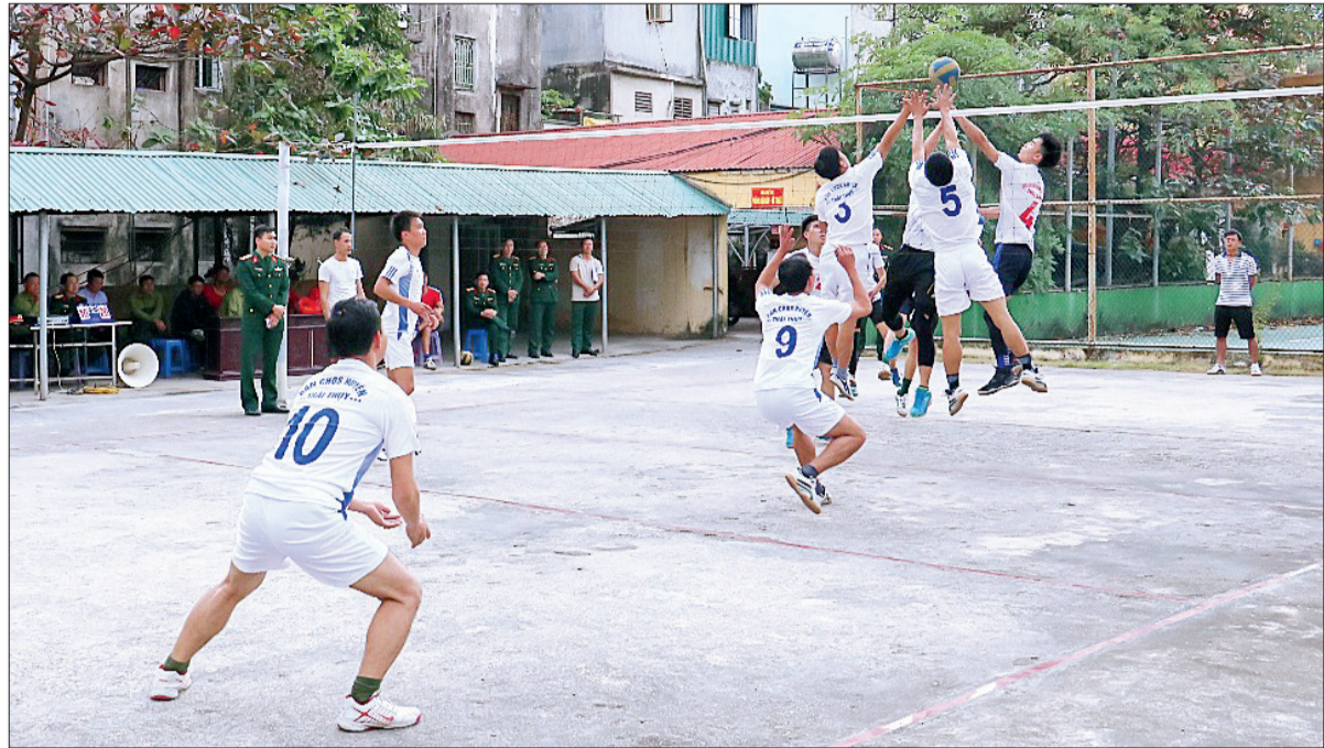
Bộ CHQS tỉnh thường xuyên tổ chức giao lưu thể thao giữa các cơ quan, đơn vị.

Những năm qua, việc thực hiện quy chế dân chủ (QCDC) ở cơ sở trong Đảng bộ Quân sự tỉnh đã mang lại hiệu quả thiết thực. Đây được coi là "chìa khóa" để thực hiện hiệu quả công tác tư tưởng, góp phần xây dựng Đảng bộ Quân sự tỉnh trong sạch, vững mạnh.