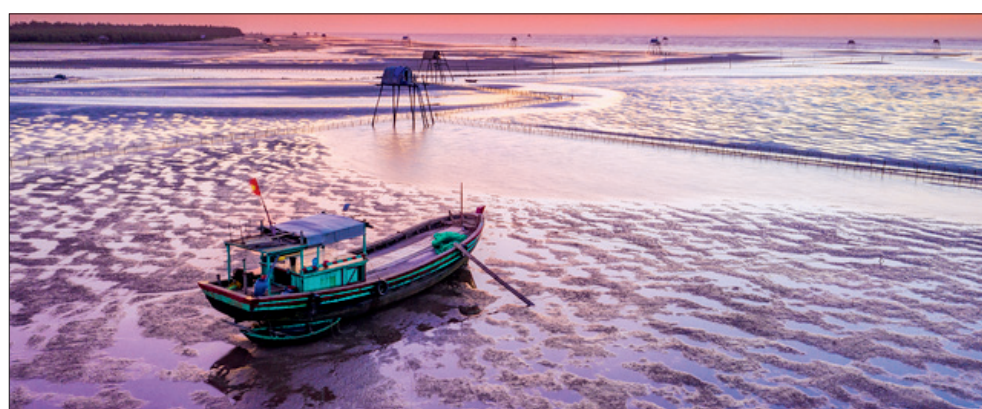
Những chiếc thuyền chở ngao đậu im lìm, dập dềnh theo kênh nước giữa “cánh đồng”, tạo khung cảnh thanh bình và thơ mộng.