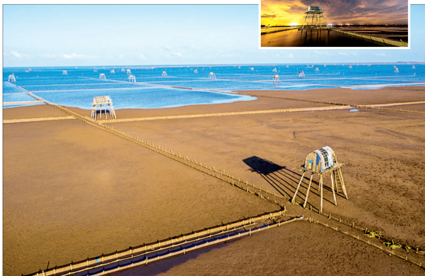
Không gian bao la, bát ngát như không có điểm kết thúc. Những chiếc chòi canh cao lớn nổi bật giữa vùng nuôi ngao.