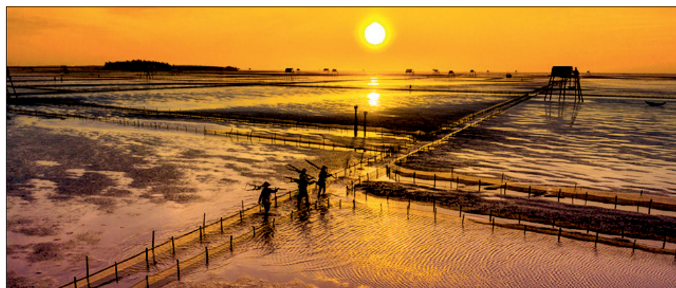
Công việc cào ngao của người dân phụ thuộc hoàn toàn vào thời điểm thủy triều lên xuống.