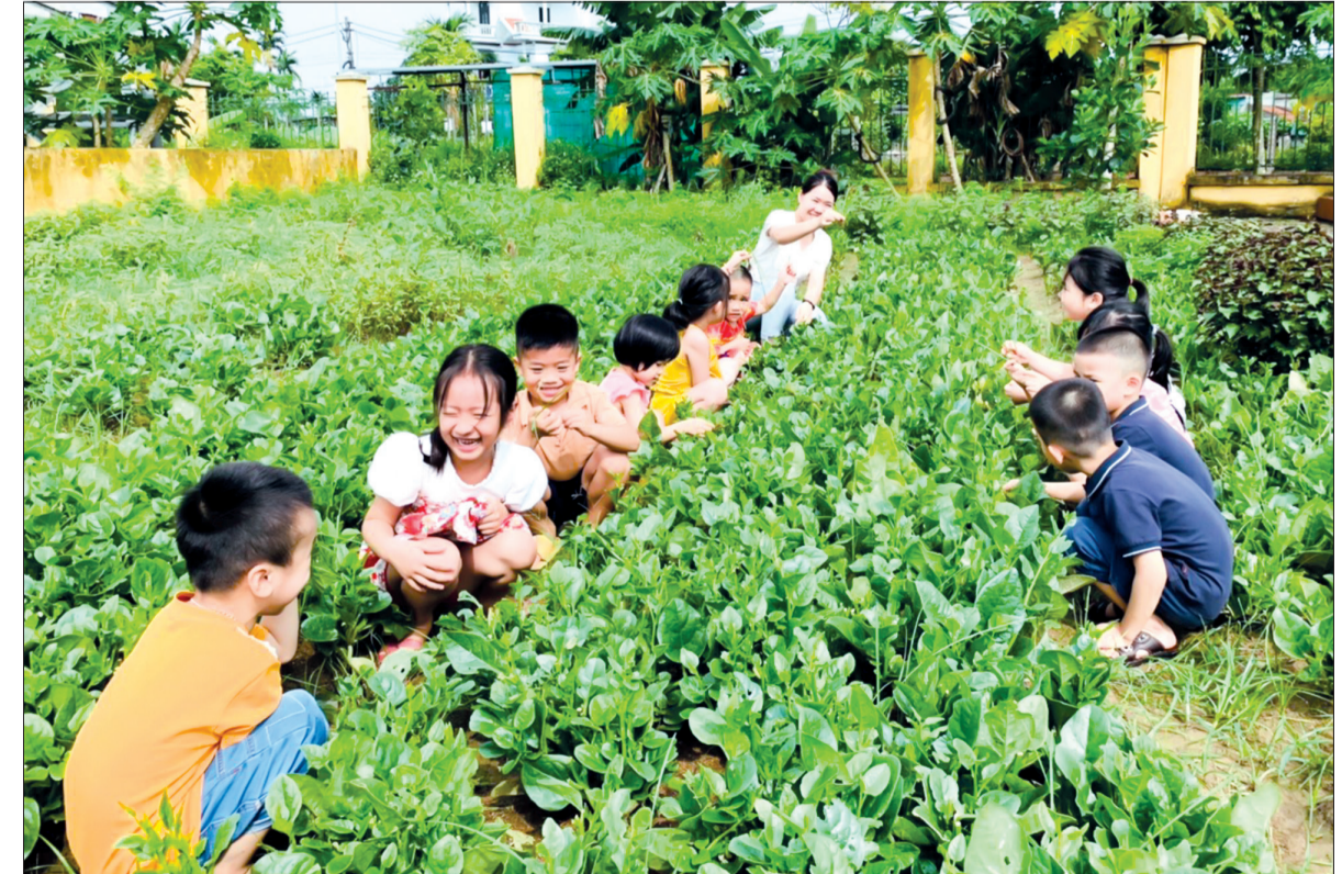
Các bạn nhỏ hào hứng với hoạt động trải nghiệm tại vườn rau của nhà trường.