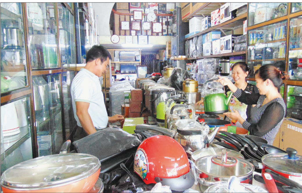
Hộ kinh doanh Thịnh Hạnh (tổ 7, thị trấn Đông Hưng) luôn chấp hành nghiêm nghĩa vụ thuế.

Mặc dù chưa kết thúc năm kế hoạch 2018 nhưng đến thời điểm này, 6/7 chỉ tiêu thu ngân sách do Chi cục Thuế huyện Đông Hưng thực hiện đã đạt và vượt dự toán với tổng thu các loại thuế, phí và lệ phí 10 tháng thực hiện 212,135 tỷ đồng, đạt 134,3% dự toán pháp lệnh, tăng 8,1% so với cùng kỳ năm 2017.