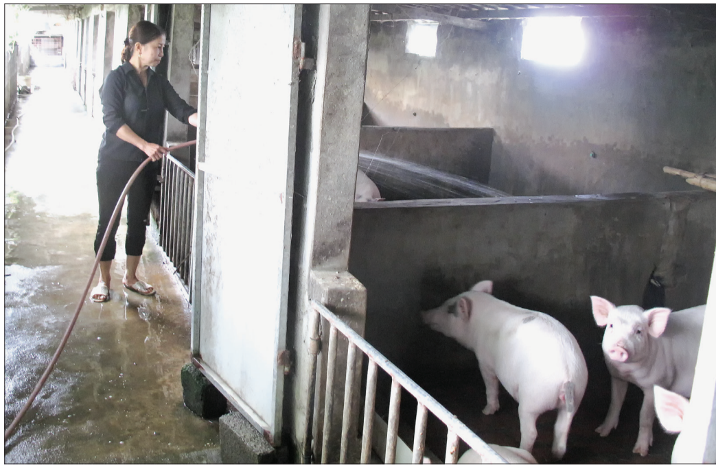
Mô hình phát triển kinh tế của hội viên Hội Nông dân xã Vũ Công (Kiến Xương).

Những năm qua, Hội Nông dân huyện Kiến Xương đã phát huy vai trò nòng cốt trong các phong trào thi đua của nông dân, đặc biệt là phong trào xây dựng nông thôn mới (NTM), góp phần thực hiện thắng lợi các mục tiêu phát triển kinh tế - xã hội tại địa phương.