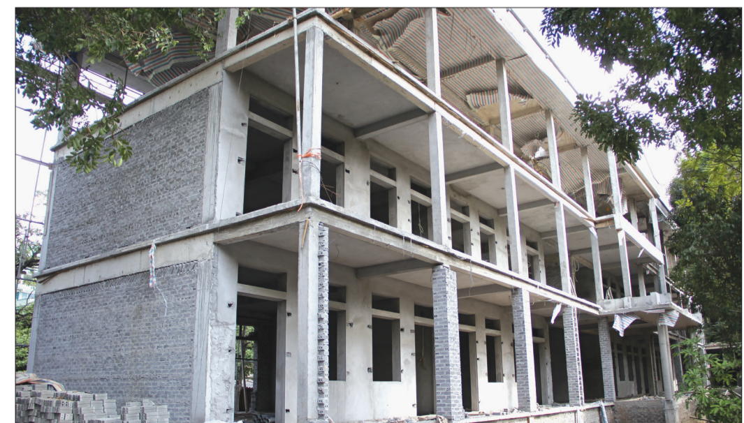
Sau hơn 5 tháng thi công, công trình nhà học 3 tầng Trường THPT Lê Quý Đôn đã hoàn thành trên 60% khối lượng.

Anh (Thái Thụy)... Đây đều là những công trình được khởi công trong năm 2018 và phần đầu hoàn thành để đưa vào sử dụng trong năm 2019. Để bảo đảm tiến độ các công trình, thời gian qua, Ban Quản lý dự án đã