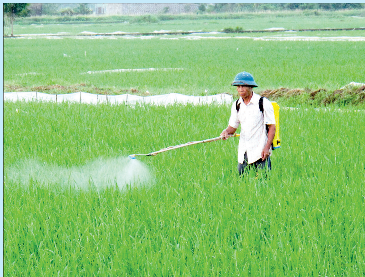
Nông dân Thái Thụy phun thuốc trừ rầy lưng trắng và lùn sọc đen.