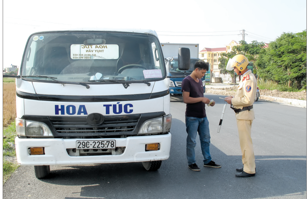
Lực lượng cảnh sát giao thông Công an huyện Thái Thụy tuần tra, kiểm soát tại tuyến đường tỉnh 456.

Những ngày này, lực lượng công an huyện Thái Thụy đang nỗ lực, quyết tâm giữ vững an ninh trật tự (ANTT) trên địa bàn, bảo đảm cho nhân dân vui xuân, đón tết Nguyên đán Mậu Tuất 2018 an toàn.