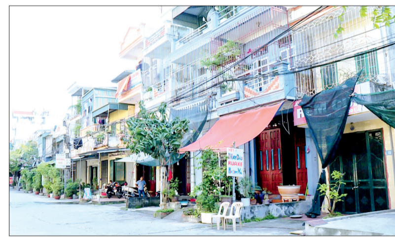
Nhiều gia đình vây kín ban công bằng rào sắt kiên cố, không chỉ bị mất lối thoát hiểm khi cháy, nổ xảy ra mà còn gây khó khăn cho lực lượng PCCC tiếp cận hiện trường.

Để giảm nguy cơ cháy tại các khu dân cư, thời gian qua, công an các địa phương, nhất là lực lượng cảnh sát PCCC và cứu nạn, cứu hộ, Công an tỉnh đã tăng cường tuyên truyền nâng cao nhận thức cho người dân, trong đó tập trung tuyên truyền ở những khu dân cư có nhiều cơ sở sản xuất, làng nghề, khu nhà trọ, chung cư cao tầng...; đồng thời, thường xuyên tổ chức các lớp tập huấn về kiến thức, kỹ năng PCCC... Ngoài ra,