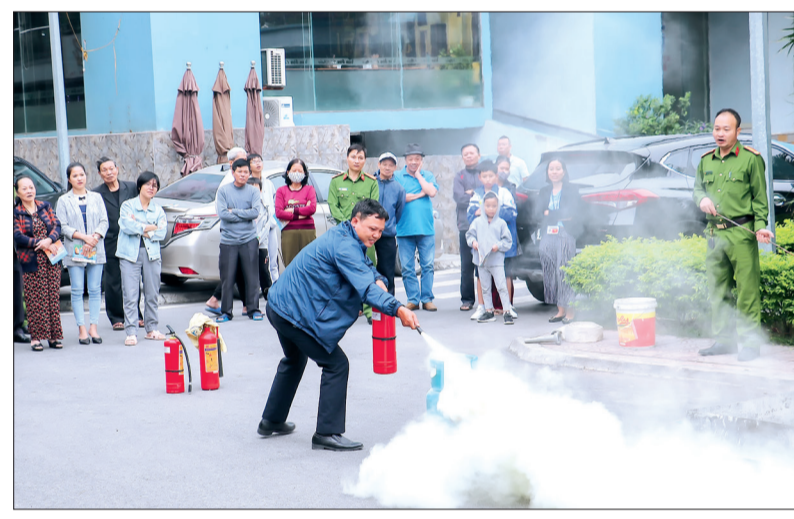
Phòng Cảnh sát phòng cháy, chữa cháy và cứu nạn, cứu hộ (Công an tỉnh) tập huấn phòng, chống cháy, nổ cho người dân chung cư Damsan, thành phố Thái Bình.