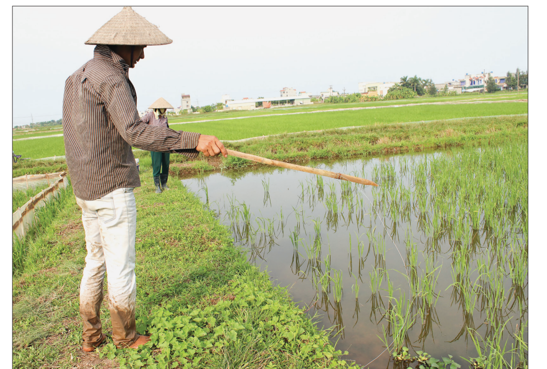
Tình trạng dùng điện để bẫy chuột còn diễn ra tại một số địa phương.