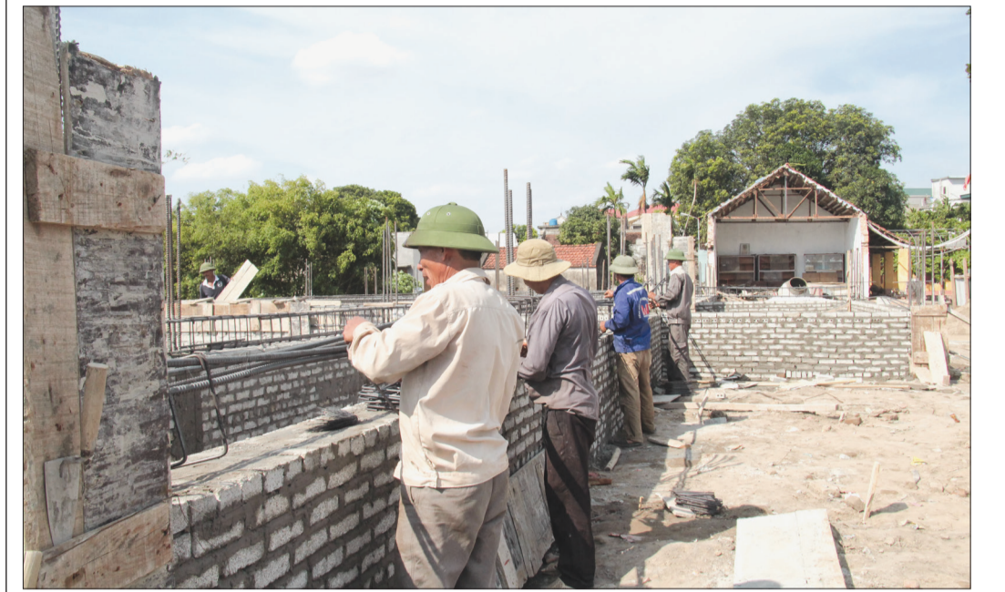
Trường THCS Đồng Á được đầu tư xây dựng mới.

Nhờ phát huy dân chủ, để cao vai trò của người dân, xã Đồng Á (Đồng Hưng) đã hoàn thành 19/19 tiêu chí nông thôn mới (NTM), về đích sớm hơn dự kiến ban đầu.