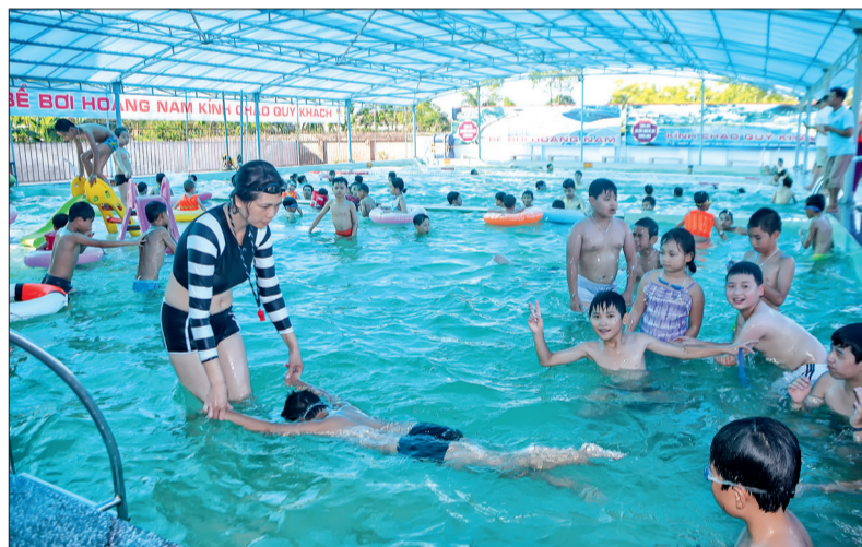
Đạy bơi là cách phòng, tránh đuối nước cho trẻ em.

Hàng năm, cứ đến hè tình trạng trẻ em, học sinh bị đuối nước lại xảy ra ở nhiều địa phương trong tỉnh. Đây là nỗi đau và mối lo không chỉ của riêng mỗi gia đình mà còn là của toàn xã hội. Vì vậy, việc chủ động phòng, tránh đuối nước cho trẻ trong dịp hè rất cần được các cấp, các ngành, các địa phương và gia đình quan tâm.