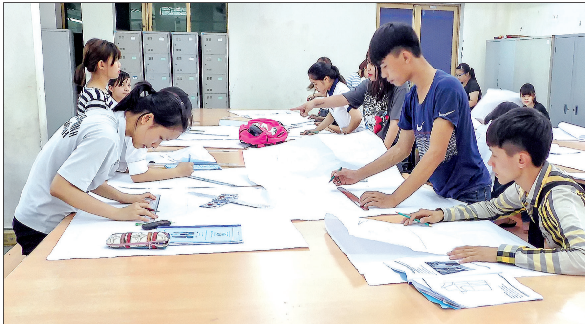
Nhiều học sinh đã chọn học nghề sau tốt nghiệp THCS (học sinh học nghề may tại Trường Đại học Thái Bình).