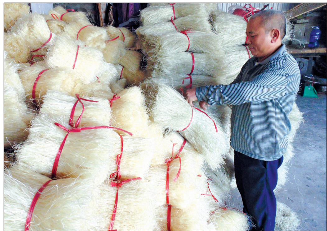
Nghề làm miến mang lại thu nhập cao cho người dân xã Đông Thọ (thành phố Thái Bình).