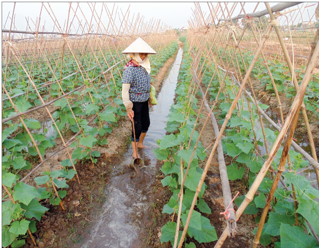
Nông dân xã Vũ Lạc (thành phố Thái Bình) chăm sóc rau màu.

Xác định việc hỗ trợ, giúp đỡ hội viên phát triển kinh tế là nhiệm vụ trọng tâm, nhiệm kỳ qua, Hội Nông dân thành phố đã chỉ đạo các cơ sở hội tích cực tuyên truyền, vận động hội viên chuyển đổi cơ cấu cây trồng, vật nuôi gắn với thực hiện các quy hoạch chung về phát triển kinh tế - xã hội của thành phố. Hội tổ chức phát động phong trào thi đua sản xuất, kinh doanh giỏi, đoàn kết giúp nhau làm giàu và giảm nghèo bền vững đến các cơ sở hội; tăng cường công tác tuyên truyền, vận động, hướng dẫn hội viên phát huy những lợi thế về điều kiện tự nhiên của địa phương và các chính sách hỗ trợ của hội cấp trên để chuyển đổi cơ cấu cây trồng, vật nuôi theo hướng sản xuất hàng hóa, xây dựng các mô hình phát triển kinh tế cho thu nhập cao. 5 năm qua có gần 53.000 lượt hộ đạt danh hiệu sản xuất, kinh doanh giỏi các cấp; xuất hiện ngày càng nhiều hộ nông dân sản xuất, kinh doanh giỏi; nhiều mô hình kinh tế đã thu hút và tạo việc làm cho hàng trăm lao động. Đến nay, toàn thành phố đã xây dựng 5 mô hình kinh tế tập thể, có hiệu quả kinh tế cao dưới hình thức các tổ hợp tác, 4 mô hình trồng trọt với 128 hộ tham gia, 1 mô hình chăn nuôi với 46 hộ tham gia và 2 câu lạc bộ chăn nuôi,