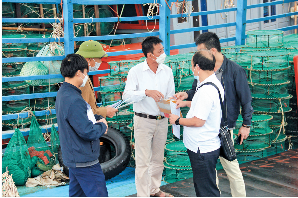
Cán bộ Chi cục Thủy sản tuyên truyền Luật Thủy sản cho ngư dân.

Thực hiện các khuyến nghị của EC về chống khai thác IUU, thời gian qua, ngành nông nghiệp và các địa phương đã nỗ lực triển khai nhiều giải pháp và đã đạt được những kết quả tích cực. Công tác tuyên truyền các quy định chống khai thác IUU, Luật Thủy sản cho cộng đồng và ngư dân đã được các cấp, ngành vào cuộc triển khai với nhiều hình thức phù hợp với từng đối tượng, từ đó nhận thức của người dân đã nâng lên rõ rệt; đã thành lập Văn phòng đại diện thanh tra, kiểm tra, kiểm soát nghề cá