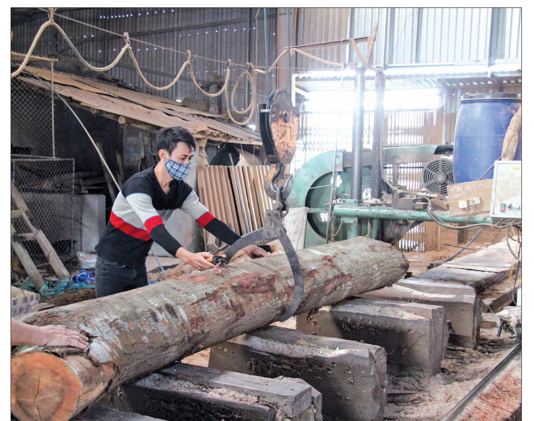
Nhờ sử dụng máy móc hiện đại, chuyên môn hóa sản xuất đã giúp sản phẩm của làng nghề vươn xa.