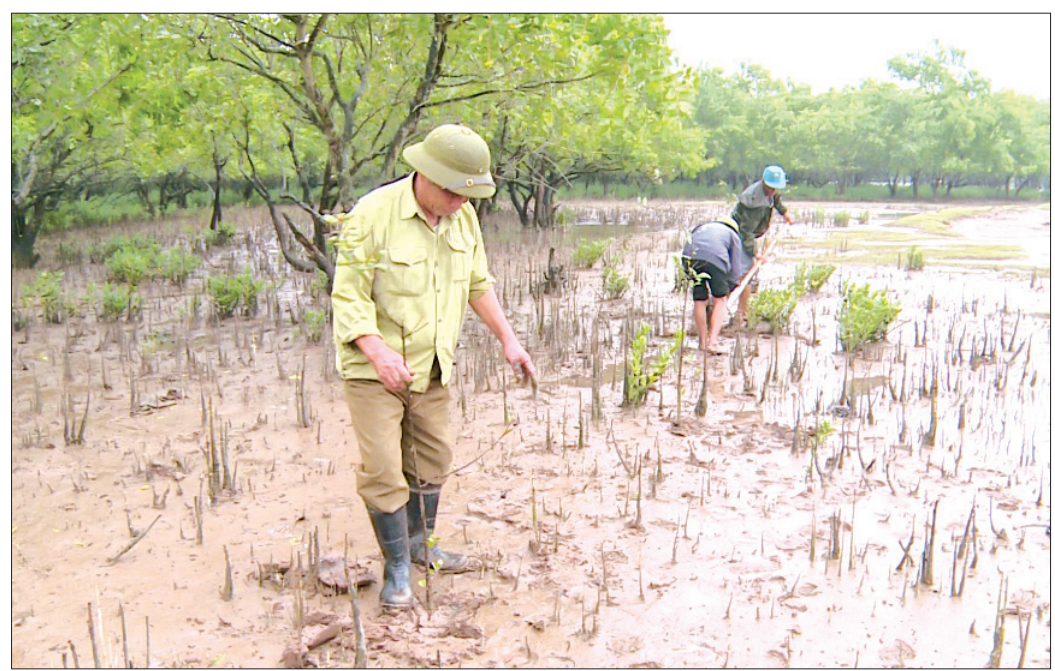
Cựu chiến binh xã Đông Long (Tiền Hải) tham gia trồng rừng ngập mặn.

Nghe theo tiếng gọi thiêng liêng của Tổ quốc lên đường chiến đấu chống giặc ngoại xâm, khi hòa bình trở lại, các cựu chiến binh (CCB) huyện Tiền Hải lại tích cực đi đầu trong các phong trào phát triển kinh tế, xóa đói giảm nghèo, góp phần xây dựng quê hương ngày càng giàu đẹp.