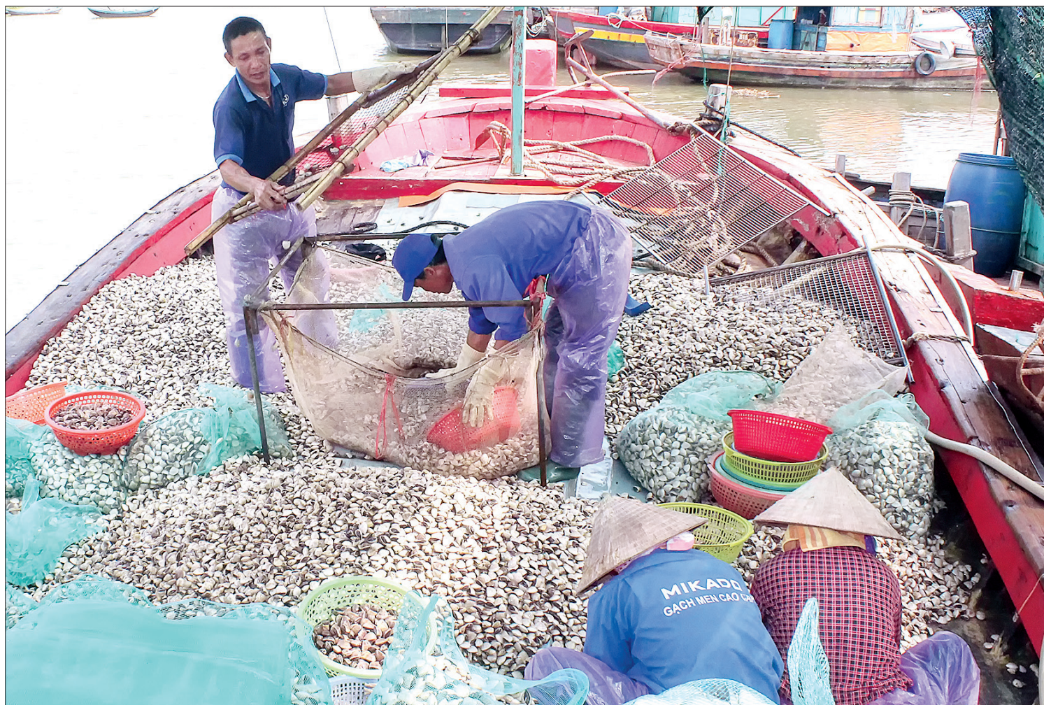
Thu hoạch ngao tại xã Nam Thịnh (Tiên Hải).

Với chiều dài bờ biển 23km, ba mặt tiếp giáp với sông, biển, Tiên Hải xác định kinh tế biển là ngành kinh tế mũi nhọn, nhất là trên hai lĩnh vực khai thác và nuôi trồng thủy hải sản, tạo động lực phát triển kinh tế - xã hội địa phương đồng thời bảo đảm vững chắc về quốc phòng, an ninh.