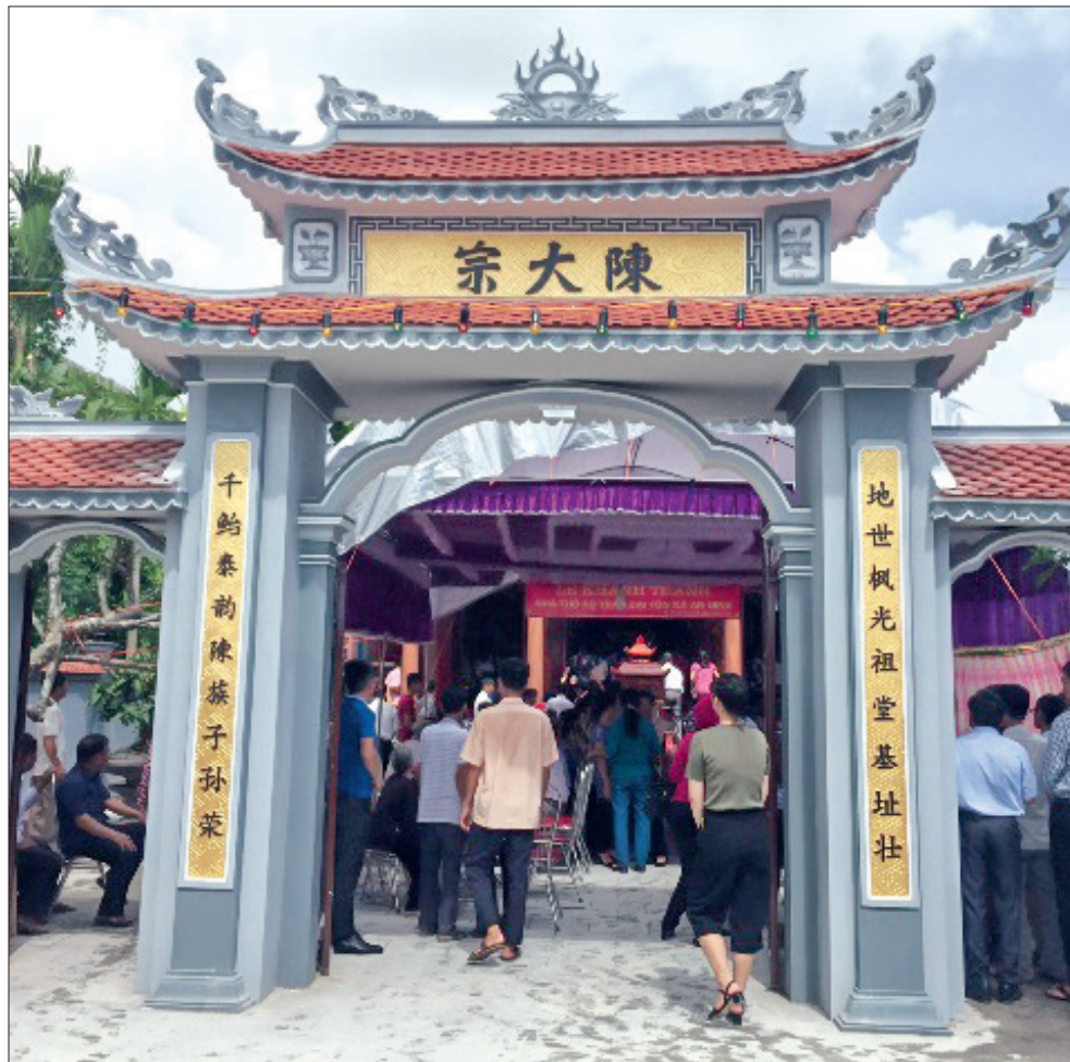
Nhà thờ họ Trần (Trình Trung, xã An Ninh) luôn là chỗ dựa vững chắc về tinh thần, tạo thêm nguồn sức mạnh đoàn kết cho con cháu trong sự nghiệp xây dựng và bảo vệ quê hương, đất nước.