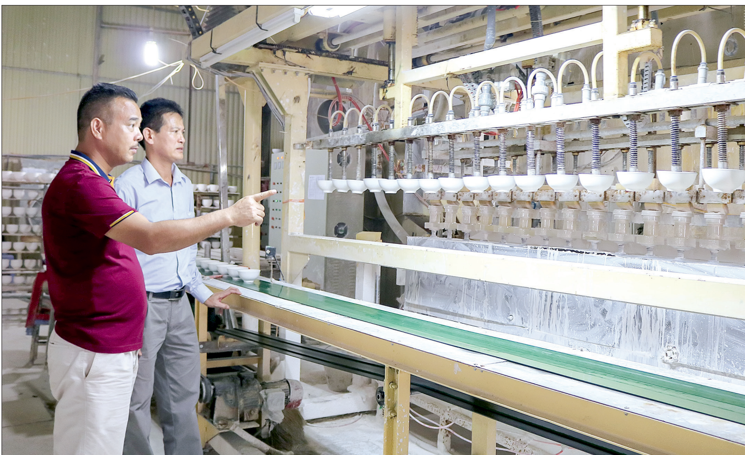
Dây chuyền sản xuất của Công ty TNHH Sứ Đông Lâm (Tiền Hải).

Xác định công nghiệp là một trong ba trụ cột quan trọng trong phát triển kinh tế, phát huy tiềm năng, thế mạnh của huyện, Tiên Hải đã tập trung mọi nguồn lực đầu tư hạ tầng, tạo môi trường sản xuất, kinh doanh thuận lợi cho các tổ chức, cá nhân. Những kết quả đạt được rất đáng ghi nhận, thực sự mở ra bức tranh kinh tế sinh động cho địa phương.