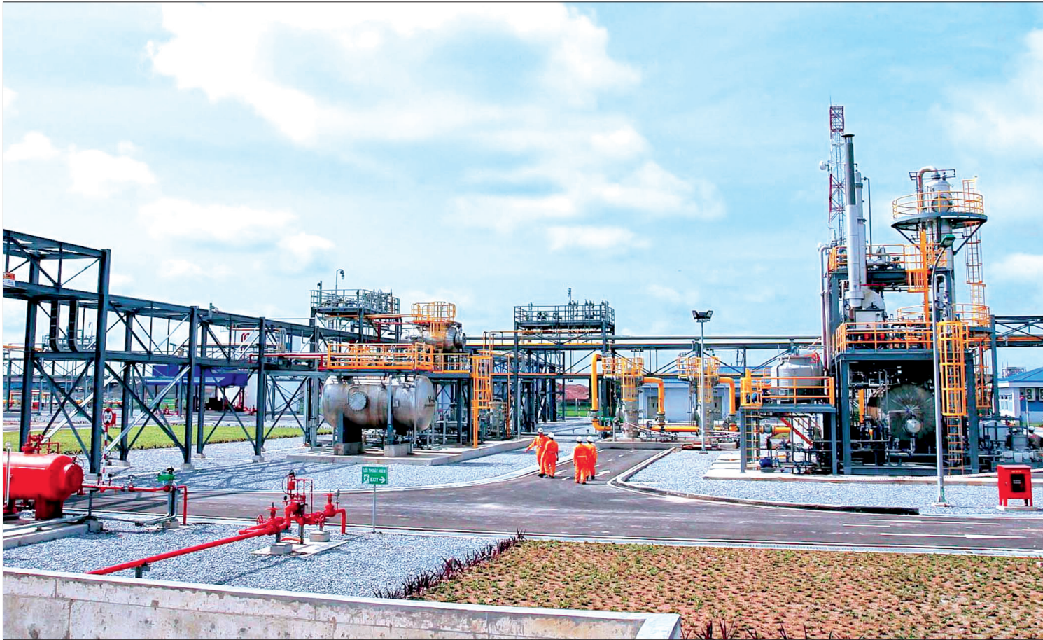
Xí nghiệp Phân phối khí thấp áp miền Bắc tại Tiên Hải.

Phó Bí thư Huyện ủy, Chủ tịch UBND huyện Tiên Hải