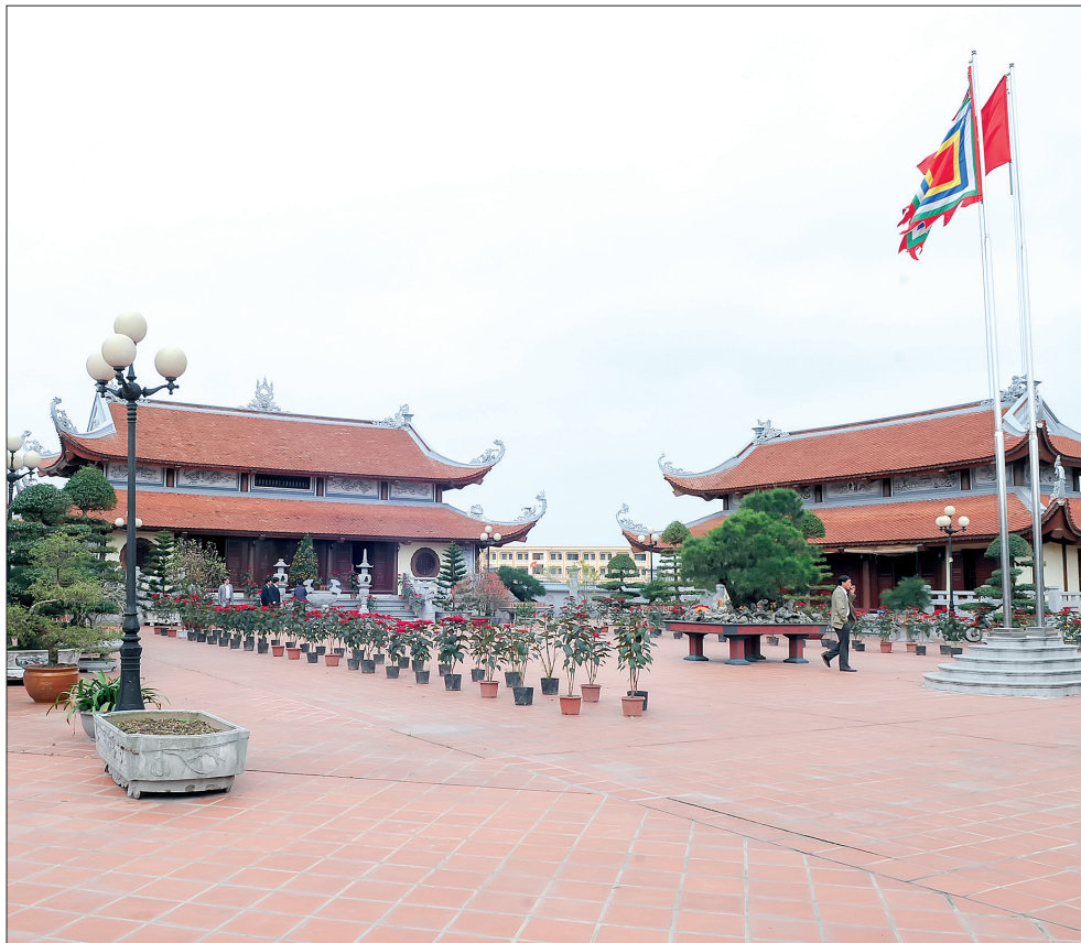
Khu tưởng niệm Doanh điền sứ Nguyễn Công Trứ (xã Tây Sơn, huyện Tiên Hải).