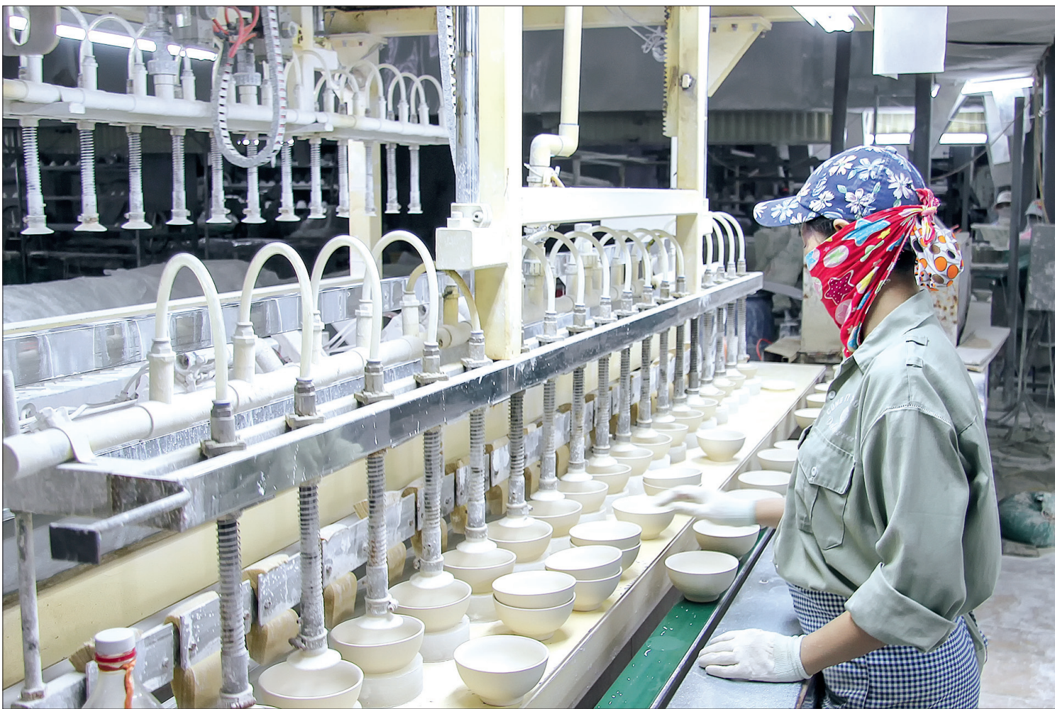
Sản xuất sứ dân dụng tại khu công nghiệp Tiên Hải.

Là vùng đất trẻ, với 190 năm hình thành và phát triển, song huyện Tiên Hải có bề dày truyền thống văn hóa, lịch sử. Tên tuổi của huyện Tiên Hải gắn liền với tên tuổi của Doanh điền sứ Nguyễn Công Trứ. Tiên Hải tự hào là quê hương tiếng trống năm 1930 với phong trào cách mạng ngày 14/10/1930. Đảng bộ, nhân dân và lực lượng vũ trang huyện Tiên Hải vinh dự được Đảng, Nhà nước phong tặng danh hiệu Anh hùng Lực lượng vũ trang nhân dân thời kỳ kháng chiến chống thực dân Pháp xâm lược. Ngày 26/3/1962, Tiên Hải vinh dự được đón Chủ tịch Hồ Chí Minh về thăm.