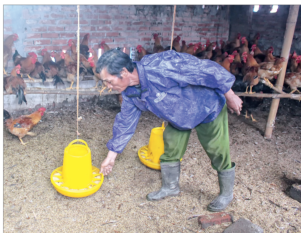
Cùng với chăn nuôi bò, chăn nuôi gia cầm cũng cho gia đình ông Bốn nguồn thu nhập đáng kể.