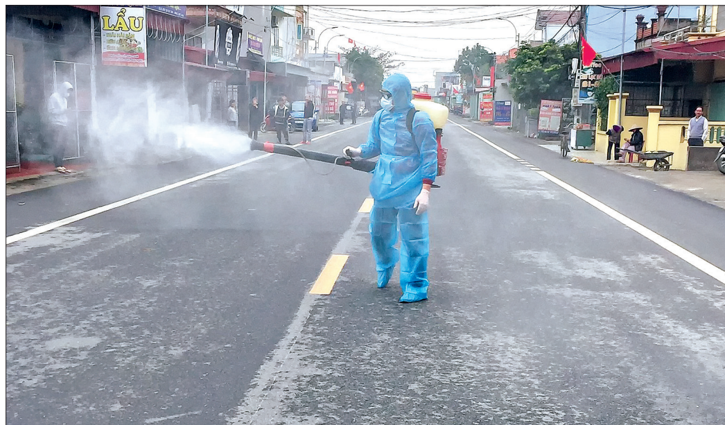
Trung tâm Y tế huyện Thái Thụy tổ chức phun hóa chất khử khuẩn tại tỉnh lộ 456.

Trên địa bàn huyện Thái Thụy hiện chưa phát hiện trường hợp nào nghi mắc bệnh viêm đường hô hấp cấp do chủng mới của virus corona (Covid-19) nhưng trước diễn biến phức tạp của dịch bệnh, huyện đang triển khai đồng bộ các biện pháp phòng ngừa, đồng thời chuẩn bị những điều kiện cần thiết sẵn sàng ứng phó có hiệu quả khi dịch xảy ra.