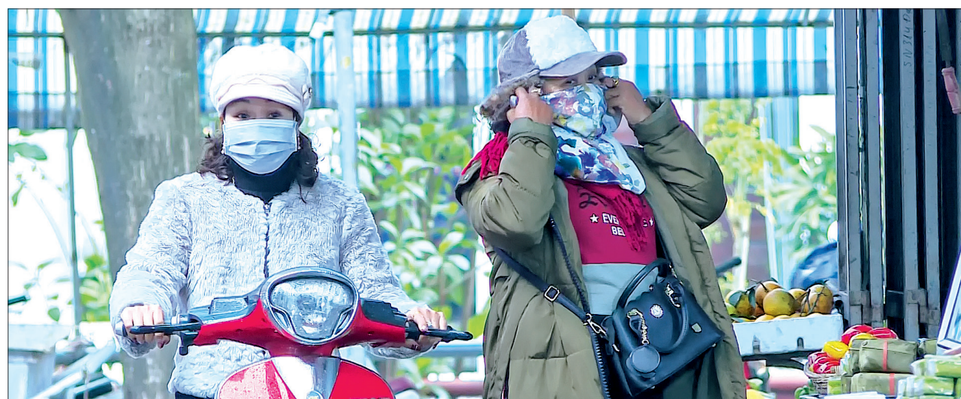
Người dân đeo khẩu trang khi ra đường.

tình hình sản xuất vẫn diễn ra bình thường. Trước đây tôi chỉ sử dụng khẩu trang khi đi xe máy nhưng giờ tôi đeo khẩu trang trong thời gian làm việc ở công ty, trừ lúc ăn nghỉ. Ở nhà, tôi cũng nhắc bố mẹ và các con thường xuyên rửa tay bằng xà phòng diệt khuẩn, mặc