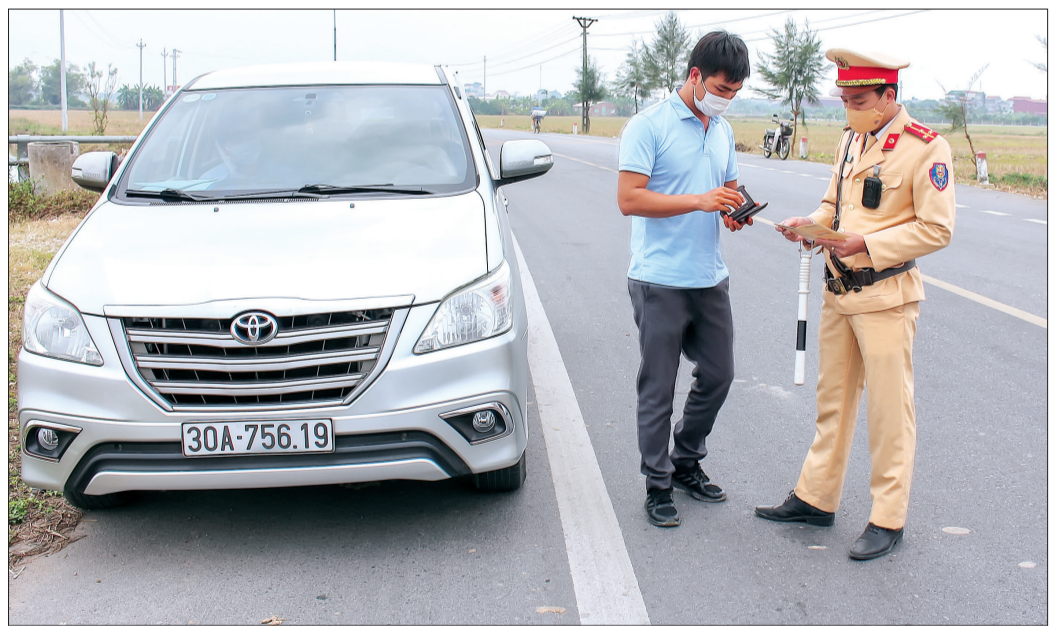
Lực lượng cảnh sát giao thông Công an huyện Thái Thụy tuần tra, kiểm soát trên tuyến đường tỉnh ĐT.456, đoạn qua địa bàn xã Thụy Bình.

Hiện nay, các lực lượng chức năng và địa phương trên địa bàn huyện Thái Thụy đang tích cực triển khai nhiều biện pháp nhằm bảo đảm an toàn giao thông (ATGT) dịp nghỉ lễ 30/4 - 1/5 sắp tới, đặc biệt là tăng cường công tác tuần tra, kiểm soát, xử lý nghiêm hành vi vi phạm pháp luật về trật tự ATGT và chống tái lấn chiếm vỉa hè, hành lang ATGT đường bộ.