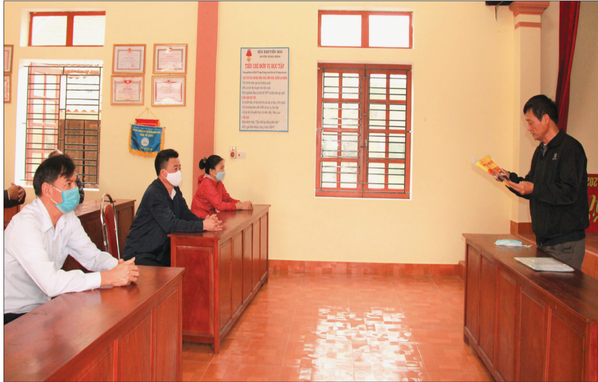
Chi bộ tổ dân phố số 4, thị trấn Đông Hưng (Đông Hưng) tổ chức sinh hoạt định kỳ.

Ngày 20/4/2022, Ban Thường vụ Tỉnh ủy ban hành đề án xây dựng mô hình chi bộ kiểu mẫu trong các loại hình chi bộ ở Đảng bộ tỉnh giai đoạn 2022 - 2025. Đây được coi là một trong những giải pháp rất quan trọng để xây dựng TCCSD vững mạnh từ cơ sở. Theo đó, chi bộ kiểu mẫu phải là chi bộ thực hiện tốt các chức năng, nhiệm vụ theo quy định, khẳng định được năng lực lãnh đạo, sức chiến đấu thông qua kết quả nổi bật về việc học tập nâng cao nhận thức chính trị, lý luận, tư tưởng, chủ trương, đường lối của Đảng, chính sách, pháp luật của Nhà nước. Chất lượng chi bộ được nâng lên thực chất, bảo đảm vừa thực hiện đúng quy định về chức năng, nhiệm vụ vừa bám sát nhiệm vụ chính trị của địa phương, cơ quan, đơn vị; ban hành nghị quyết lãnh đạo sát, đúng thực tế, làm cơ sở để thực hiện nhiệm vụ chính trị, góp phần quan trọng thực hiện nhiệm vụ chính trị ngày càng tốt hơn, cao hơn và ý thức trách nhiệm, tự giác, gương mẫu của đảng viên được nâng cao. Xây dựng chi bộ kiểu mẫu sẽ thực hiện thí điểm từ đầu năm 2022; mỗi huyện, thành ủy, đảng ủy trực thuộc Tỉnh ủy khảo sát, chọn trong mỗi loại hình chi bộ từ 1 - 3 chi bộ để lãnh đạo