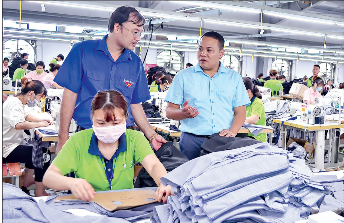
Thành phố có hơn 200 mô hình thanh niên làm kinh tế giỏi.

Thời gian qua, Hội Liên hiệp Thanh niên (LHTN) thành phố Thái Bình đã tổ chức nhiều hoạt động củng cố và phát triển tổ chức hội, phát huy tinh thần xung kích, tình nguyện, lập thân, lập nghiệp; tập hợp rộng rãi các tầng lớp thanh niên góp phần thực hiện nhiệm vụ chính trị và tham gia phát triển kinh tế - xã hội tại địa phương.