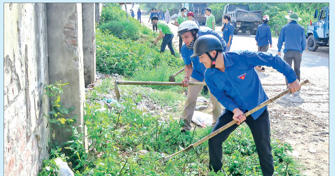
Hoạt động bảo vệ môi trường được các cấp bộ đoàn, hội thành phố Thái Bình tổ chức thường xuyên.