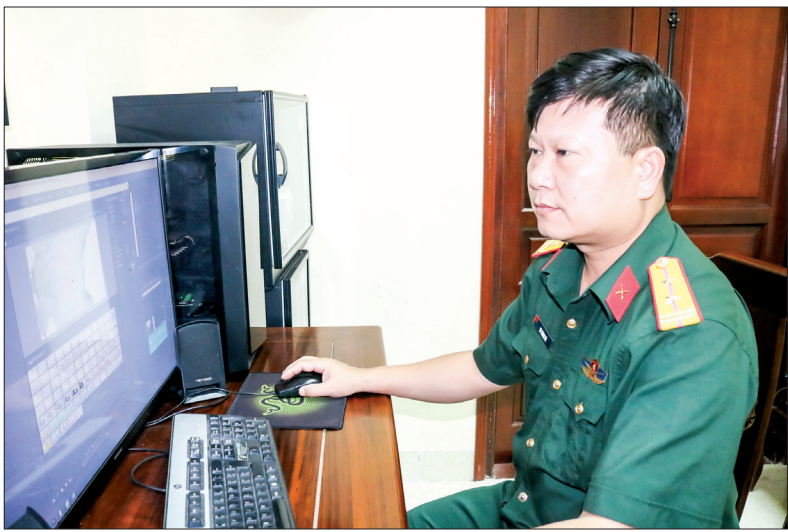
Cán bộ, chiến sĩ Bộ Chỉ huy Quân sự tỉnh sản xuất tin bài tuyên truyền, đẩy lùi thông tin xấu độc trên không gian mạng.

tạo được hiệu ứng lan tỏa trong cộng đồng sử dụng mạng xã hội, góp phần củng cố trận địa tư tưởng trên không gian mạng trong tình hình mới.