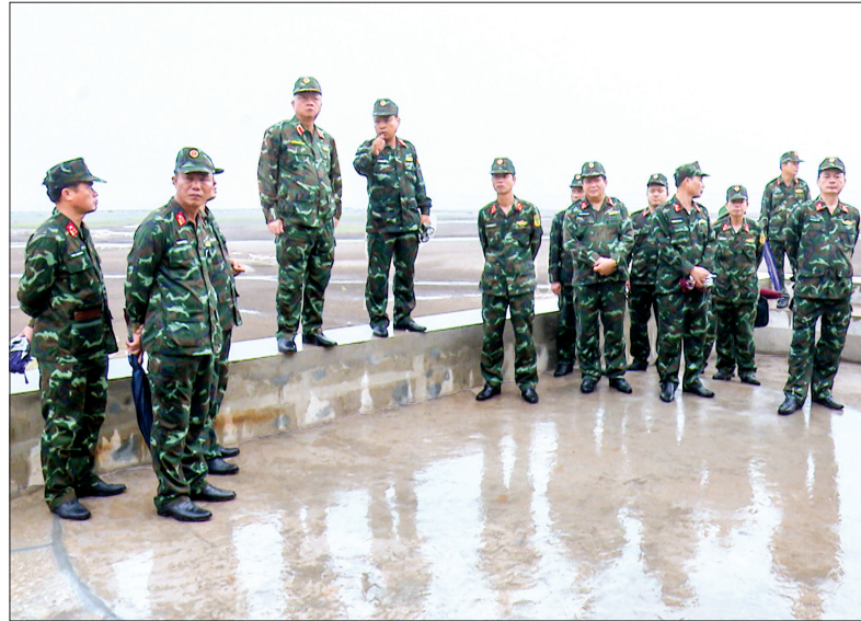
Tư lệnh Quân khu 3 kiểm tra trận địa pháo 85mm tại khu vực cồn Vành.