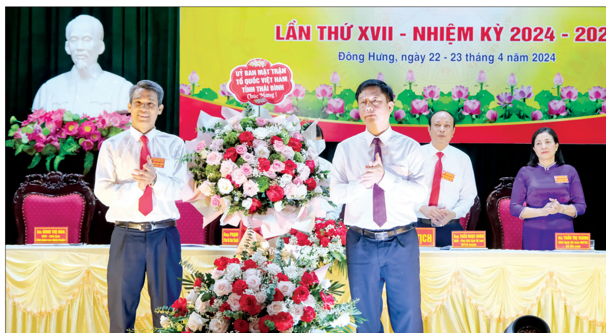
Đồng chí Vũ Thanh Vân, Ủy viên Ban Thường vụ Tỉnh ủy, Chủ tịch Ủy ban MTTQ tỉnh chúc mừng Đại hội.

Đại hội đã hiệp thương cử 65 vị tham gia Ủy ban MTTQ huyện Đông Hưng khóa XVII, nhiệm kỳ 2024 - 2029 và cử đoàn đại biểu dự Đại hội đại biểu MTTQ Việt Nam tỉnh lần thứ XIX, nhiệm kỳ 2024 - 2029.