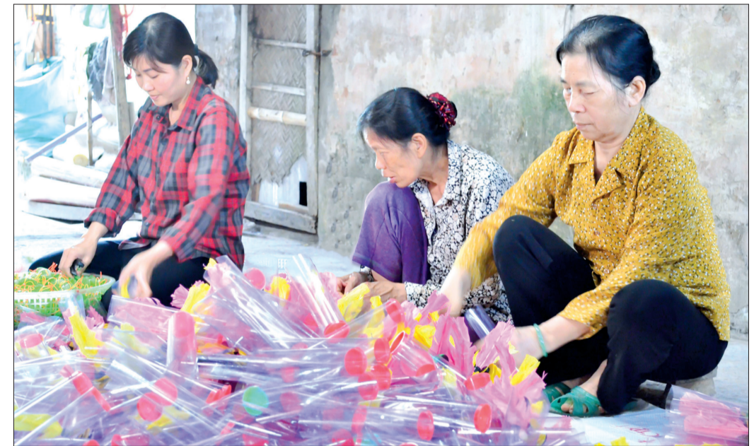
Hợp tác xã sản xuất cầu lông xã Đông Hòa (thành phố Thái Bình) thu hút nhiều phụ nữ tham gia.

Cùng với việc đầu tư cho phòng học, trang thiết bị học tập, huyện Thái Thụy còn quan tâm, ban hành cơ chế hỗ trợ kinh phí cho các trường học xây dựng nhà vệ sinh sạch đẹp. Đồng thời, tích cực huy động nguồn xã hội hóa để xây dựng nhà vệ sinh trong trường học, nhằm phục vụ thuận lợi cho học sinh trong sinh hoạt cá nhân và học tập. Những năm qua, huyện Thái Thụy đã quan tâm đầu tư xây dựng cơ sở vật chất trường học, trong đó có công tác xây mới, sửa chữa, cải tạo nhà vệ sinh cho học sinh. Theo số liệu khảo sát gần đây của ngành chức năng huyện, 56/56 trường tiểu học, THCS, tiểu học và THCS trên địa bàn huyện đã có nhà vệ sinh cho học sinh. Đặc biệt, trong các năm 2018, 2019, có 4 trường tiểu học trên địa bàn huyện được tổ chức phi chính phủ Latter Day Saint Charities - Mỹ tài trợ xây dựng mới nhà vệ sinh theo quy chuẩn. Mặc dù đã có công trình nhà vệ sinh để sử dụng nhưng phần lớn nhà vệ sinh trong các trường học trên địa bàn huyện hiện nay chưa bảo đảm về chất lượng, đa số được cấp