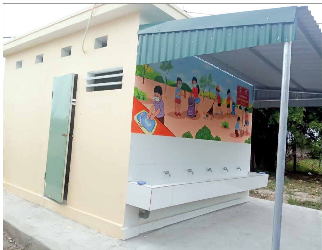
Nhà vệ sinh Trường Tiểu học và THCS Thụy Dân (Thái Thụy) được xây dựng khang trang, sạch sẽ.

nghiêm trọng hoặc diện tích quá nhỏ, chưa đáp ứng được nhu cầu và ảnh hưởng không nhỏ tới sức