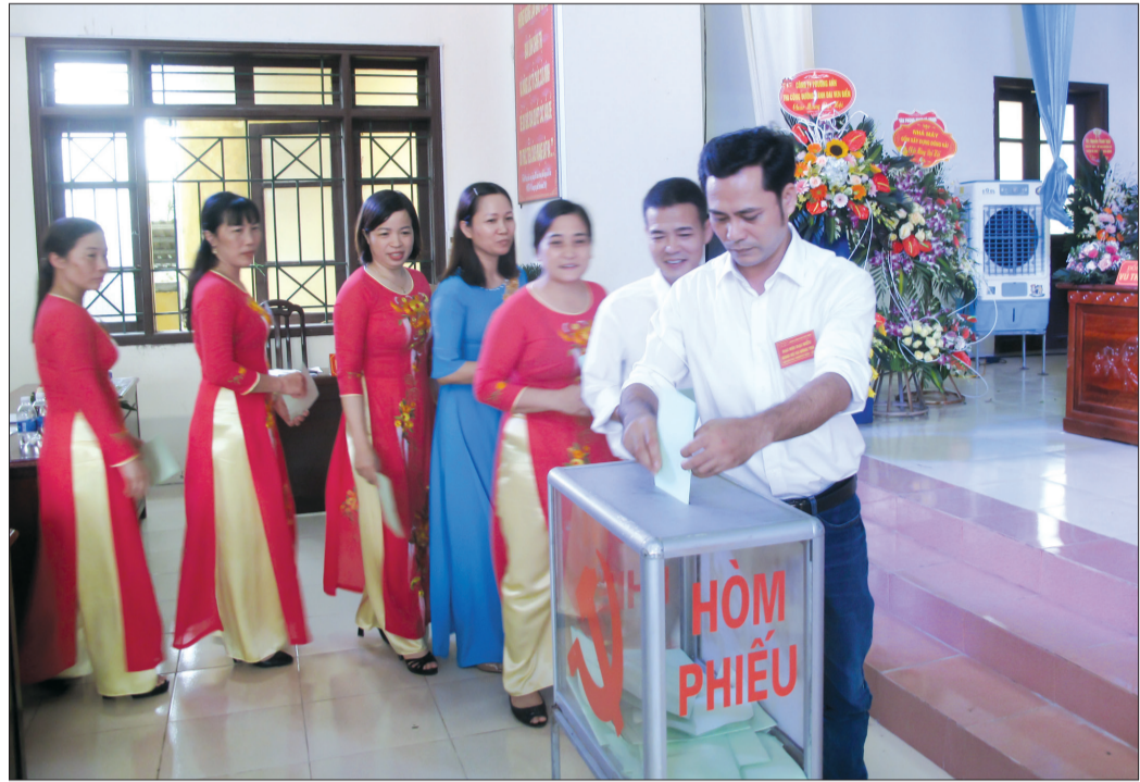
Bỏ phiếu bầu Ban Chấp hành Đảng bộ xã Đông Trà (Tiền Hải) nhiệm kỳ 2020 - 2025.

Đến thời điểm này, các đảng bộ, chi bộ cơ sở trên địa bàn tỉnh đã tiến hành xong đại hội. Nhìn chung, công tác chuẩn bị, tổ chức đại hội đều cơ bản theo đúng kế hoạch đề ra, bảo đảm đúng quy trình, quy định, mang tính thân đối mới, nghiêm túc, dân chủ, trí tuệ.