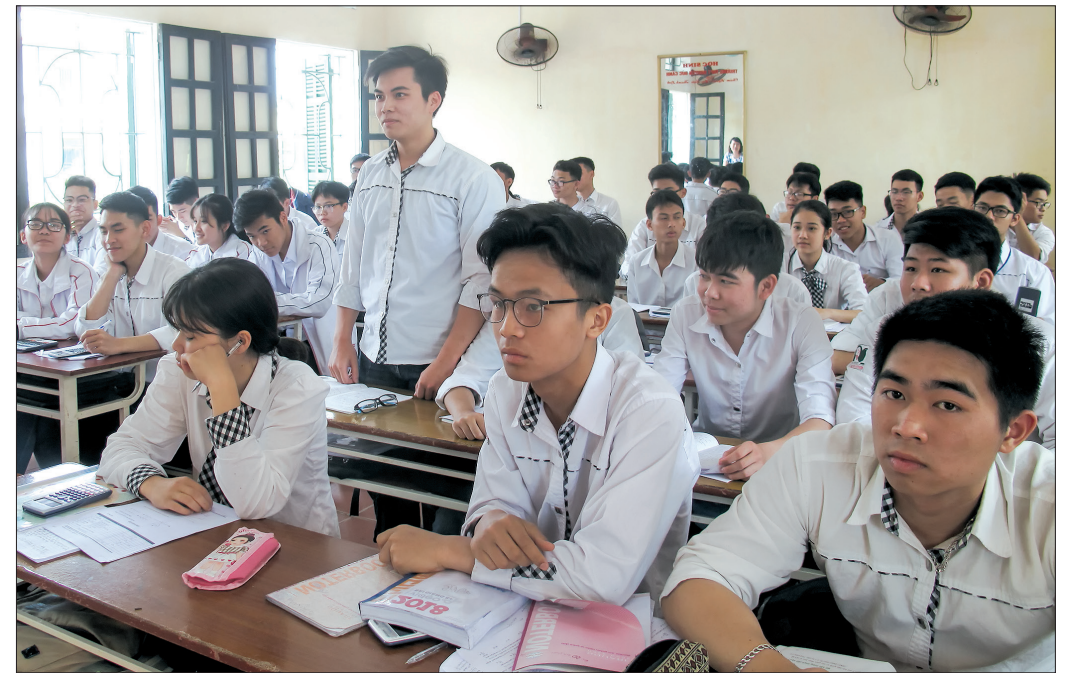
Học sinh Trường THPT Nguyễn Đức Cảnh tích cực chuẩn bị cho kỳ thi THPT quốc gia.

Những ngày này, thầy và trò Trường THPT Nguyễn Đức Cảnh triển khai kế hoạch tăng tốc cho việc ôn tập. Năm học này, nhà trường có 14 lớp 12 với 768 học sinh. Để công tác ôn tập đạt kết quả cao, nhà trường yêu cầu giáo viên phân chia đối tượng học sinh, tổ chức ôn tập phù hợp từng nhóm đối tượng, theo năng lực học sinh, trong đó chú trọng bảo đảm việc dạy học, ôn tập, kiểm tra, đánh giá đầy đủ các môn học trong chương trình giáo dục hiện hành, tuyệt đối không để xảy ra