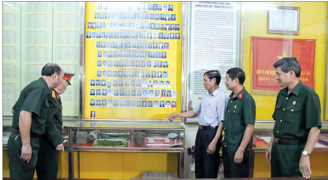
Những kỷ vật gắn liền với thời kháng chiến của các cựu chiến binh.

Tháng 5, cả nước hướng về Điện Biên Phủ - nơi 64 năm trước (1954) đã diễn ra chiến thắng "lừng lẫy năm châu, chấn động địa cầu", chấm dứt sự cai trị của thực dân Pháp trên đất nước Việt Nam.