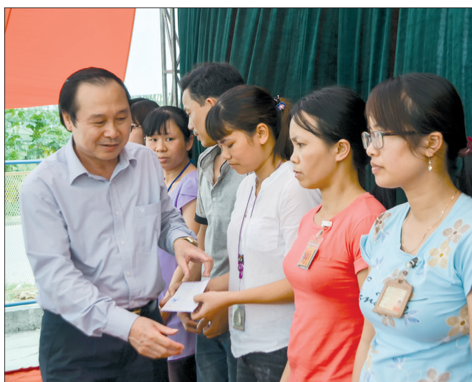
Lãnh đạo huyện Quỳnh Phụ trao quà cho công nhân có hoàn cảnh khó khăn.

Những năm qua, các cấp công đoàn huyện Quỳnh Phụ thường xuyên bám sát cơ sở, phát huy vai trò trong việc chăm lo, bảo vệ quyền, lợi ích hợp pháp, chính đáng của người lao động.