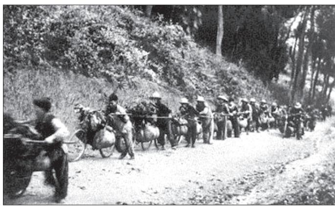
Xe đạp thổ hàng ra chiến trường.

Cuối năm 1953, đầu năm 1954, cả nước dành hết mọi nguồn lực chi viện sức người, sức của cho mặt trận Điện Biên Phủ đánh thực dân Pháp. Nhiều người Thái Bình cũng tham gia chiến dịch năm đó. 64 năm đã qua nhưng những kỷ vật thời chiến như chiếc bị đóng, ống gô, chiếc áo trấn thủ, mảnh dù của quân Pháp đến nay vẫn được các cựu chiến binh (CCB) tham gia chiến dịch năm đó lưu giữ cẩn thận cùng những câu chuyện ở chiến trường khiến chúng tôi cũng như được hòa mình vào không khí ngày chiến thắng 7/5/1954. Khi đó, quân đội Pháp xây dựng một pháo đài quân sự xung quanh lòng chảo Điện Biên Phủ với 3 phân khu: Bắc, trung tâm, Nam. Chúng cho san phẳng mọi chướng ngại vật xung quanh để tạo tầm nhìn và tầm tác chiến, điều đó đồng nghĩa với việc quân đội ta muốn tiến lại gần sẽ hết sức khó khăn bởi những bãi mìn, bãi dây thép gai chằng chịt cùng một khu căn cứ chiến lược được xem là "pháo đài bất khả xâm phạm" lúc bấy giờ. Về phía Quân đội nhân dân Việt Nam, dưới sự chỉ huy của Đại tướng Võ Nguyên Giáp, không khí chiến đấu hừng hực ngút trời. Các chiến sĩ của ta đã xây dựng một giao thông hào bao vây lòng chảo Điện Biên Phủ; từng tấn vũ khí, đạn dược, nhu yếu phẩm từ dưới xuôi được vận tải bằng những chiếc