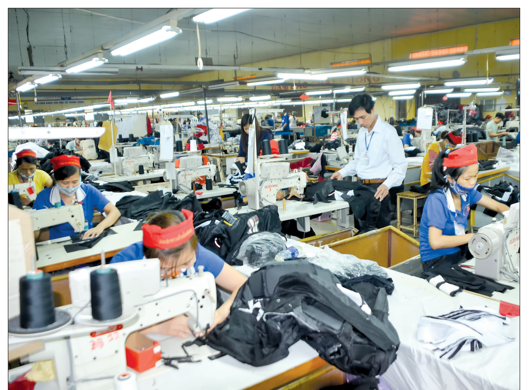
Xí nghiệp May xuất khẩu Hoàng Anh (thị trấn Quỳnh Côi, Quỳnh Phụ) tạo mọi điều kiện cho người lao động trong quá trình làm việc.

hoàn cảnh khó khăn và con CNVCLĐ bị nhiễm chất độc da cam/Đioxin, khuyết tật không tự phục vụ được bản thân. Thăm hỏi, tặng quà CNVCLĐ có hoàn cảnh đặc biệt khó khăn và công nhân lao động bị tai nạn lao động nhân tháng công nhân hàng năm. Để nghị Liên đoàn lao động tỉnh hỗ trợ kinh phí xây dựng nhà mái ấm công đoàn cho 27 đoàn viên có hoàn cảnh đặc biệt khó khăn trị giá 745 triệu đồng; biểu dương con CNVCLĐ có nhiều thành tích trong học tập; tổ chức cho cán bộ, đoàn viên CNVCLĐ đi trao đổi, học tập kinh nghiệm và tham quan du lịch đã tạo không khí vui vẻ, phấn khởi, làm tăng sức thi đua lao động trong CNVCLĐ. Với phương châm không ngừng nâng cao năng suất, chất lượng và hiệu quả trong công tác và lao