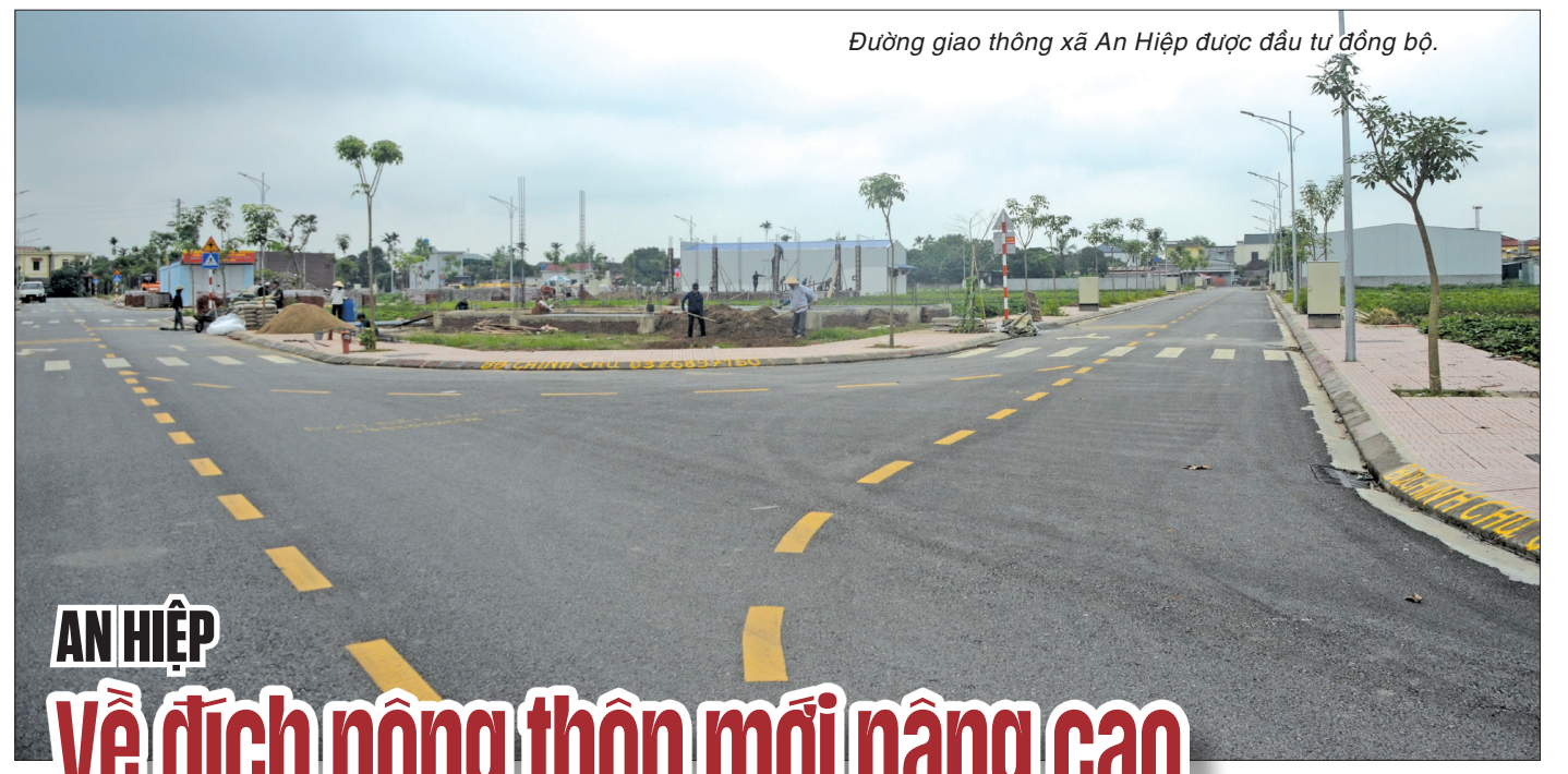
Đường giao thông xã An Hiệp được đầu tư đồng bộ.