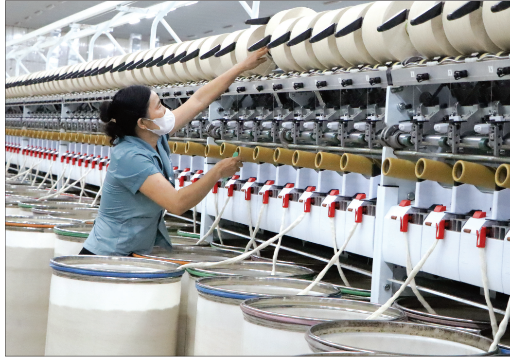
Công ty TNHH Logitex (cụm công nghiệp Vũ Ninh) tạo việc làm cho hơn 100 lao động.

Những năm qua, ngành dệt may phát triển mạnh trên địa bàn huyện Kiến Xương đã giúp nhiều lao động ở nông thôn có việc làm với thu nhập ổn định mà không cần phải ly hương.