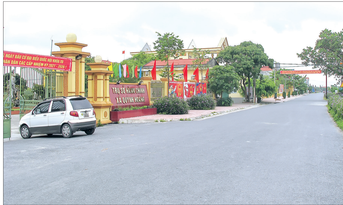
Hệ thống giao thông của xã Quỳnh Hoàng (Quỳnh Phụ) được đầu tư đồng bộ.