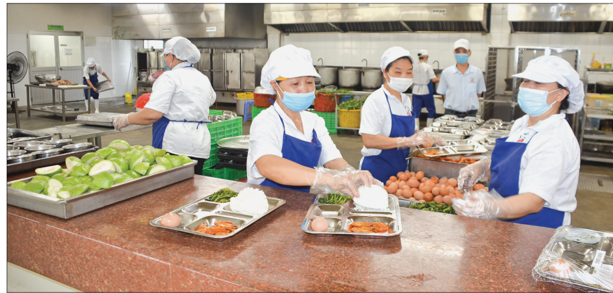
Công ty TNHH Yazaky Hải Phòng Việt Nam chi nhánh Thái Bình luôn quan tâm đến chất lượng bữa ăn ca để nâng cao sức khỏe cho người lao động.