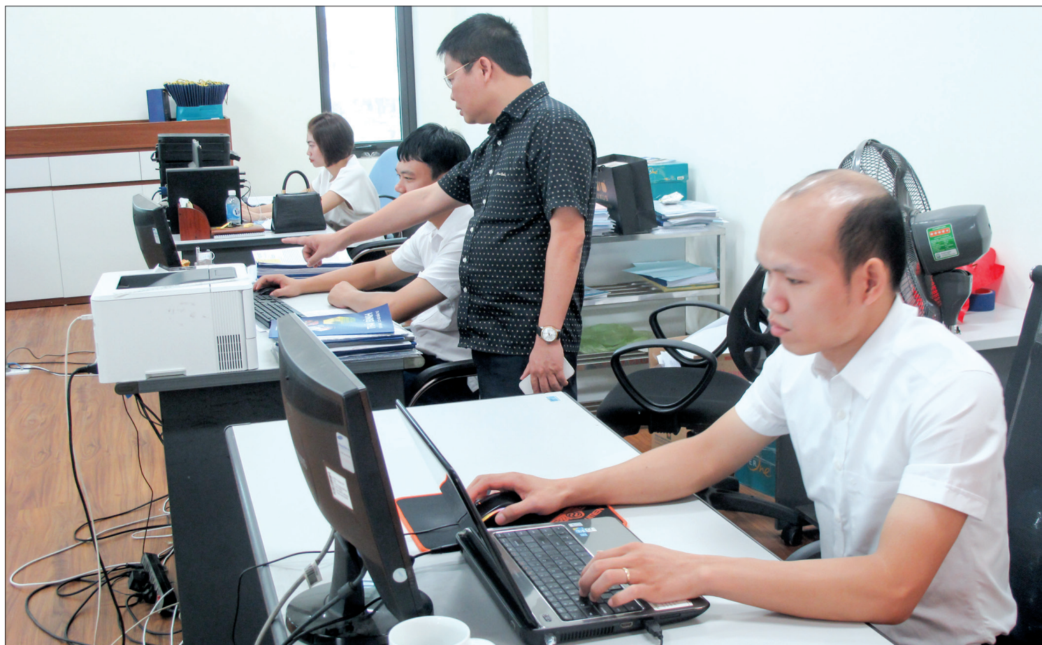
Đội ngũ cán bộ, nhân viên Phòng Xúc tiến đầu tư, Trung tâm Hỗ trợ, xúc tiến đầu tư và phát triển tỉnh trực thuộc Văn phòng UBND tỉnh luôn nỗ lực hoàn thành tốt nhiệm vụ được giao.

Khắc ghi lời Bác “Thi đua, khen thưởng là động lực phát triển”, thời gian qua, Văn phòng UBND tỉnh đã chú trọng triển khai sâu rộng các phong trào thi đua, qua đó tạo động lực để đội ngũ cán bộ, công chức, viên chức, người lao động nỗ lực hoàn thành tốt nhiệm vụ chuyên môn, đáp ứng yêu cầu công tác chỉ đạo, điều hành của UBND tỉnh, lãnh đạo UBND tỉnh.