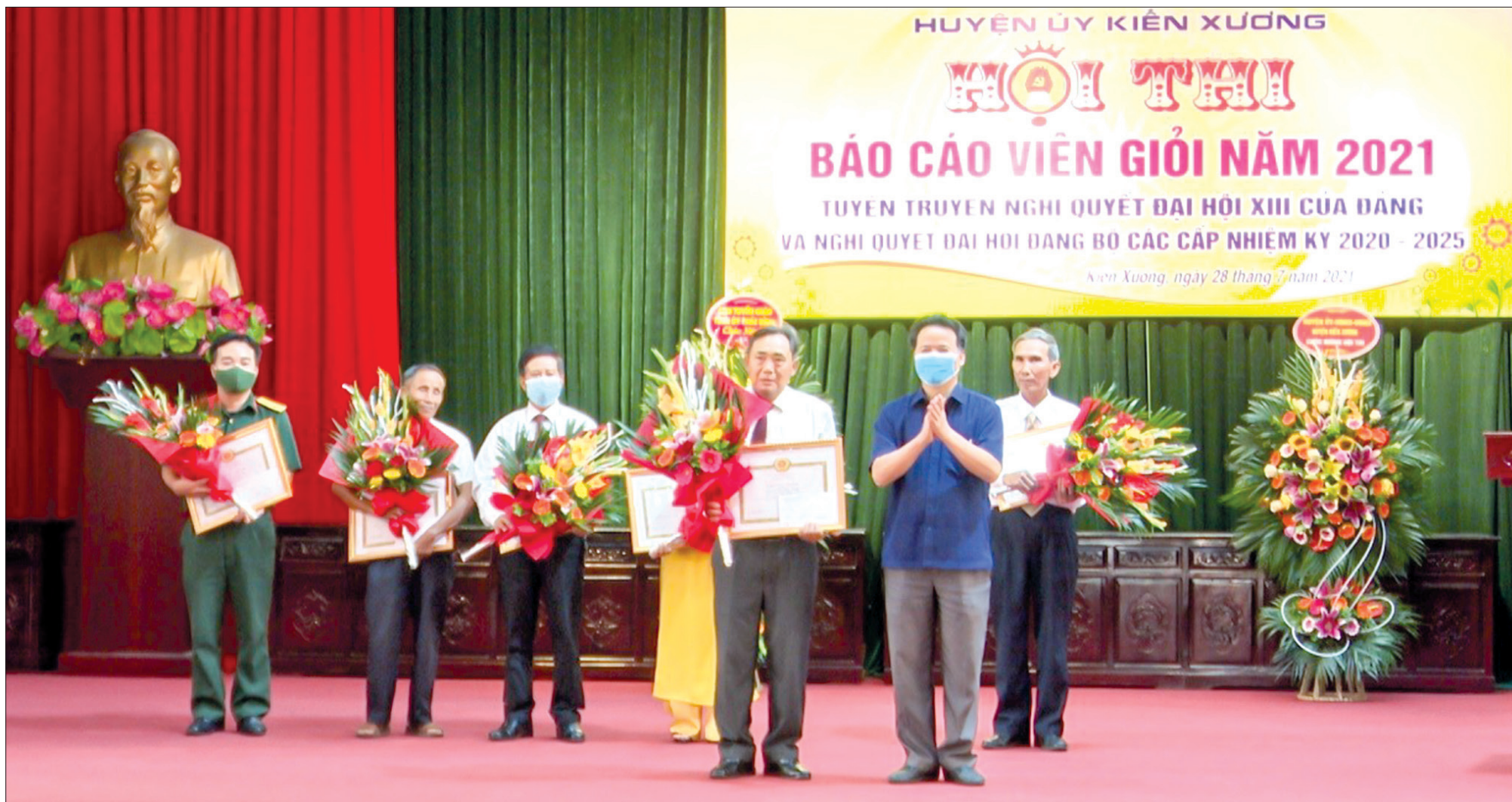
Báo cáo viên cơ sở tham dự hội thi báo cáo viên giỏi huyện Kiến Xương năm 2021.

Thái Bình là một trong số không nhiều tỉnh, thành phố trong cả nước thành lập và duy trì ổn định, hiệu quả hoạt động của ban tuyên giáo cấp xã. Những năm qua, cùng với hệ thống tuyên giáo của tỉnh, ban tuyên giáo đảng ủy xã, phường, thị trấn đã có nhiều đóng góp trong việc tuyên truyền các chủ trương, đường lối của Đảng, Nhà nước, tăng cường sự đồng thuận của cán bộ, đảng viên cơ sở, góp phần thực hiện thắng lợi các mục tiêu phát triển kinh tế - xã hội.