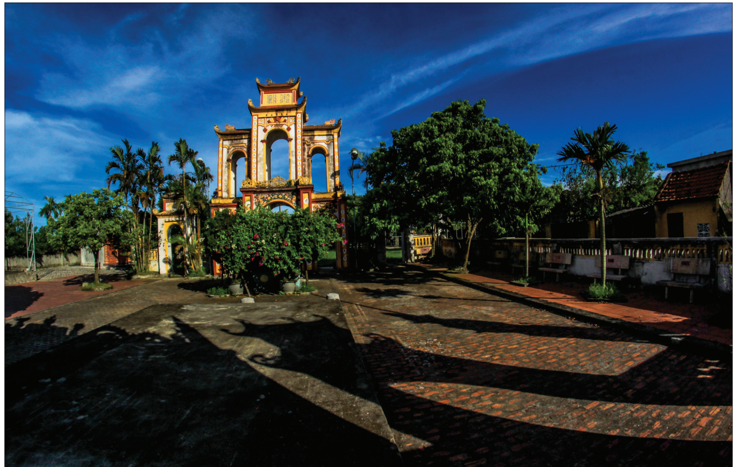
Cụm di tích lịch sử đền, chùa, đình Sơn Thọ, xã Thái Thượng, huyện Thái Thụy.