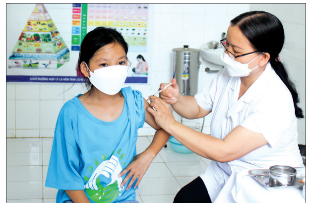
Tiêm vắc-xin phòng Covid-19 cho học sinh.

Tổng số bệnh nhân Covid-19 đang điều trị tại các cơ sở y tế 53 bệnh nhân, trong đó 7 bệnh nhân ở bệnh viện tuyến tỉnh và 46 bệnh nhân điều trị ở các bệnh viện tuyến huyện.