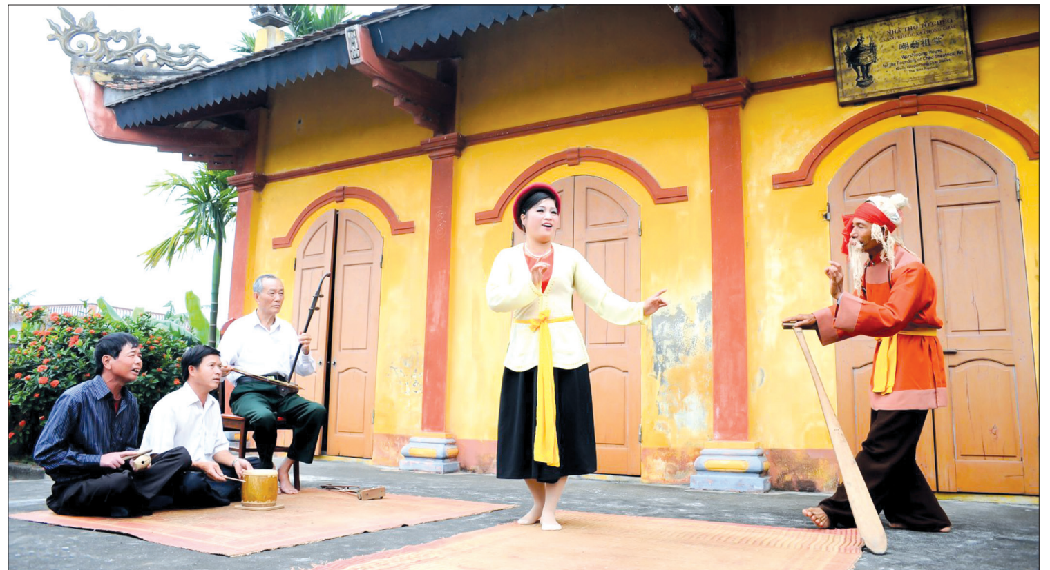
Chiếng chèo làng Khuốc.

Thực tế điển dã cho thấy chèo sân đình trong các làng xã của huyện Đông Hưng có thể đã hình thành muộn nhất là vào giữa thế kỷ XVIII và phát triển đến mức khá phổ biến vào những thập niên đầu thế kỷ XX. Ngoài làng chèo Khuốc nổi danh tứ xứ với những gánh chèo truyền đời, có thể điểm đến các làng có ít nhất là một vài gánh chèo đi hành nghề trong và ngoài làng với những ông trùm, những đào kép, những tay nhạc, những mảng trò được dân gian truyền tụng như: Thượng Liệt, Thượng Tâm, Lịch Động, Nguyên Xá, Tăng, Phạm, Tuộc, Hoàng Quan... Theo hương ước cổ của nhiều làng trong huyện thì dường như làng nào vào đám cũng có hát chèo theo sự lệ được ghi trong thần tích. Hầu hết các gánh đi lưu diễn ở khắp nơi nhưng theo khoán lệ thì cứ vào ngày 12 - 13 tháng 8 là về quê tế tổ nghề tại nhà ông trùm rồi ra tế ở đình. Theo số liệu khảo sát, từ giữa thế kỷ XVIII đến năm