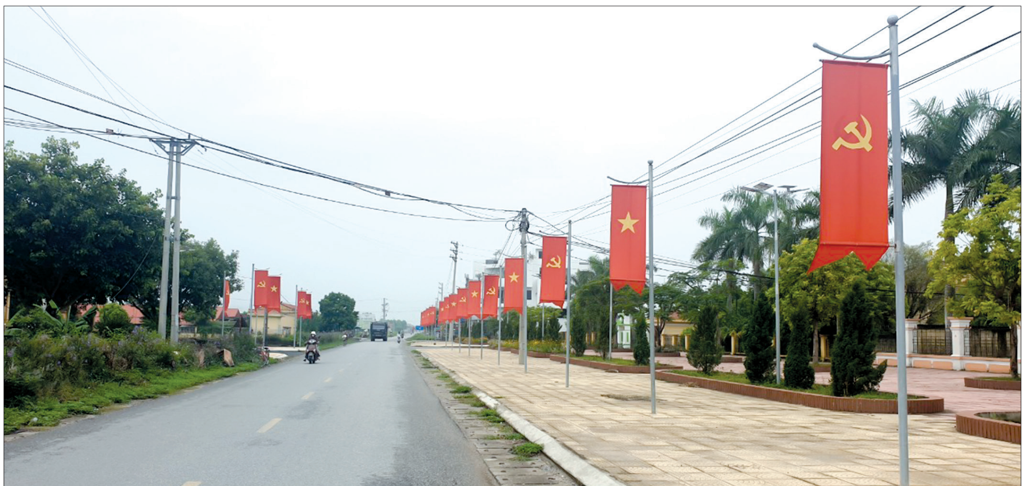
Diện mạo nông thôn mới xã Quỳnh Giao.

Mảnh đất Quỳnh Giao hôm nay đang đổi thay rõ rệt. Tiếp nối truyền thống, trong giai đoạn mới, Đảng bộ và nhân dân trong xã luôn đoàn kết, thống nhất, xây dựng Đảng bộ trong sạch, vững mạnh, xây dựng quê hương ngày một giàu đẹp, văn minh.