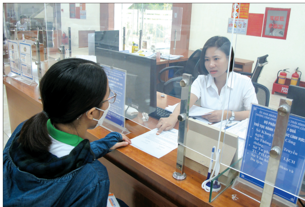
Người dân nhận kết quả giải quyết thủ tục hành chính tại Trung tâm Phục vụ hành chính công tỉnh.

phối hợp liên ngành; chủ động phối hợp với các ngành, các cấp tham mưu giúp UBND tỉnh đề ra nhiều chủ trương, giải pháp lãnh đạo và tổ chức thực hiện các nhiệm vụ phát triển kinh tế - xã hội. Đặc biệt trong thời gian qua, Văn phòng đã tham mưu UBND tỉnh chỉ đạo quyết liệt, hiệu quả các giải pháp phòng, chống dịch Covid-19; kiểm soát tốt tình hình dịch tạo điều kiện thuận lợi phát triển kinh tế - xã hội. Kịp thời tham mưu UBND tỉnh chỉ đạo thực hiện hiệu quả các giải pháp phục hồi, phát triển kinh tế, trong đó chú trọng tham mưu UBND tỉnh các biện pháp đẩy nhanh tiến độ thực hiện các dự án trọng