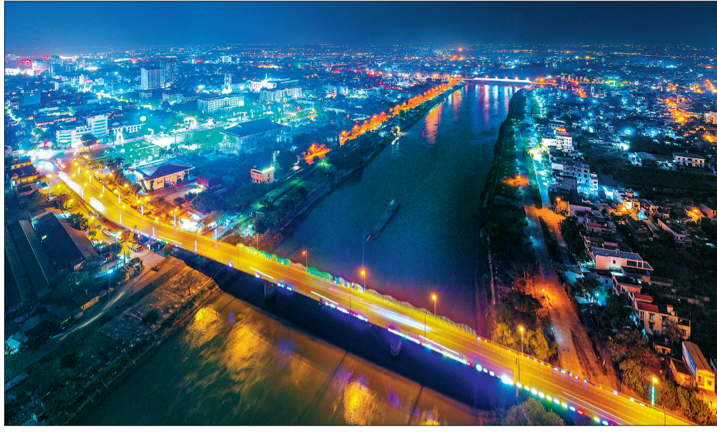
Cầu Bo, thành phố Thái Bình.

Từ một thị xã nhỏ bé, nghèo nàn, lạc hậu nay là đô thị loại II, trung tâm chính trị, kinh tế, văn hóa, xã hội của tỉnh, thành phố Thái Bình đã vươn lên trở thành một thành phố năng động với kinh tế tăng trưởng vượt bậc, kết cấu hạ tầng đô thị, nông thôn được đầu tư xây dựng theo hướng hiện đại, văn minh.