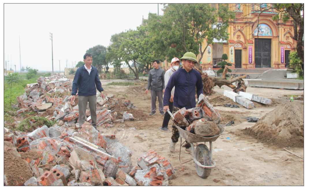
Giáo xứ Kinh Danh hiến gần 500m 2 đất phục vụ làm tuyến nhánh tiếp giao đường cứu hộ, cứu nạn.

Nhờ làm tốt công tác tuyên truyền, vận động, quá trình xây dựng nông thôn mới nâng cao của xã Nam Hải (Tiền Hải) luôn nhận được sự đồng thuận, hưởng ứng, tham gia tích cực của nhân dân. Qua đó phát huy sức mạnh tổng hợp và vai trò chủ thể của nhân dân hoàn thiện các tiêu chí theo kế hoạch.