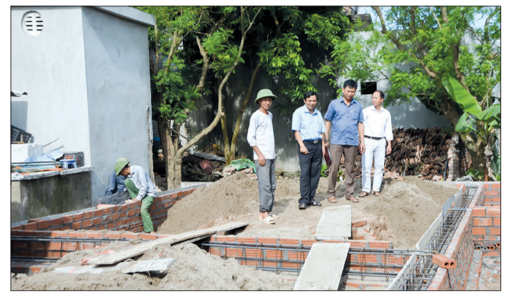
Kiểm tra tiến độ xây mới nhà ở cho người có công tại xã Tân Phong (Vũ Thư).

Thực hiện chỉ đạo của UBND tỉnh về việc xây dựng nhà ở cho người có công, hướng tới kỷ niệm 70 năm ngày Thương binh, Liệt sĩ (27/7/1947 - 27/7/2017), đến nay, trong số 450 nhà được hỗ trợ xây mới, sửa chữa theo Quyết định số 761, theo thống kê tại các huyện, thành phố, toàn tỉnh có 126 nhà đang tiến hành xây mới, 38 nhà sửa chữa, nhiều nhà đang trong giai đoạn hoàn thiện. Tuy nhiên, qua rà soát có một số gia đình người có công xin không xây mới vì một số lý do khác nhau. Từ nay đến trước ngày 27/7/2017, các địa phương phấn đấu hoàn thành xây mới, sửa chữa để người có công sớm được ở trong những ngôi nhà mới.