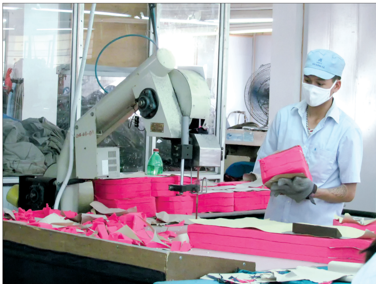
Công nhân Xí nghiệp May Hưng Hà luôn chấp hành tốt các quy định về an toàn vệ sinh lao động.

Những năm qua, Xí nghiệp May Hưng Hà thuộc Tổng công ty May 10 luôn chú trọng công tác an toàn vệ sinh lao động, phòng, chống cháy, nổ. Đây là một trong những yếu tố quan trọng góp phần đưa Xí nghiệp ngày càng phát triển, tạo việc làm ổn định cho hàng nghìn lao động.