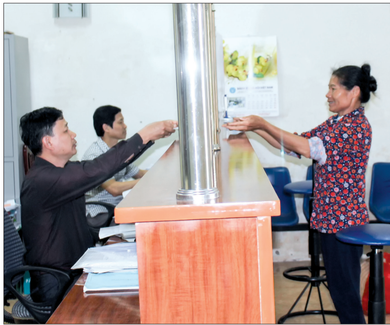
Giao dịch một cửa tại Bảo hiểm xã hội huyện Kiến Xương.

Cùng với Bình Định, các xã An Bình, Quyết Tiến, Minh Hưng, Vũ Lễ... cũng đã vào cuộc tích cực để nâng tỷ lệ dân số tham gia BHXH, BHYT. Nhờ đó, quý I/2017, toàn huyện có trên 6.840 người tham gia BHYT, trong đó hơn 4.000 người mới