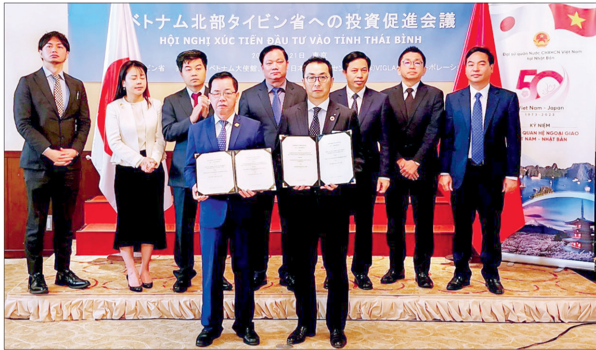
Các đồng chí lãnh đạo tỉnh và đại diện một số tổ chức kinh tế của Nhật Bản chứng kiến trao hợp đồng nguyên tắc hợp tác hoạt động chế biến gạo tại Việt Nam - dự án nhà máy chế biến gạo chất lượng cao tại Quỳnh Phụ - Thái Bình giữa Công ty Cổ phần Tập đoàn ThaiBinH Seed và Tập đoàn Satake.

có lực lượng lao động trẻ, dồi dào, được đào tạo cơ bản, với 2 trường đại học lớn, 4 trường cao đẳng và 26 cơ sở dạy nghề với quy mô đào tạo trên 35.000 người/năm, sẵn sàng đáp ứng nhu cầu đào tạo nguồn nhân lực chất lượng cao, đáp ứng nhu cầu về lao động của các doanh nghiệp... Ông Nguyễn Vũ Tùng, Đại sứ đặc mệnh toàn quyền Việt Nam tại Hàn Quốc chia sẻ: Những năm gần đây, tỉnh Thái Bình liên tục tổ chức các đoàn công tác đến thăm và làm việc tại Hàn Quốc cũng như tổ chức các hội nghị