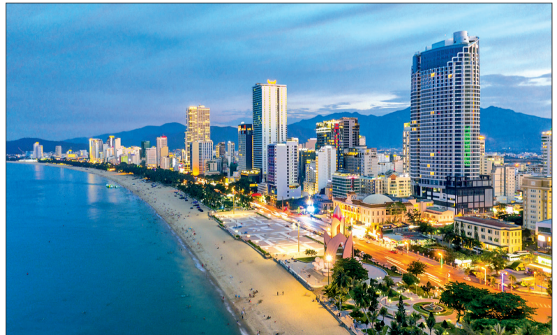
Condotel và khách sạn dọc bờ biển Nha Trang.

Sử dụng QR để tiếp nhận, giải quyết thủ tục hành chính Thông tư số 01/2023 của Văn phòng Chính phủ hướng dẫn việc áp dụng mã QR trong quá trình tiếp nhận, giải quyết thủ tục hành chính, hiệu lực từ ngày 25/5. Việc áp dụng cung cấp mã QR phải bảo đảm theo tiêu chuẩn Việt Nam TCVN 7322:2009 (ISO/IEC 18004:2006). Mã QR được in ở góc trên bên trái của các giấy tờ được xuất bản từ dữ liệu của Hệ thống thông tin giải quyết thủ tục hành chính. Trong đó, mã QR phải bao gồm mã số hồ sơ; mã thủ tục hành chính; mã định danh của tổ chức, cá nhân thực hiện thủ tục hành chính; tên giấy tờ được xuất bản, tên hệ thống thông tin cung cấp dữ liệu và thời điểm xuất bản. Ngoài ra, mã QR trên Giấy tiếp nhận và hẹn trả kết quả phải cung cấp thêm ngày hẹn trả kết quả; mã QR trên Kết quả giải quyết thủ tục hành chính phải cung cấp thêm dữ liệu về thời hạn, phạm vi có hiệu lực (nếu có).