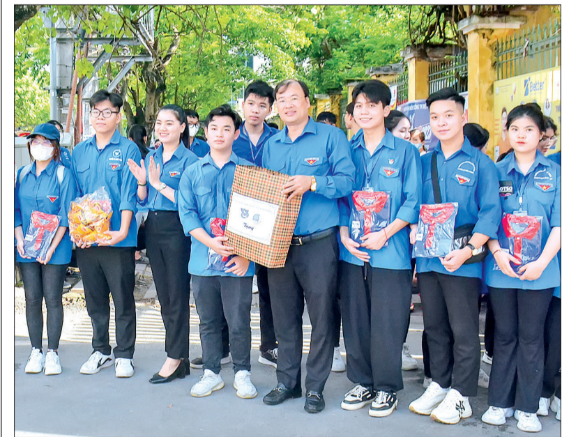
Lãnh đạo Tỉnh đoàn tặng quà, động viên thanh niên, sinh viên tình nguyện tiếp sức mùa thi tại điểm thi Trường THPT Lê Quý Đôn.

Sáng ngày 28/6, lãnh đạo Tỉnh đoàn tới động viên các đội thanh niên, sinh viên tình nguyện tiếp sức mùa thi tại các điểm thi trên địa bàn thành phố Thái Bình, huyện Đông Hưng.