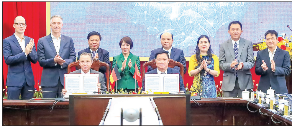
Ký kết bản ghi nhớ giữa UBND tỉnh Thái Bình và Phòng Thương mại và Công nghiệp Đức tại Việt Nam.