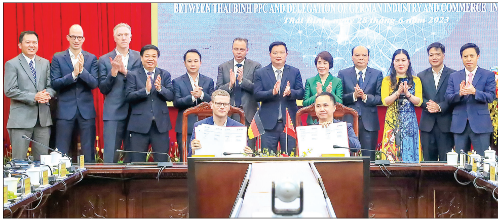
Ký kết bản ghi nhớ giữa Công ty Cổ phần Thái Bình Hưng Thịnh với Công ty Roding Mobility Cộng hòa Liên bang Đức.