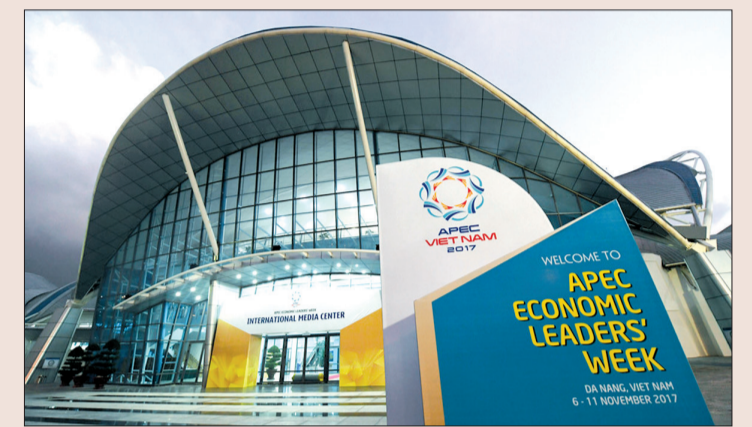
Trung tâm báo chí quốc tế - công trình trọng điểm của thành phố phục vụ tuần lễ cấp cao APEC 2017.