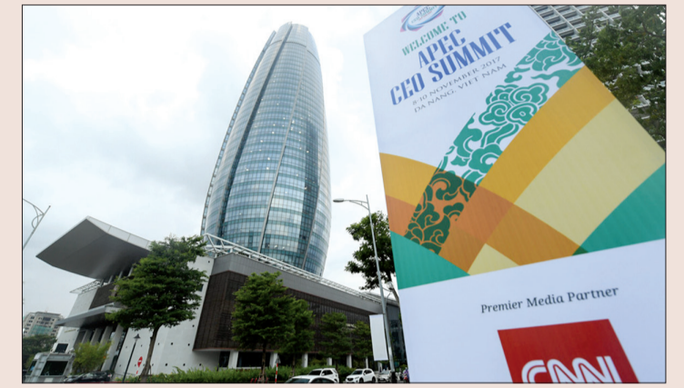
Trung tâm hành chính thành phố là một trong những địa điểm tổ chức các sự kiện trong khuôn khổ tuần lễ cấp cao APEC 2017.

(news.zing.vn) Thành phố Đà Nẵng khoác lên mình tấm áo mới xanh, sạch, lung linh sắc màu không chỉ đón chào tuần lễ cấp cao APEC 2017 mà còn quảng bá hình ảnh xinh đẹp với bạn bè quốc tế.