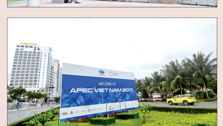
Nhiều tuyến đường của thành phố Đà Nẵng, trong đó có những tuyến đường dự kiến các đại biểu tham dự tuần lễ cấp cao APEC 2017 đi qua đã được nâng cấp, cải tạo...

Ngoài việc chọn cử những cán bộ tinh nhuệ tham gia bảo vệ các đại biểu tham dự hội nghị cấp cao APEC 2017, những ngày này các đơn vị làm nhiệm vụ sẵn sàng chiến đấu của Bộ CHQS tỉnh đang tổ chức luyện tập các phương án sẵn sàng ứng phó với các tình huống có thể xảy ra trên địa bàn tỉnh.