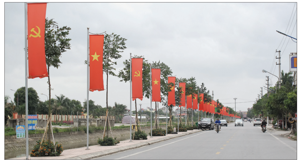
Cơ sở hạ tầng huyện nông thôn mới Quỳnh Phú.