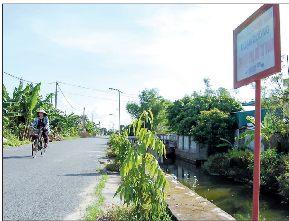
Đường giao thông nông thôn xã Quốc Tuấn (Kiến Xương).