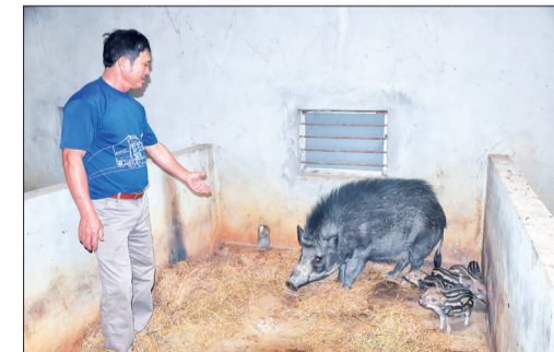
Nông dân xã Thụy Liên chăn nuôi lợn rừng cho hiệu quả kinh tế cao.

Nhiệm kỳ qua, Hội Nông dân xã Thụy Liên đã làm tốt công tác tuyên truyền, giáo dục chính trị, tư tưởng cho cán bộ, hội viên; củng cố, xây dựng tổ chức hội ngày càng phát triển; đã phối hợp với Hội Nông dân huyện, các cơ quan chuyên môn tổ chức 87 lớp tuyên truyền để sản xuất nông nghiệp, tập huấn chuyển giao khoa học kỹ thuật về trồng trọt, chăn nuôi, thú y, 8 lớp dạy nghề cho lao động nông thôn.