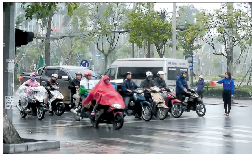
Thanh niên tình nguyện tham gia điều tiết giao thông.