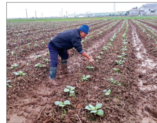
Người cao tuổi tích cực lao động sản xuất.

Hiện nay, huyện Hưng Hà có trên 33.500 người cao tuổi, sinh hoạt tại 266 chi hội. Nhằm chăm sóc tốt người cao tuổi, quý toàn dân chăm sóc và phát huy vai trò người cao tuổi của huyện đã huy động được 2,3 tỷ đồng. Trong năm 2017, toàn huyện có hơn 5.000 người cao tuổi được tổ chức chúc thọ, mừng thọ với số tiền 1,1 tỷ đồng; gần 10.000 người cao tuổi được hưởng trợ cấp xã hội và cấp thẻ bảo hiểm y tế miễn phí. Các cơ quan, doanh nghiệp, các nhà hảo tâm và nhân dân đã xây dựng 7 nhà đại đoàn kết và hỗ trợ sinh kế cho 2 người cao tuổi với số tiền 230 triệu đồng. Ngoài ra, thực hiện chương trình "Mắt sáng cho người cao tuổi", Ban đại diện Hội Người cao tuổi huyện đã phối hợp tổ chức khám bệnh, cấp thuốc miễn phí cho người cao tuổi xã Tân Hòa. Các hoạt động trên đã góp phần chăm sóc, động viên người cao tuổi sống vui, sống khỏe.