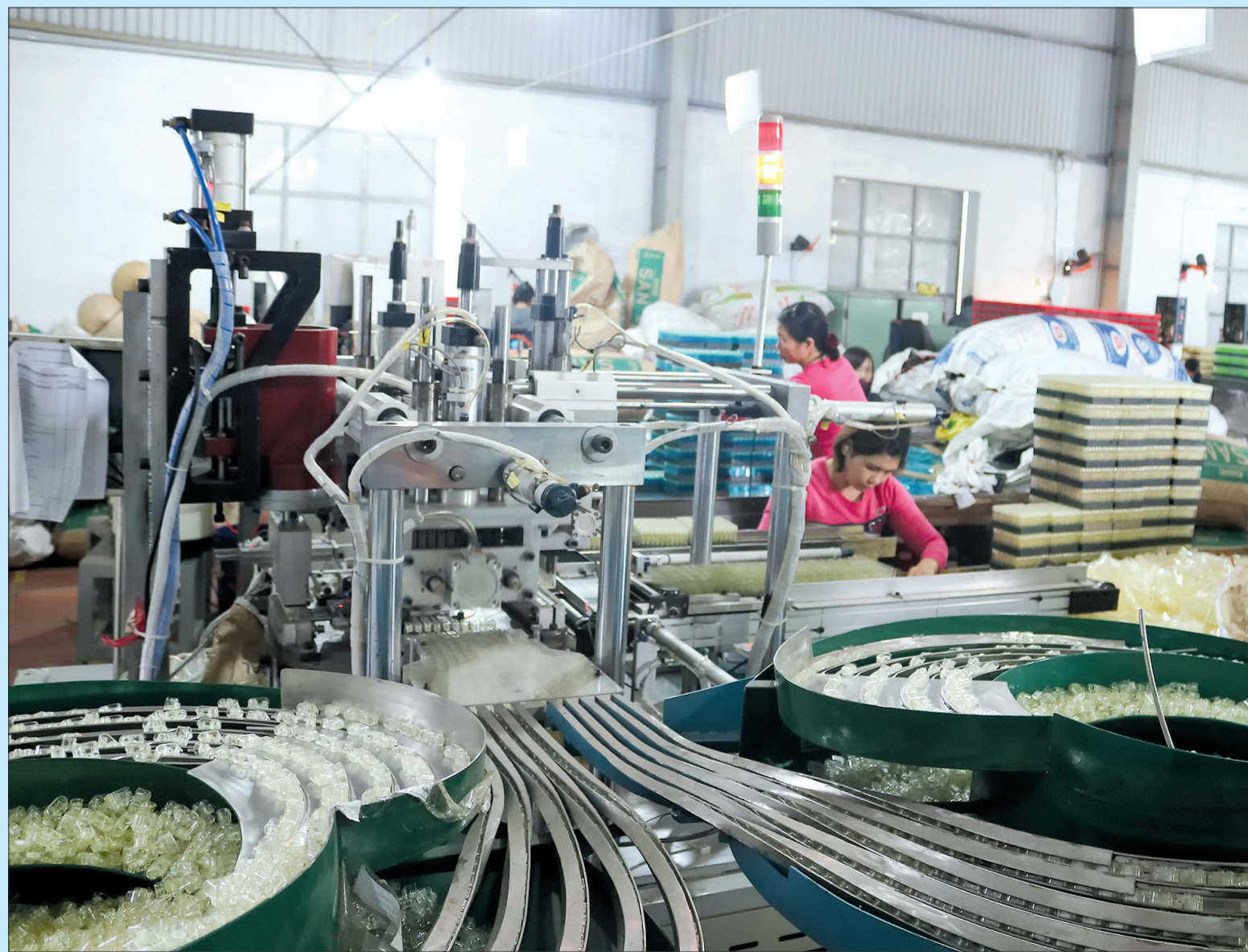
Dây chuyền sản xuất bột lửa của Công ty TNHH Hoa Việt (cụm công nghiệp Nguyễn Xá, Đông Hưng).