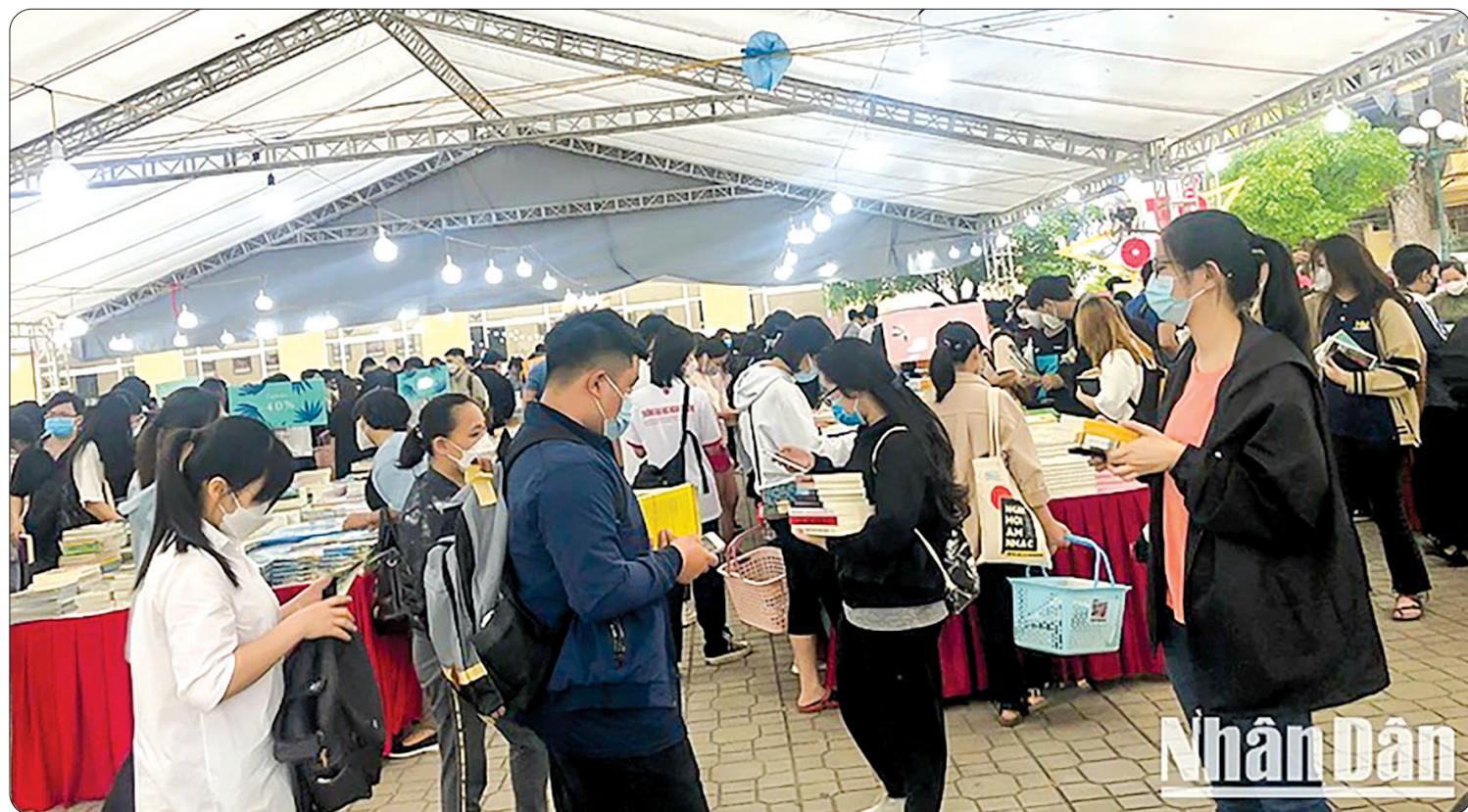
Các sự kiện giảm giá, khuyến mãi, tri ân khách hàng của các đơn vị xuất bản luôn thu hút đông đảo bạn đọc tham gia.

Tại các địa phương, với lực lượng nòng cốt là sở thông tin và truyền thông, sở văn hóa, thể thao và du lịch cùng hệ thống thư viện, các nhà xuất bản, doanh nghiệp phát hành xuất bản phẩm trên địa bàn, nhiều hoạt động phong phú, đa dạng, thiết thực chào mừng ngày Sách và văn hóa đọc Việt Nam gắn với nhiệm vụ chính trị và các ngày lễ lớn trong năm 2024 sẽ được tổ chức trong tháng 4.