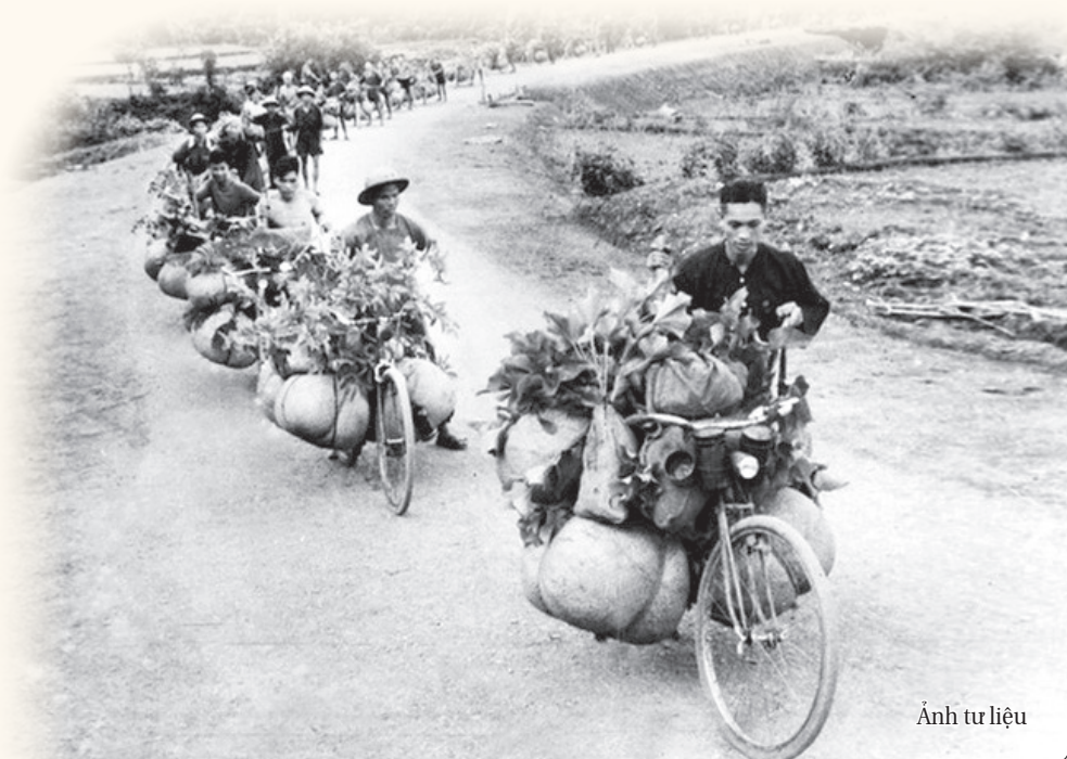
Ảnh tư liệu

Pha Đìn, Tuấn Giáo, Lũng Lô... Mãi còn in dấu xe thô Điện Biên.