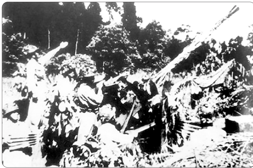
Trung đoàn 367 trong chiến dịch Điện Biên Phủ.

Để hỗ trợ cho chiến trường Điện Biên Phủ, không quân Pháp và Mỹ đã huy động đến 80% trong tổng số 400 máy bay có mặt ở Đông Dương. Tập đoàn cứ điểm được xây dựng 2 sân bay, riêng sân bay