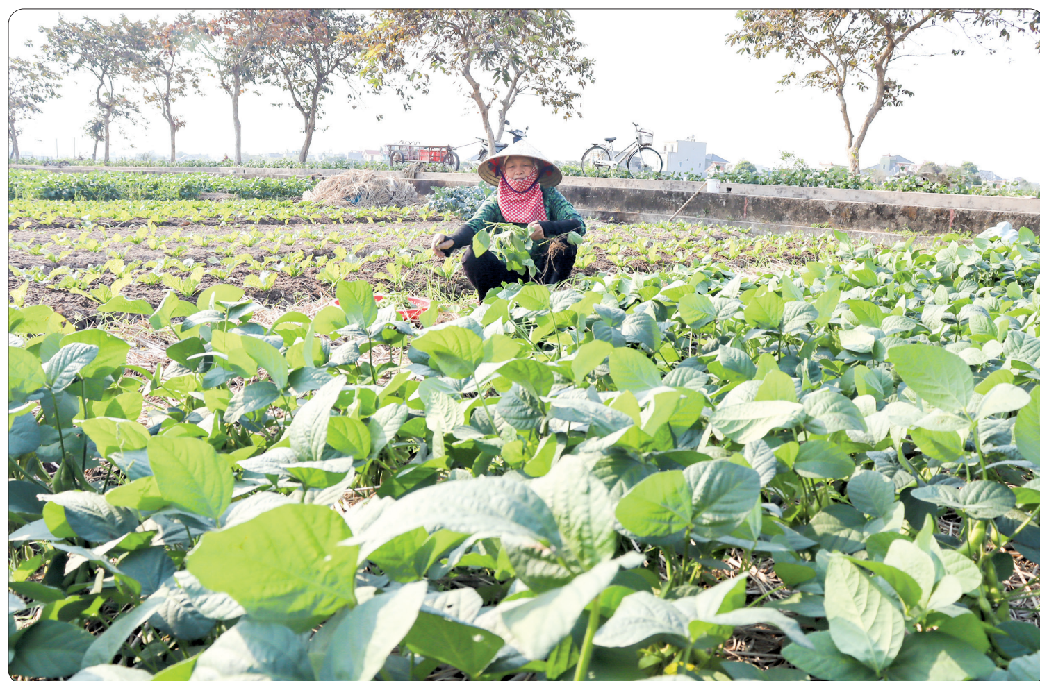
Cánh đồng cây màu ở xã Quang Trung.

Thời gian tới, huyện Kiến Xương tiếp tục thực hiện đa dạng các phong trào thi đua; quan tâm đổi mới công tác tổ chức các phong trào theo hướng thiết thực, hiệu quả, góp phần thực hiện thắng lợi các mục tiêu phát triển kinh tế - xã hội đã đề ra.