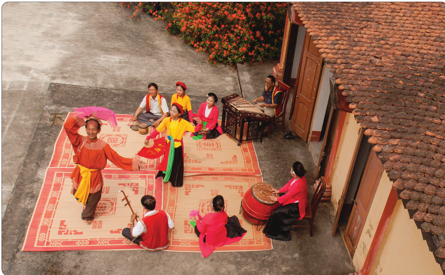
Chiếng chèo làng Khuốc, một trong ba chiếng chèo cổ trong tam giác chèo của trấn Sơn Nam nay là Thái Bình vẫn được duy trì và truyền dạy cho lớp trẻ ngày nay.